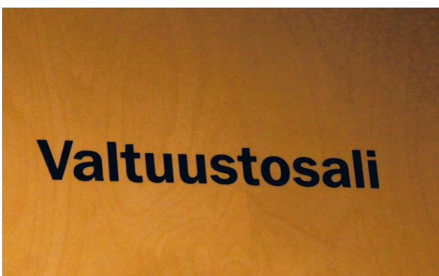
Vimpelin kunnanvaltuutettujen määrä muuttuu ensi vuonna.