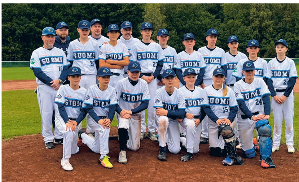
Suomen Baseballin U15 maajoukkue pelasi viikonloppuna Tukholmassa Pohjoismaiden mestaruudesta.

Turnaus osoitti, että joukkue on ottanut ison harppauksen