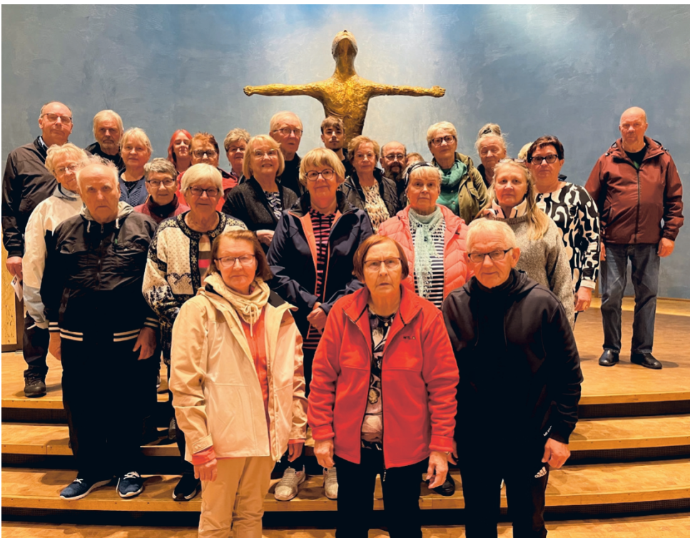
Kuvassa ruskaretkeläiset Altan Revontuli -kirkossa

Altassa vierailimme v.2013 valmistuneessa Revontuli-kirkossa. Ihastelimme Altan