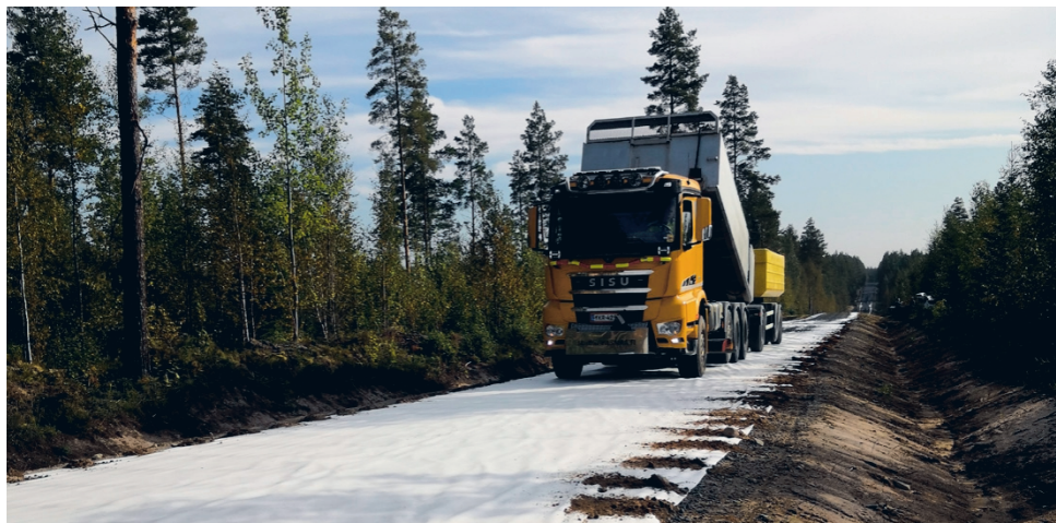
Suodatin-kankaat levitettiin sopiva pätkä kerrallaan päällysteyrakkoitsijan toiveiden mukaan. Levityksen jälkeen ajettiin heti ensimmäinen kuorma 0/32 mursketta, jotta tuuli ei päässyt viemään kankaita mennessään. Mursketta tuli kahdella täysperävaunurekalla.

Työ tarkoitti ojalinjojen perkuuta ja alitusrumpujen uu-