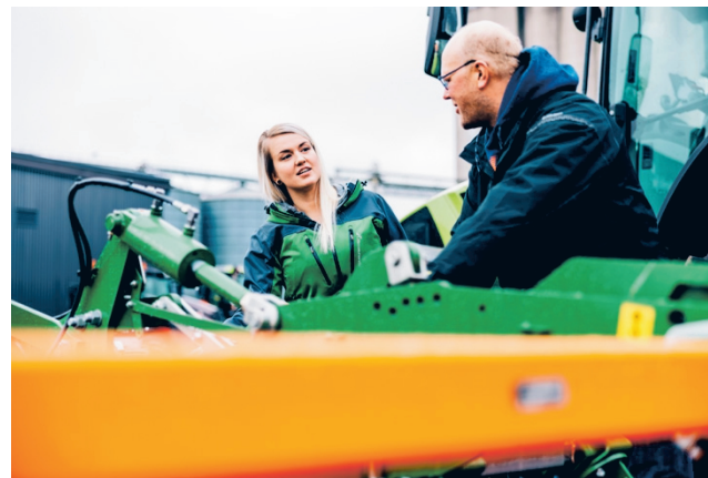
Järvisen kv-rekrymessuilla kansainväliset opiskelijat ja yritykset kohtaavat toisensa.

AMK-tutkintoihin sisältyy pakollinen työharjoittelu sekä opinnäytetyö, ja molemmat näistä tarjoavat yrityksille