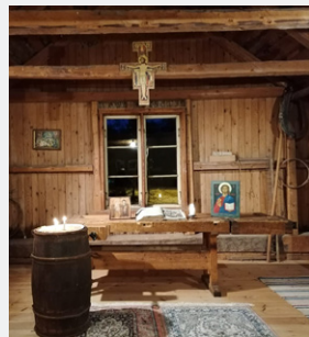
Leijon vinttikirkon näkymä on vuoden aikana tullut monelle katsojalle tutuksi.

Rukoushetkien sisältö koostuu kirkkovuoden mukaisista viikon raamatunteksteistä, rukouksesta ja laulusta. Verkon kautta nähtävät rukoushetket ovat olleet kestoltaan muutaman minuutin.