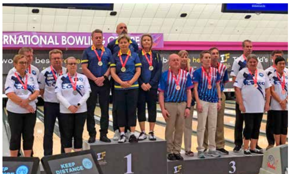
Suomen molemmat sekaparijoukkueet nousivat podiumille! Näin varmistui se, että kaikki senioripelaajat saavuttivat MM-mitalin Dubaista.