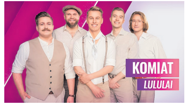
Komiat osallistui 2026 Uuden Musiikin Kilpailuun kappaleellaan Lululai saavuttaen upeasti kolmannen sijan.

– Junalla olen matkustanut viimeisen vuoden aikana yli