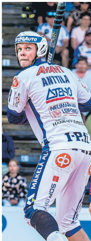
Itä-Länsi sekä muut pesisfestivaalien pelit tuovat Saarikentälle huikaita tunnelmia ja tilanteita ensi kesänä.

Tapahtuman toteuttamiseen tarvitaan myös suuri joukko