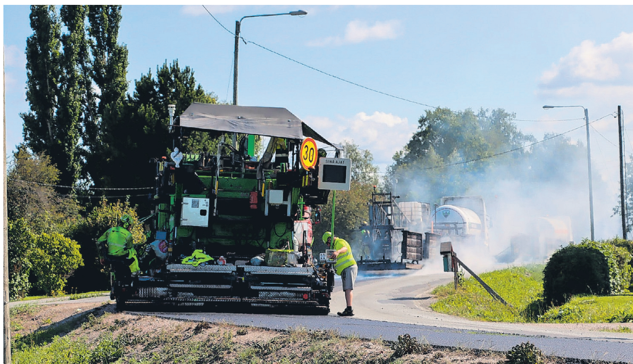
Päällystystyöt käynnistyvät noin toukokuun puolessa välissä ja jatkuvat lokakuun loppuun saakka.

Yhteensä noin 6000 kilometrin toimialueen päällystetystä tieverkosta jo noin neljäsosa luokitellaan huonokun-