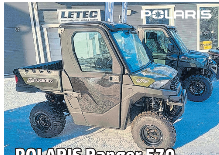
POLARIS Ranger 570 ProFit hytillä. Heti varastosta!