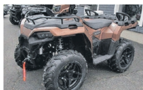
SPORTSMAN 570 EPS SE PREMIUM LE NYT! 10990€