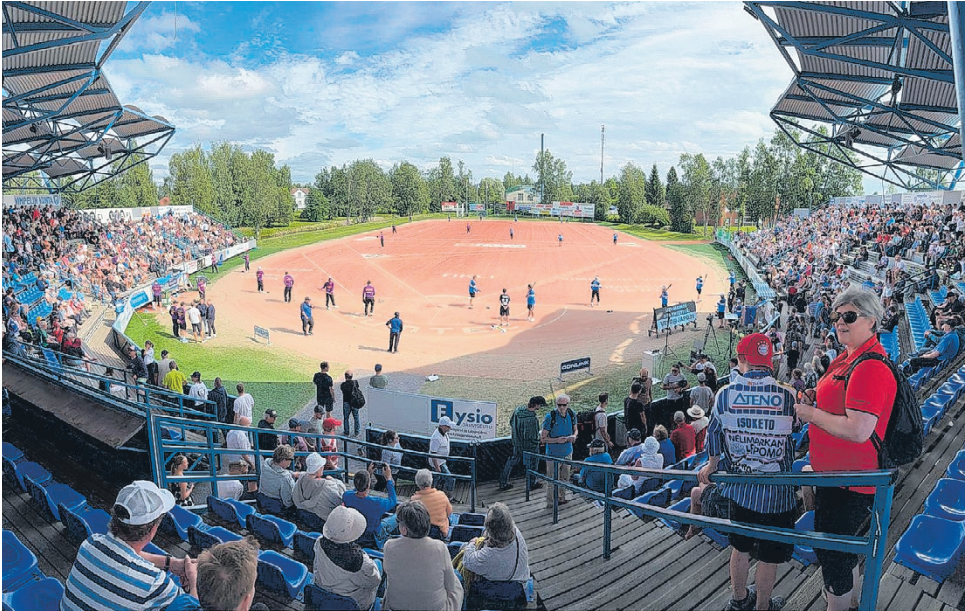
Saarikenttä tarjoaa Itä-Länsi otteluille ainutlaatuisen ympäristön. Liput myytiin lähes loppuun ennätysajassa ja lisäkatsojia on jouduttu suunnittelemaan.

Tänä kesänä festivaalit järjestetään 8.–18. heinäkuuta. Pesäpallolla on luonnollisesti tapahtuman ytimessä, mutta ohjelma ulottuu paljon laajem-