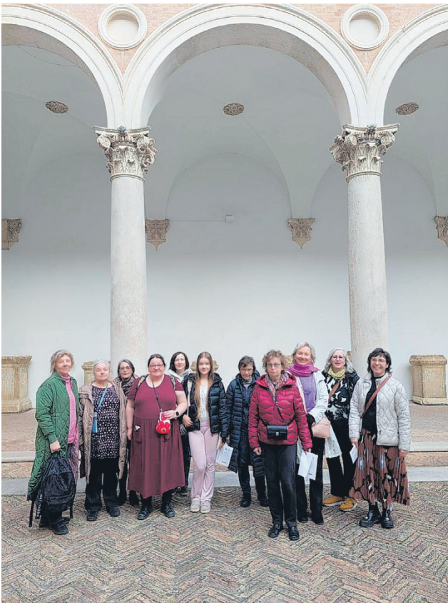
Opintomatkalaiset yhteiskuvassa. Taustalla Urbinon Palazzo Ducale.

Cecilia Ciampaoli opettaa.