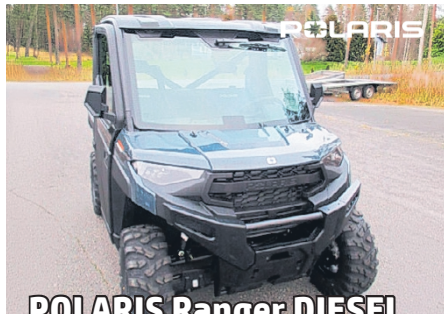
POLARIS Ranger DIESEL Deluxe ProFit hytillä. Heti varastosta!