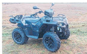
SPORTSMAN 570 EPS BLACK EDITION NYT! 12490€