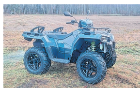
SPORTSMAN 570 EPS STEALTH GREY TURF NYT! 11490€