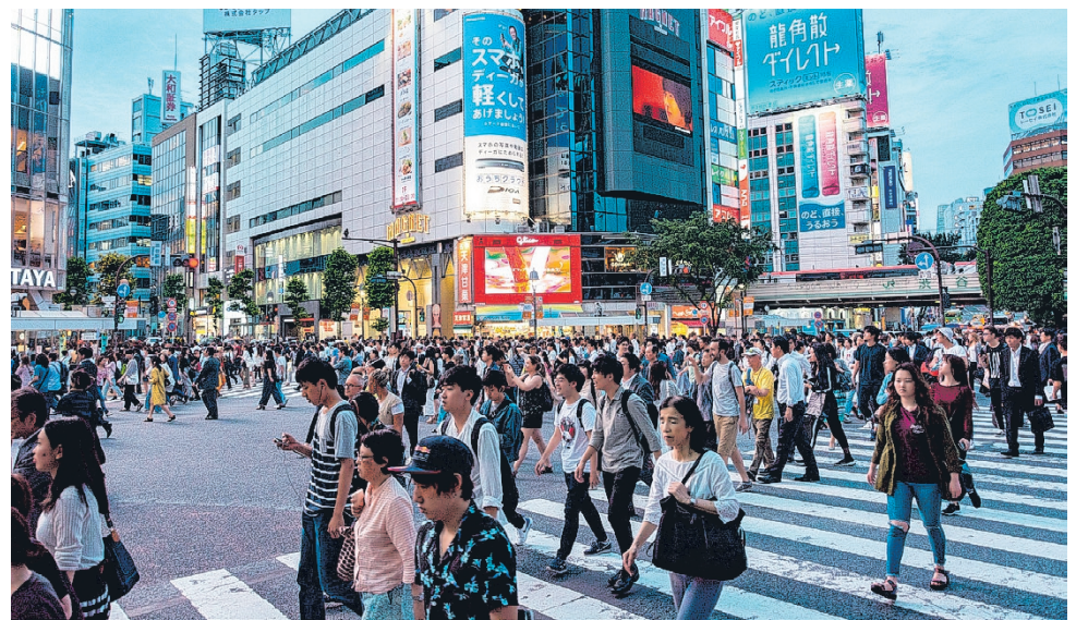
Järviseudun lukiolaiset voivat osallistua Global Scientist Award Finland 2026 -kilpailuun tutkimusideoillaan. Kilpailun voittaja pääsee edustamaan aluetta kansainvälisessä loppukilpailussa Japanissa 8. marraskuuta 2026.

Tänä vuonna GSA-kilpailuorganisaatio on jälleen kutsunut Järviseudun lukioalueen edustamaan Eurooppaa Kagoshimassa 8. marraskuuta järjestettävään kansainväliseen kilpailuun. Mukana ovat kaikki Alajärven, Lappajärven ja Vimpelin lukioiden lukioluokat. Alueen kiinnostavuutta on lisännyt myös Kraatterijärven