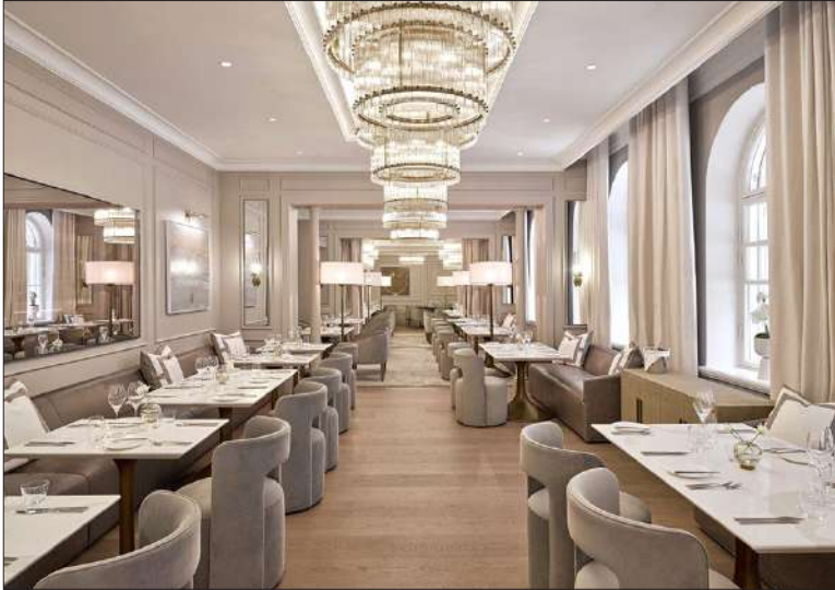
Ravintola Lilja on hotellin pääravintola.

HOTELLI koostuu neljästä 1880-luvun historiallisesti merkittävästä arvorakennuksesta, joiden väliin jäävälle sisäpihalle avautuu terrassiravintola Garden