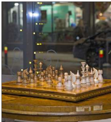
Shakkipeli alkoi sisilialaisella puolustuksella.

tä noin joka toinen helsinkiläinen asuu yksin.