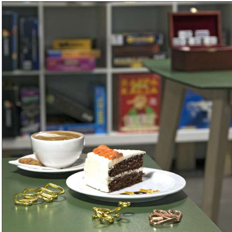
GTC Caféssa voi nauttia palan herkullista kakkua hyvän kahvin ja pulmapelin kera.

Kahvilan kirjastossa on vaatimattomasti reilu 110 erilaista lau-