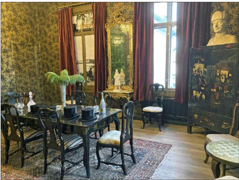
Mannerheim-kabinetissa on monia kiinnostavia yksityiskohtia, kuten tapettiin kätkeytyvä salaovi.

Mannerheimin kabinetissa on Mannerheimille kuulunut pöytä ja muuta esineistöä. Löytöjäkin purkutöiden yhteydessä on tehty. Viinakassana toimineen tilan lattian alta löytyi varasto vanhoja pulloja. Yksi pulloista oli ollut tutun näköinen ja Kallio julkaisi kuvan siitä sosiaalisessa mediassa. Joku tunnisti pullon DOM Bene-