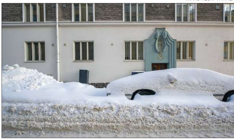
Runsaslumien talvi on haaste kaikkialla kaupungissa.

LUNTA on ensin vietävä katoilta ja pihoista sekä kadunvarsilta sopivaan paikkaan. Kaupunki voi käyttää läjityspaikkoina lähinnä laajoja risteysalueita ja toreja. Kaupungin hallinnoimiin puistoihin ei saa läjittää, koska asema-