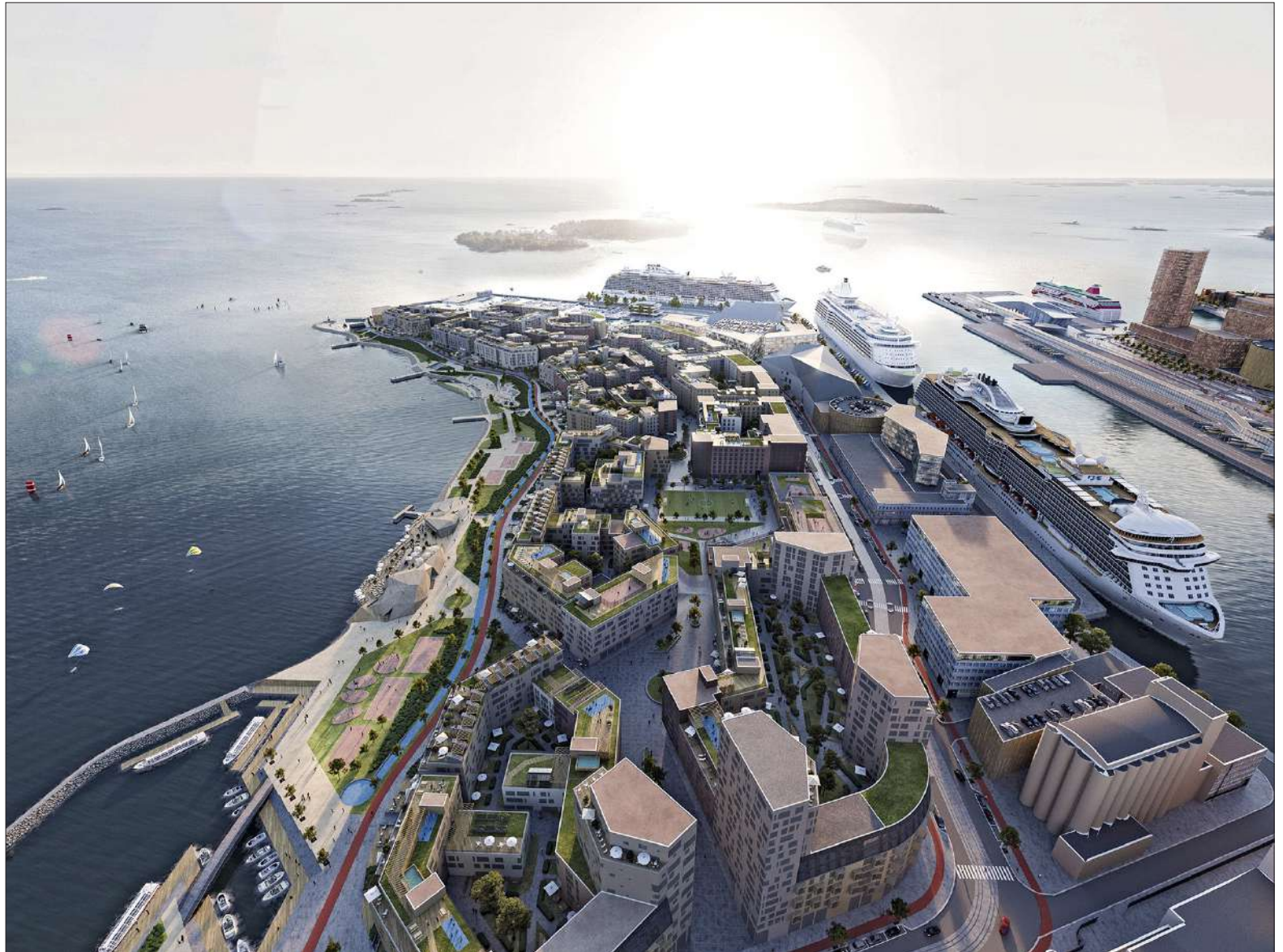
Havainnekuva Hernesaaren asuinalueesta. Nyt haetaan keinoja, joilla liikenteen sujuvuus varmistetaan Hernesaassa ja sen läheisyydessä.

”Tavoitteena on rakentaa virallinen uimaranta, joka houkuttaisi nykyistä enemmän uintiin kesäisin. Haasteen muodostavat uimapaikalla sijaitseva venelaituri sekä vesialueella liikkuvat veneet ja vesiskootterit. Vaaratilanteita voi siten syntyä, joten tilannetta on sel-