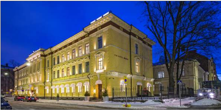
Mariankadun puoleista julkisivua.

Terrace. U-muotoisen rakennuskokonaisuuden sisäpiha on jo valmistunut, mutta pakkassää ei vielä houkuttele siellä oleskeluun. Lähempänä kesää otetaan käyttöön suihkulähteet ja ulkotakka.