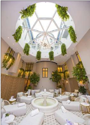
Suuri pyöreä kattoikkuna hallitsee Spa-kylpyläosastoa.

si makuuhuonetta, iso olohuone ja oleskelutila, kaksi yllistä kylpyhuonetta, höyrysauna ja oma keittiö. Imperial- sviittiin ja Penthouse – sviitteihin kuuluvat myös oman hovimestarin palvelut. Hovimestarin palvelu sisältää esimerkiksi laukkujen purkamisen ja pakkaamisen asiakkaan puolesta. Kokonaisuus on kaikilla mittareilla ainutlaatuinen niin Pohjoismaissa kuin muussa Euroopassa.