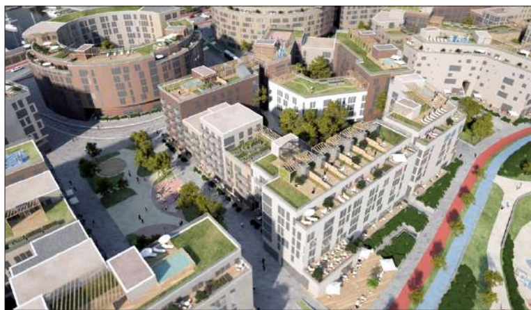
Silmiinpistävä piirre Hernesaaren kaavana mukaisessa rakentamisessa ovat runsaat viherkatot.

”Suojelutavoitteet on laadittu niin, että rakennuksen muutostyöt