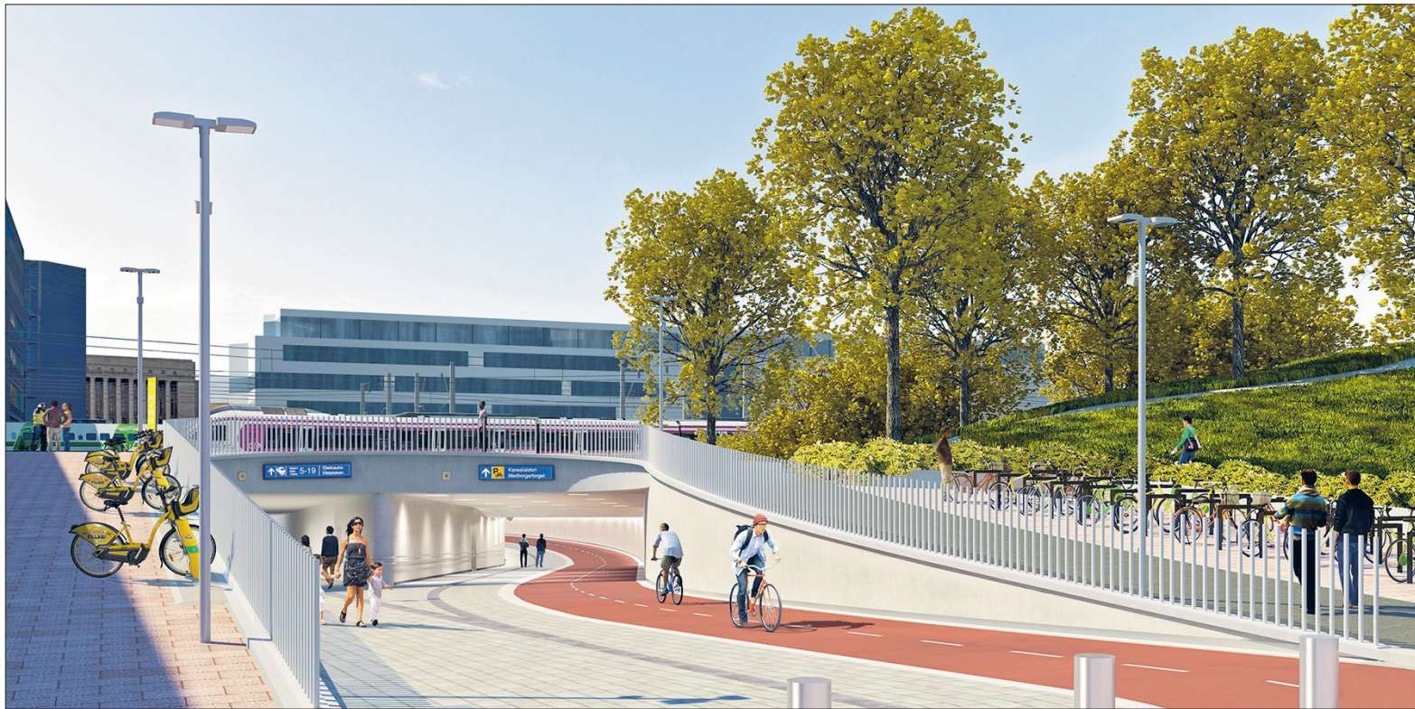
Havainnekuva Kaisantunnelin itäpään sisäänkäynnistä.

► Lisää -tapahtumista tapahtumat.hel.fi -sivuilla (hakusana ”Helsingin ruokavuosi 2024”) ja hel.fi/syotavahelsinki -sivuilla.