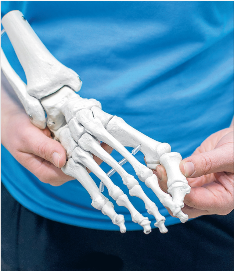
Vaivaisenluu vaivaa hyvin monia.