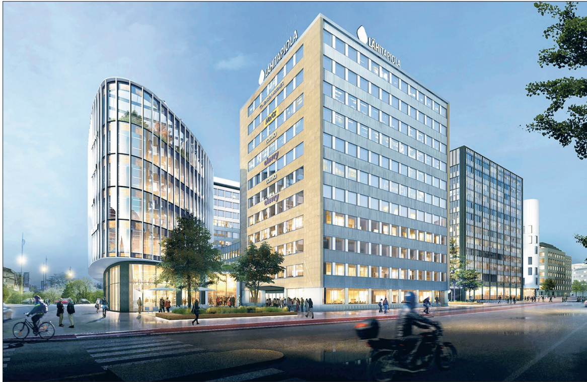
Havainnekuva Autotalokorttelin arkkitehtuurikilpailun voittajaehdotuksesta "Cabriolet".