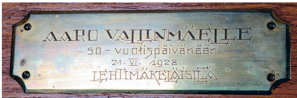
Kelloa koristaa kyltti, josta selviää että se lahjoitettiin saajalleen melko lailla tasan 98 vuotta sitten.