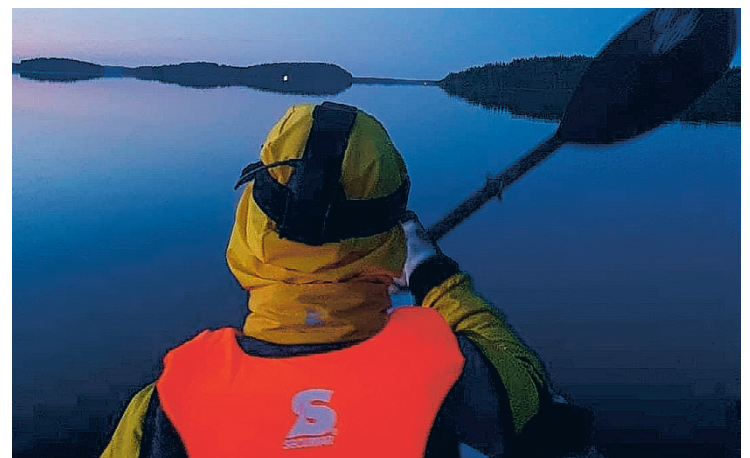
Saimaan keskellä aamuyöllä Saimaacross kilpailussa.

– Hyvää ja aurinkoista retkeilykesää kaikille, Koivunen toivottaa.