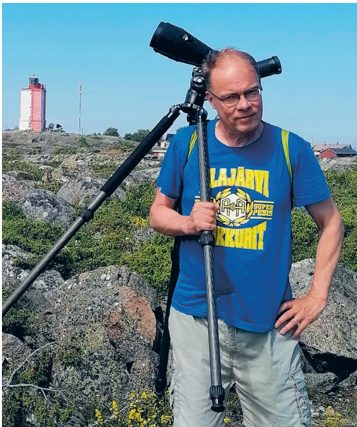
Bongausta Utön saarella.

– Erityisesti sen itäisen osan erämaa-alueet, kuten Antterimukka ja Paratiisikuru, tarjoavat sellaista hiljaisuutta ja avaruutta, jota ei muualta löydä. Siellä tuntee todella olevansa osa luontoa keskellä ei mitään ilman puhelinkenttiä. Joskus voi mennä useita päiviä näkemättä