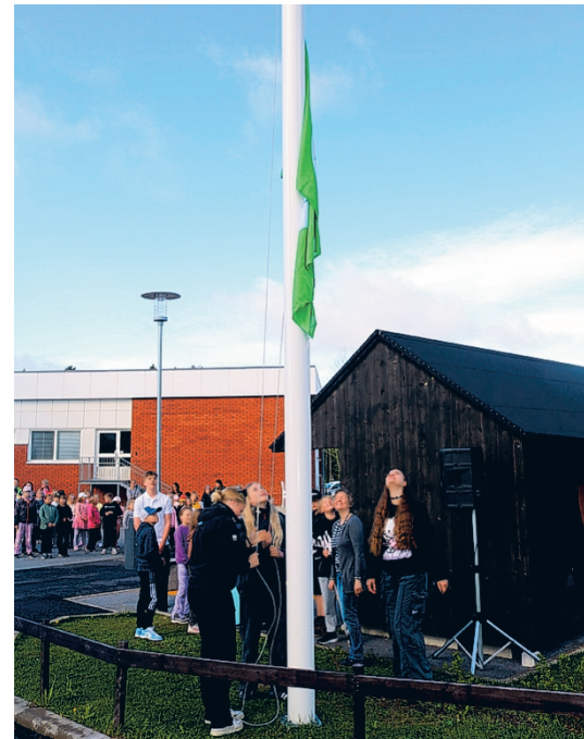
Lippu saatiin nostaa salkoon lähes tuulettomassa kevätsäässä.