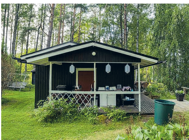
Oman tontin perustiedot voi tarkistaa Maanmittauslaitoksen Asiointipalvelusta.

Jos rajamerkki on hävinnyt tai rajan paikassa on muuten epäselvyyttä, kannattaa hakea rajankäynti Maanmittauslai-