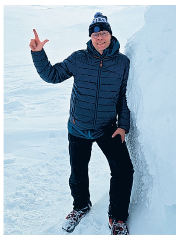
Suomen huipulla - Halti tunturin valloitus.