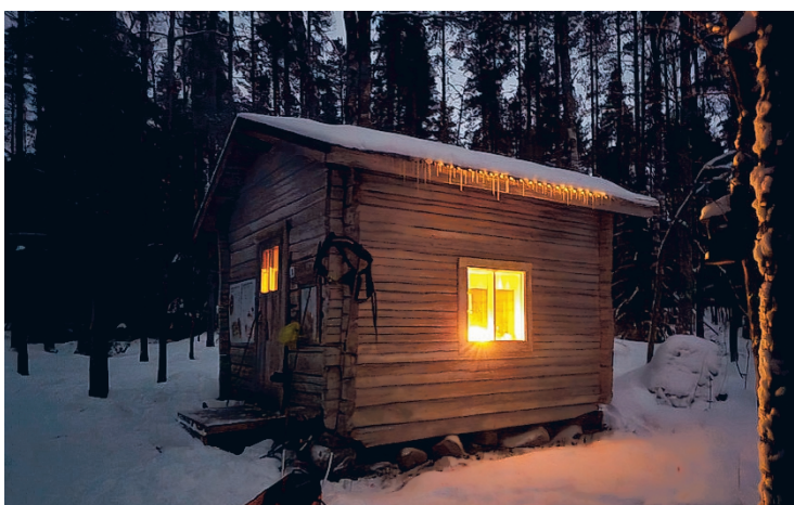
Salamajärven kansallispuisto autiotupa.