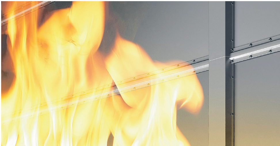
Sertifikaatti kertoo korkeasta paloturvallisuudesta.

Uusi sertifikaatti julkaistaan kesän 2025 aikana Ruukki Constructionin verkkosivuilla ja markkinointikanavissa. Tuotepakkauksiin lisätään sertifioinnista kertovat merkinnät.