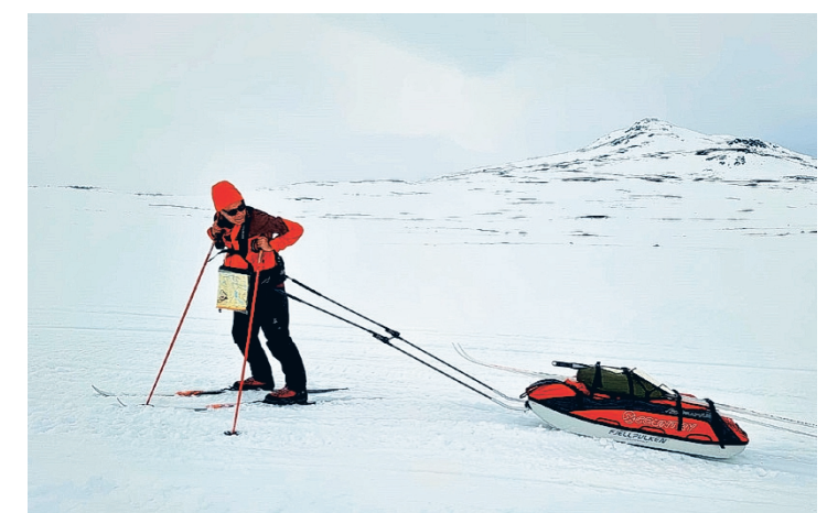
Käsvärren erämaassa tavarat kulkevat ahkiossa.