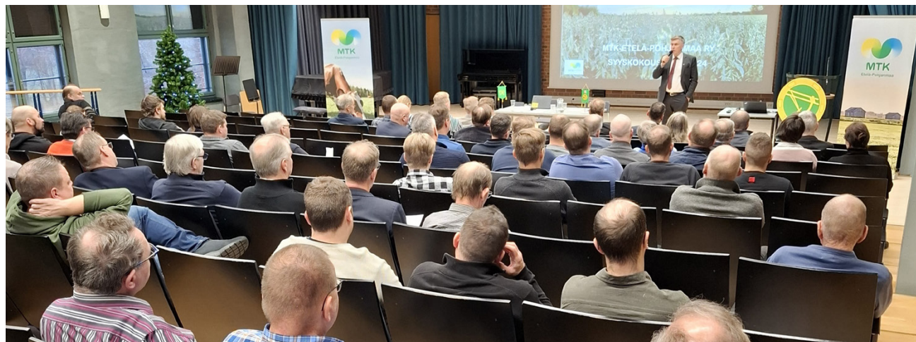
MTK-Etelä-Pohjanmaan liiton syyskokous keskusteli runsaasti muun muassa vasta julkaistuista ravinnesuosituksista.

Nasta -nimi myymälälle saatiin kilpailun perusteella. Ensin kaikki oppilaat ja henkilökunta saivat tehdä esityksiä, joista raati valitsi kolme parasta äänestykseen. Nastamyymälä sai äänistä peräti 43 prosenttia ja se sopiinkin Lehtimäen opiston myymälän nimeksi mainiosti, onhan opistolla ollut alusta alkaen myös Nasta -niminen oppilaslehti.