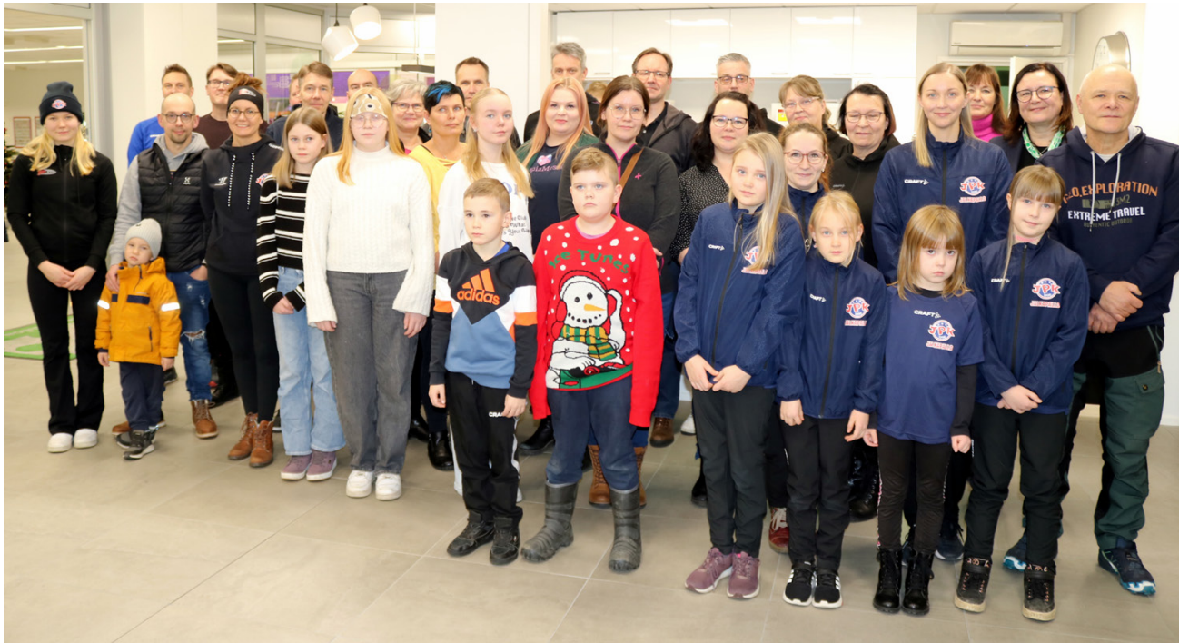
Oma Säästöpankin Alajärven konttorille kokoontui toiminta-alueen urheilujoukkueita ja valmennusryhmiä, joille myönnettiin Töysän Säästöpankkisäätiön varoista liki sadantuhannen euron potti avustuksena toiminnalle.