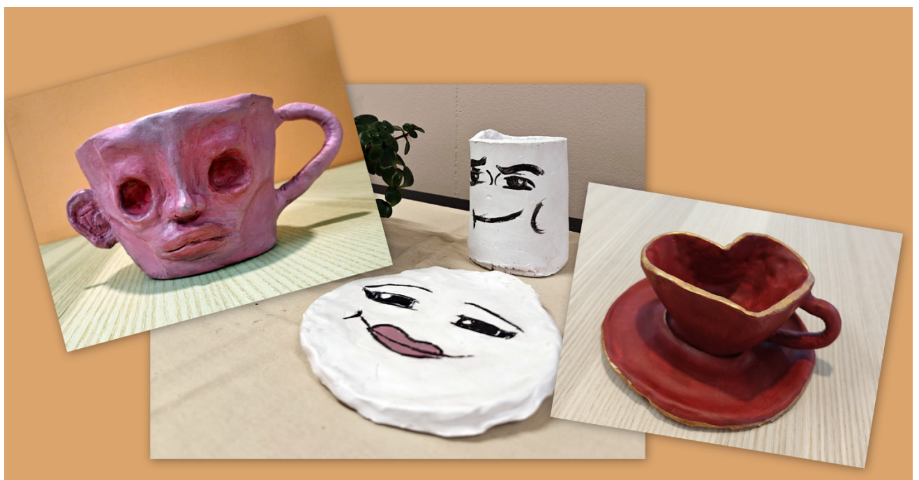
Kuvataidekoulu Eeron nuorten ryhmien jäsenten Teekutsut -taidenäyttelyssä on muun muassa oivaltavia savitöitä.

Esitykset ovat Töysän nuorisoseuralalla (Seurapolku 1, 63600 Töysä). Lisätiedot löytyvät facebook.com/Toysannuorisoseura.