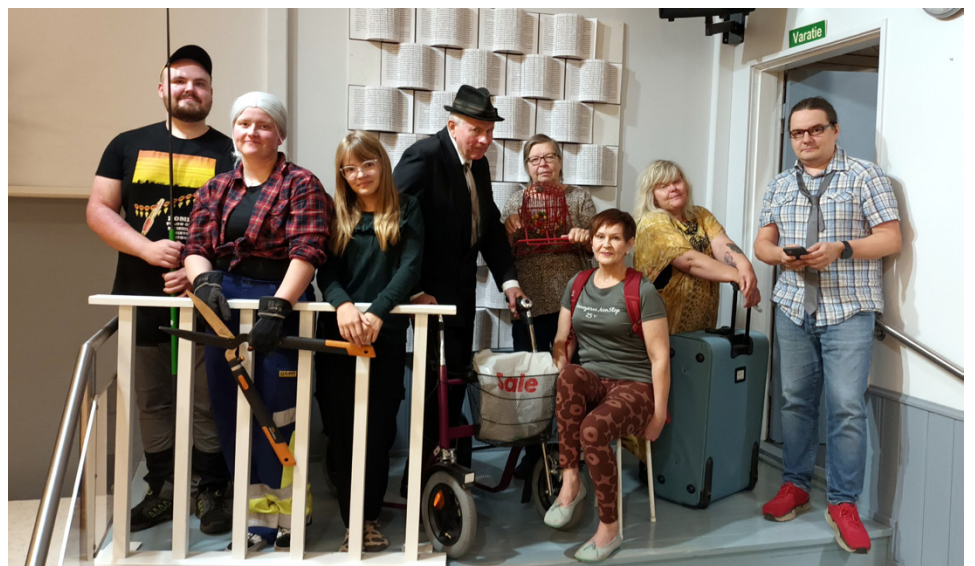
Kahdeksan harrastajanäyttelijän porukka sekä vaihtuva yli kymmenen hengen kruunuhäätanssijoiden ryhmä tuovat Töysän nuorisoseuran lavalle joulukuuksi melkoisen katsojakokemuksen. Kuva: Janne Vuorela, Töysän nuorisoseuran näytelmäryhmä.

Näytelmä on kunnianosoitus kaikille niille, jotka ovat olleet tai ovat edelleen mukana huolehtimassa siitä, että vaikka kylänraitti on kovasti