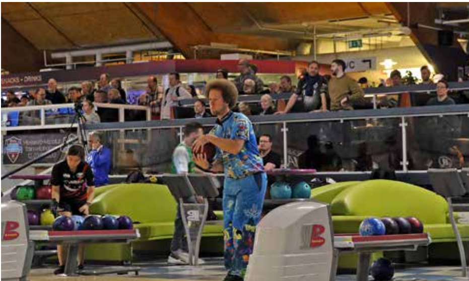
Kyle Troup lukeutuu kuumimpiin keilajiin tällä hetkellä PBA-kiertueella.