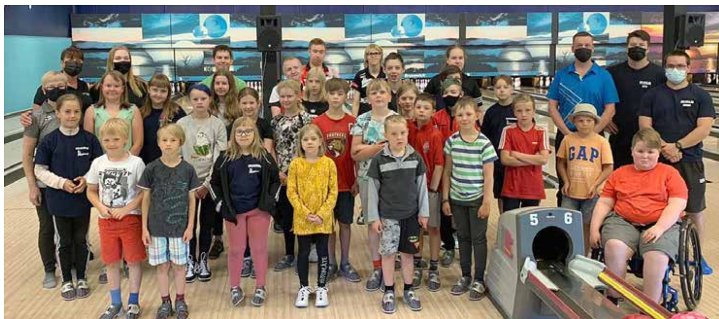
Leiriläiset ja ohjaajat yhteiskuvassa toisena leiripäivänä