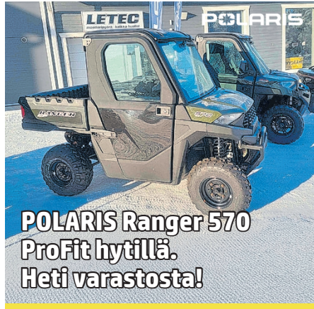
POLARIS Ranger 570 ProFit hytillä. Heti varastosta!