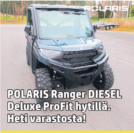
POLARIS Ranger DIESEL Deluxe ProFit hytillä. Heti varastosta!