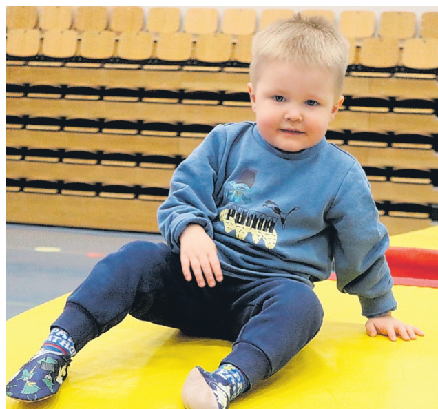
Pienimmillekin löytyi oma tempupaikka. Pehmeillä alustoilla sai kiivetä, ryömiä ja kokeilla turvallisesti omia rajojaan.

joskus aiemminkin, mutta siitä on niin pitkä aika, etteivät nykyiset osallistujat olleet sitä