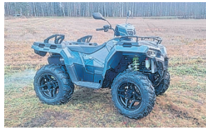
SPORTSMAN 570 EPS STEALH GREY TURF NYT! 11490€