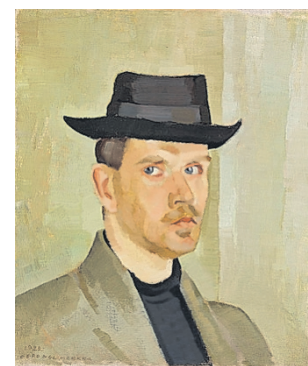
Eero Nelimarkka: Omakuva (1922). Kansallisgallerian kokoelma / Ateneumin taidemuseo.

Myöhemmin Nelimarkka asui Töölönkadulla, joka oli hänen kotinsa loppuelämän