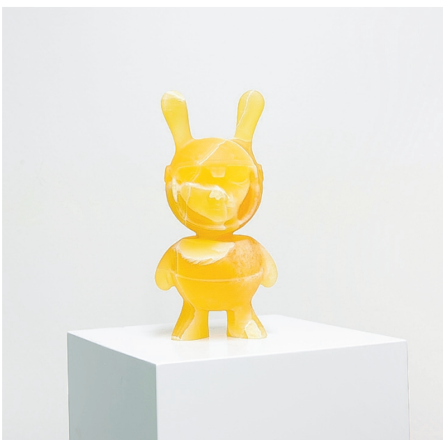
Filippo Tincolini: M. Joker, M-alien in onice Arancio, 46. Veistos on esillä IHMETYKSIÄ-näyttelyssä ja kuuluu Nelimarkka-Rahasto sr:n kokoelmaan.

Yläkerran näyttelysaleissa avautuu IHMETYKSIÄ – Pöytäkirjoja Nelimarkka-Rahaston nykytaiteen kokoelmasta (7.3.–23.8.). Näyttely on koottu Nelimarkka-Rahaston uushankintakokoelmasta, ja se tarjoaa