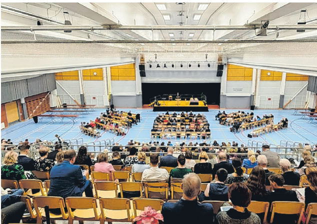
Viime vuosina alueen kierroskonventteja on pidetty Ilmajoki-hallissa.

Konventin teema perustuu Ilmestyksen 3:22:sta löytyviin