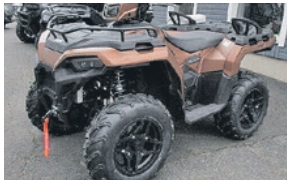
SPORTSMAN 570 EPS SE PREMIUM LE NYT! 10990€