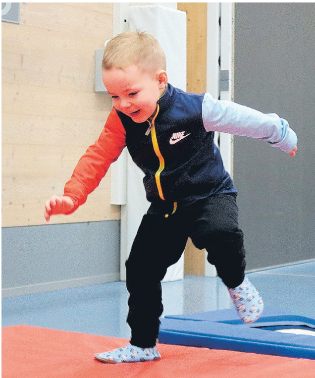
Punaposkinen vauhtipakkaus ei epäro – patjalta toiselle mentiin hymyssä suin.

Halliin oli rakennettu peräti 13 erilaista liikuntapistettä. Patjat, pehmusteet ja välineet löytyivät kaupungin omista varastoista, mutta pomppulinna ja yksi päivän vetonau-