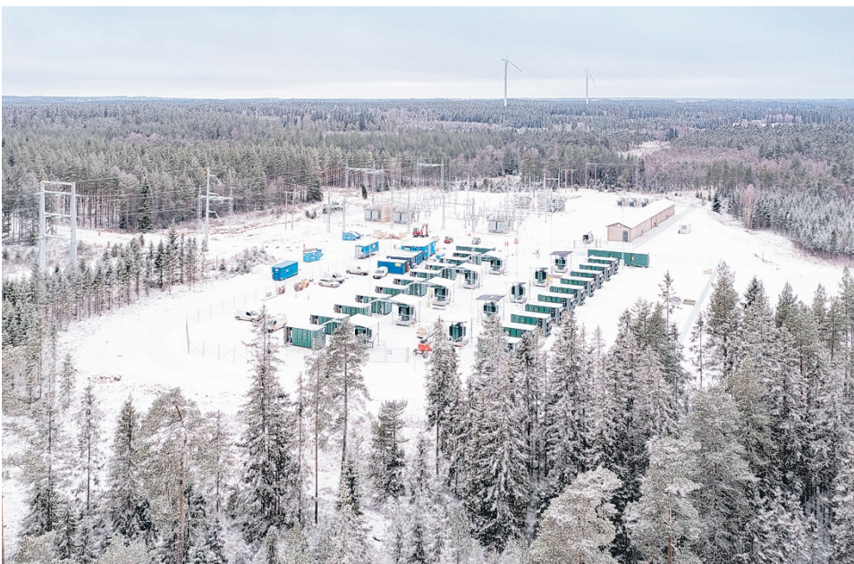
OX2:n Bredhälla-energiavarasto Ruotsissa.

Investointi energiavarastoihin on luonteva askel, kun kehitämme uusiutuvaan energiaan perustuvaa tuotantoportfoliotamme. Vakauttaessaan sähköjärjestelmää sekä sähkömarkkinoita Kanniston ja Korkeamaan sähkövarastot