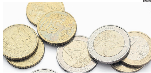
Perustoimeentulotukea maksettiin Alajärvellä kaikkiaan 776 304 euroa, Soinissa 143 889. Kyyjärvellä 62 972, Vimpelissä 155 780 ja Lappajärvellä 117 775 euroa.

oli kaikkiaan 33, joista yksin asuvia 24 ja muita yhden hengen kotitalouksia neljä.