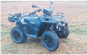
SPORTSMAN 570 EPS BLACK EDITION NYT! 12490€