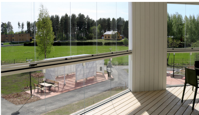
Villa Koivulan lasitetulla terassilla ja toisen kerroksen parvekkeella on mukava istua katselemaan maisemaa huonommallakin säällä.

toon ulottuvat ikkunat, jotka saa myös auki. Turvallisuuden vuoksi niiden takana on kauniit, sisustukseen sopivat kaiteet. Huoneet ovatkin hyvin valoisia.