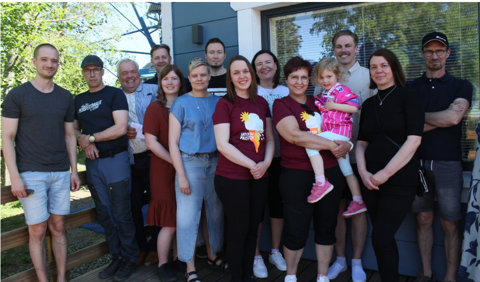
Vimpelissä pesäpallo yhdistää yrityksiä ja nuoria harrastajia. Juniorisponsoreiden tuen turvin pesisharrastuksen toimintamaksut eivät karkaa korkeiksi.

– Aika monet yritykset lähtivät hyvin mukaan tukemaan junioreita. Juniorisponsoriksi ryhtyi sellaisiakin yri-