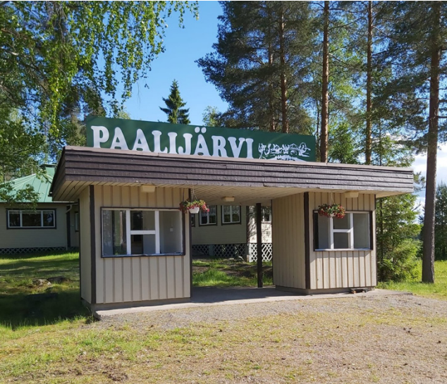
Paalijärven lavalla toimii jälleen kesä- ja heinäkuun ajan Paalijärven kyläyhdistyksen kesäkahvila ja paljon muutakin toimintaa on luvassa!

Suurperheeltämme jää myös aika tavalla ruokajätettä, mutta sen sijaan koulun ylimääräistä ruokaa ei saa lahjoittaa eteen-päin.