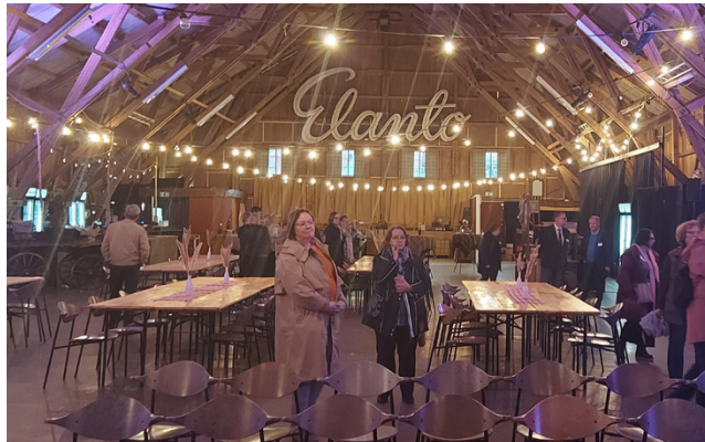
Valtakunnallisia kotiseutupäiviä vietetään tänä vuonna 30.8.-1.9. Vantaalla. Siellä kotiseutukahvit juodaan kotiseutugaalassa Backaksen juhlatila Puimalassa.

Kahvit Kotiseutumuseolla juodaan kello 12 alkaen ja yläkerran käärijäsalissa alkaa kotiseutukeskustelu kello 13. Kes-