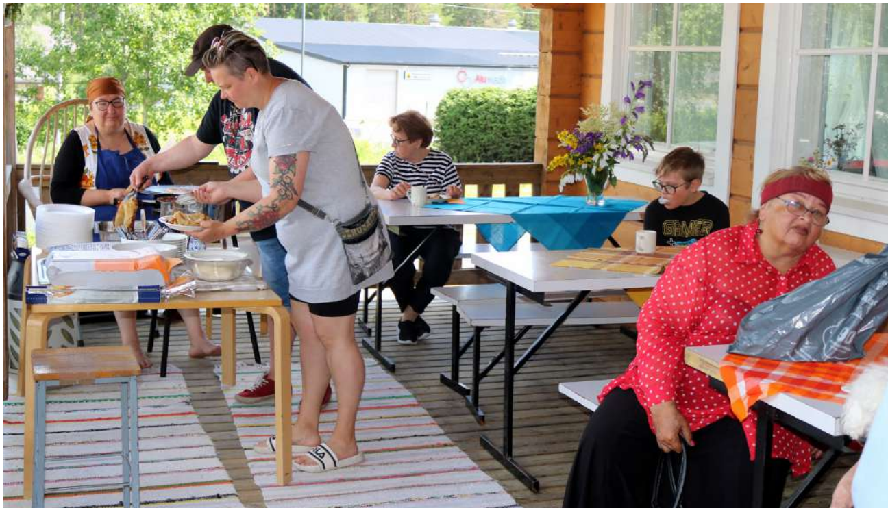
Nuorisoseuran järjestämä Perinnepäivä tänään oli todella tunnelmallinen! Perinteisiä herkkuja oli tarjolla niin sisällä kuin ulkosallakin mukavassa kesäsäässä.