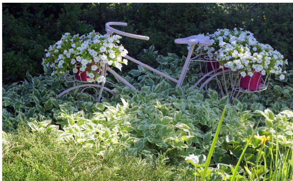
Aina ei tarvita paljon väriä, kun on hyvä idea.

simpaan osaan onkin syntynyt niin oleskelukasvihuonetta