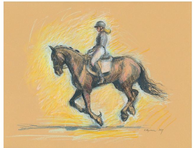
Hepan juoksu on kuvataiteilija Oksana Shulgan yksityisnäyttely Soinin kirjastossa.

Menkijärventie 36, Alajärvi • 040 573 2728 MA–PE 10–17, LA 10–13, SU SULJ.