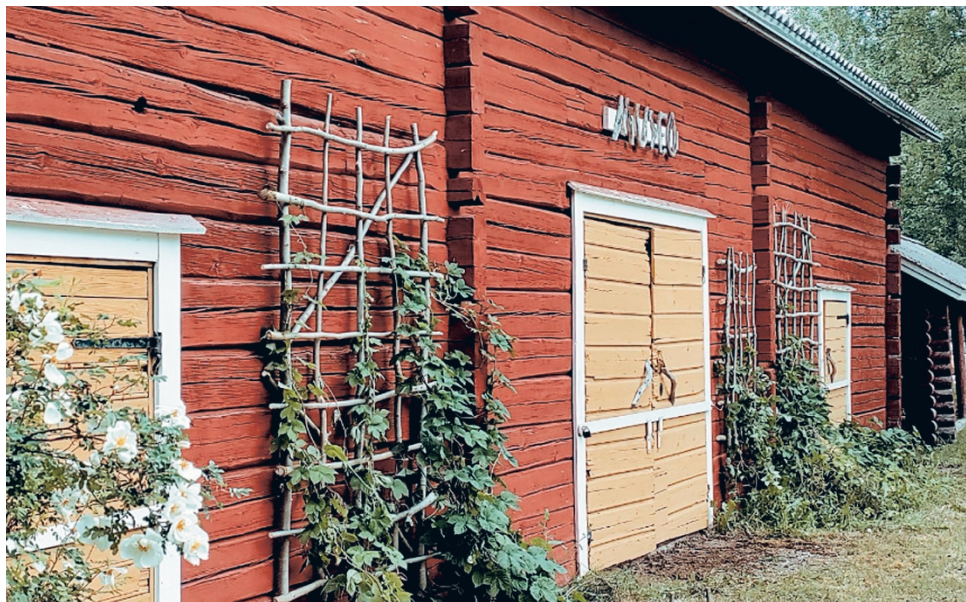
Kyyjärven kotiseutumuseon toiminnasta vastaava Kaunis Kyyjärvi ry. järjestää sunnuntaina 21.7. luontokirkon. Kyyjärven markkinalauantaina 27.7. teemana on eväät.

Kotiseutumuseon vetovastuun Kaunis Kyyjärvi sai perintönä jo lakkautetulta Kyyjärvi-Seuralta. Museo oli pitkään suljettuna ja ovet aukaisiin viime vuonna. Museo on