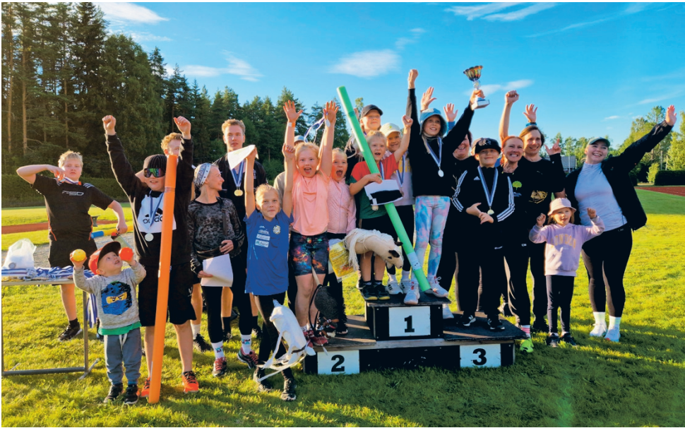
Voittajajoukkueen on helppo hymyillä. Hernesmaa voitti yleisurheilun Ränkikisat toista kertaa.

Aikuisten sarjoissa kilvoitteli lajin mukaan 8–10 osallistujaa. Hernesmaan Onni Kart-