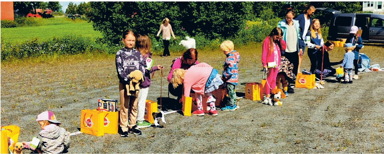
Lapsi ja lelu-koira -kisassa nähtiin taas runsaasti osallistujia, jotka saivat mukavat palkinnot!