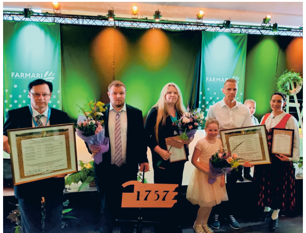
Muiden muassa Perttulan tila Soinista ja Uudentuvan tila Lappajärveltä olivat ProAgria Keskusten Liiton myöntämien Sukutilakunniakirjojen saajien joukossa, kun tunnustukset jaettiin Seinäjoella pidetyssä Farmari maatalousnäytellyssä.

Kirkon diakoniarahasto on evankelis-luterilaisen kirkon valtakunnallinen rahasto, josta diakoniatyöntekijät voivat hakea avustusta alueellaan asuville hädässä oleville ihmisille. Suomessa asuvia taloudellisessa ahdingossa olevia voi auttaa valtakunnallisen Kirkon diakoniarahaston kautta lahjoittamalla. Lahjoitetut varat käytetään lyhentämättömänä avustustoimintaan.