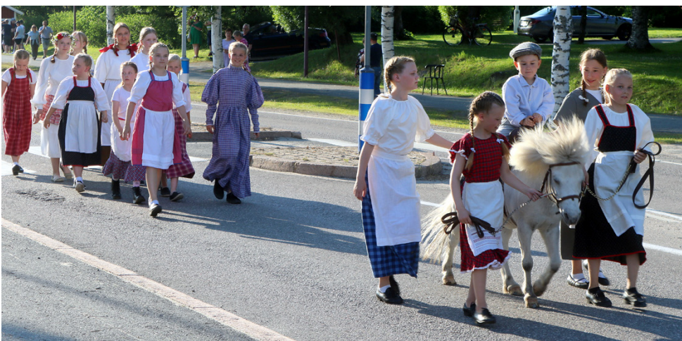
Hääväkeä seurasivat tietenkäin myös kylän lapset.

lyä pääsi seuraamaan Yhteistalon pihapiirissä, jossa nähtiin myös tanssiesityksiä taitavien soittajien säestämänä. Toisessa tanssiesityksessä ohjelmassa oli myös päänpeittäjäiset, joissa morsiamesta tehtiin akka.