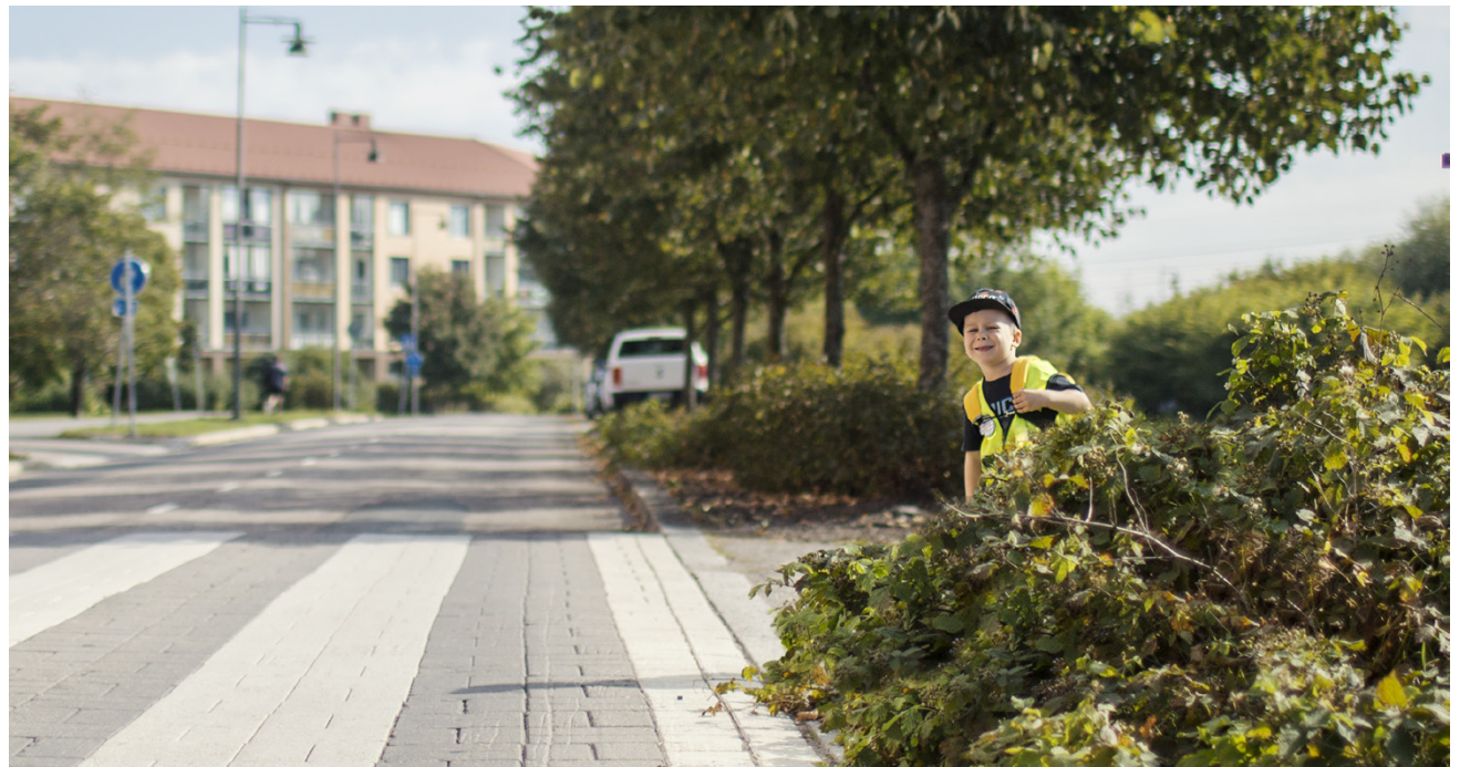
Lapsi ottaa aikuisesta mallia sekä hyvässä että pahassa. Kannattaa siis näyttää hyvää esimerkkiä liikenteessä.

Sinilevä nousee seisautuneessa vedessä noin tunnin kuluessa veden pinnalle. Myös kepillä voi testata, onko kyseessä sinilevä. Jos levä jää roikkumaan keppiin, kyseessä on jokin muu levä. Jos epäilee vedessä olevan sinilevää, on aina hyvä noudattaa erityistä varovaisuutta, eikä vettä tule käyttää sauna-, kastelu ja pesuvedenä.