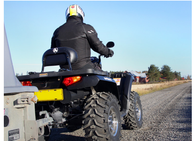
Mönkijän tyypistä riippuu se, millä ajokortilla sitä saa ajaa.