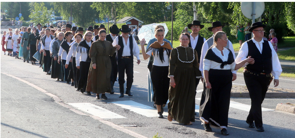
Hääväki käveli Soinin keskustan läpi Yhteistalolle noin kahden kilometrin matkan.