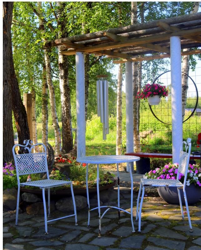
Secret-Gardenin pystytolpat ovat jo valmiina, ja aika näyttää miten pian tällä paikalla on ihan oikea salainen, suljettu puutarhan osa.