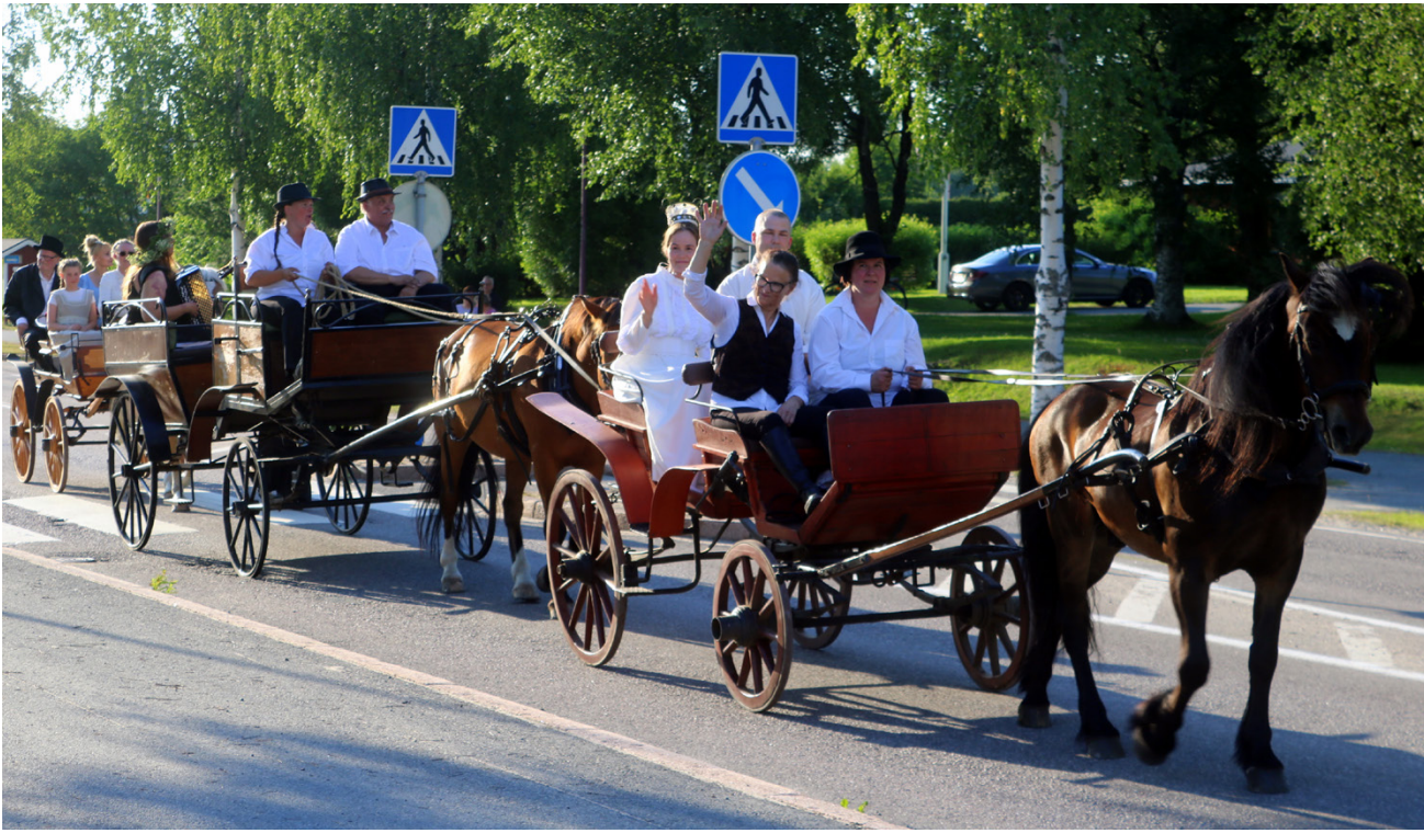
Kruunuhääkkueen ensimmäisessä vaunussa saapui juhlavasti pukeutunut morsian päässään hääkruunu, josta koko juhla on saanut nimensä.