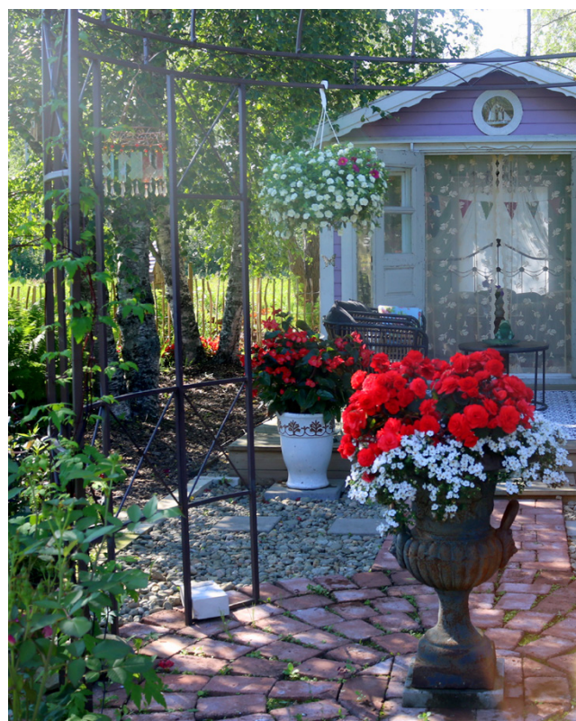
Puutarhasta löytyy myös lukuisia erilaisia rakennelmia ja ruukkuja, joissa on usein hyödynnetty kierrätysmateriaaleja.

tyy myös lukuisia erilaisia rakennelmia ja ruukkuja, joissa on hyödynnetty kierrätysmateriaaleja. Suihkulähteinä toimivat esimerkiksi vanhojen öljysäiliöiden päädyt.