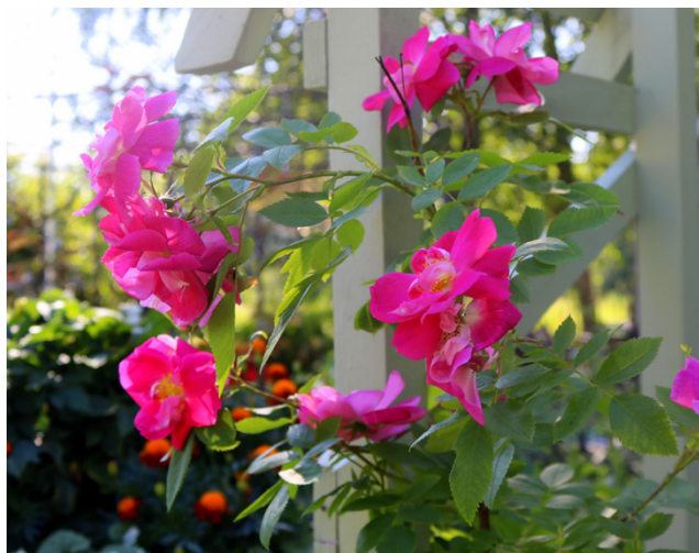
Köynnösruusut hehkuvat upean punaisina.

Ruohonleikkurille puutarhassa ei sen sijaan ole juurikaan tarvetta, sillä kaikki missä ei kasva puita tai kukkia, on so-