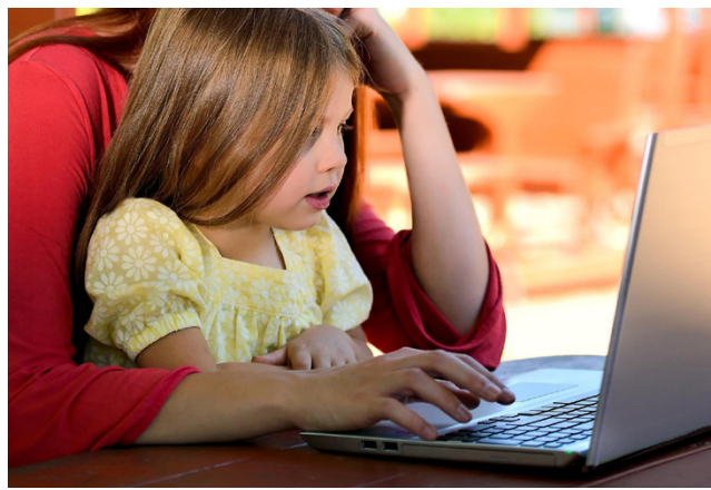
Vanhempi voi saada 1. ja 2. luokalla olevan lapsen hoitoon osittaista hoitorahaa, jos hän tekee töitä 1-30 tuntia viikossa.

Vanhempi voi sopia työntantajansa kanssa myös jäämisestä osittaiselle hoitovapaalle, mutta osittaista hoitorahaa voi saada, vaikka ei olisi hoitovapaalla. Vapaasta täytyy sopia