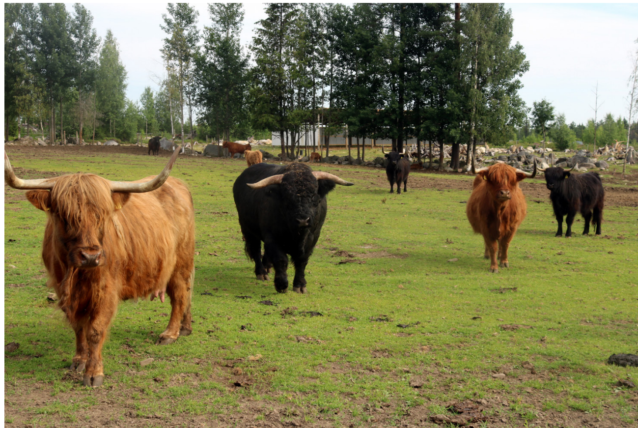
Ylämaankarjaa eivät tilan lähistöllä liikkuvat karhut ja sudet pahemmin häiritse. Pikkuvasikat kuitenkin pidetään susien takia tilakeskuksen lähellä.

taitoja vaativissa tehtävissä. Pisisimpään hän on ajanut metsäkonetta ja ollut aina ihminen, joka ei viihdy joutilaana, vaan aina pitää olla jotain tekemistä.