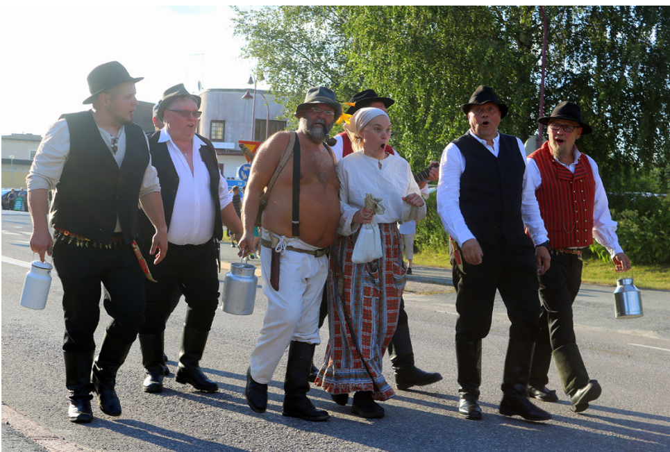
Seurueen perässä saapuivat myös häjyt!