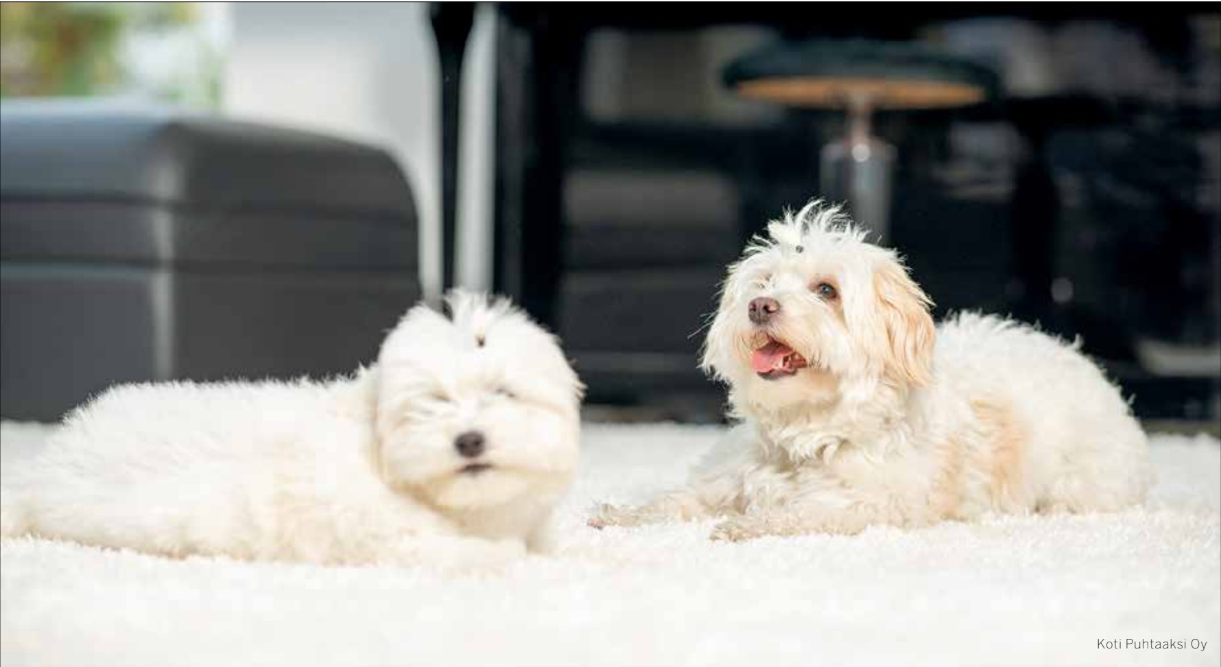
Koti Puhtaaksi Oy

Lattialle osuneet oksennukset kannattaa pyyhkiä puhtaaksi yleis- puhdistusaineella ja talouspape- rilla. Jos oksennus on matolla, voi mattoon takertunutta oksennus- ta rapsuttaa pois esimerkiksi haa- rukalla. Useimmiten oksennuk- sen kannattaa antaa kuivahtaa ja harjata ja imuroida se pois vasta kuivana. Oksennuksen haju irtoaa matosta parhaiten ruokasoodalla. Ripottele soodaa matolle, anna vai- kuttaa 30 minuuttia ja imuroi pois. Hajunpoistoon voi käyttää myös esimerkiksi kahvia tai etikkaa.