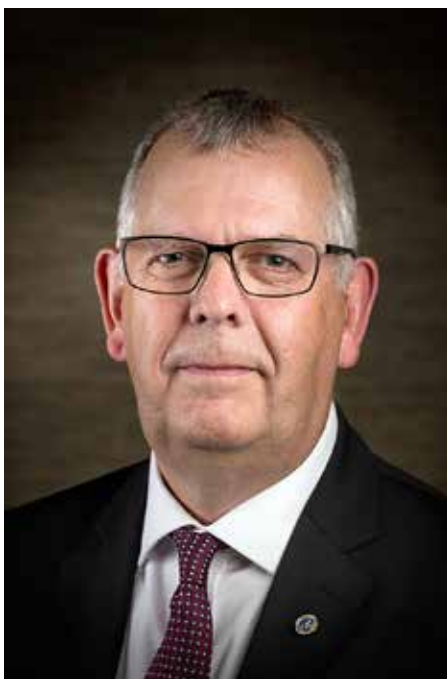
EBF:n varapuheenjohtaja, islantilainen Valgeir Gudbjartsson on vahva tekijä eurooppalaisessa keilailussa ja tuttu kasvo suomalaisillekin arvokilpailuista.

”Myös eurooppalaista keilailua ajatellen, tarvitsemme rauhan kansainväliseen toimintaan, jotta se ei vaikuta meihin niin paljon kuin se vaikutti viime vuonna.”