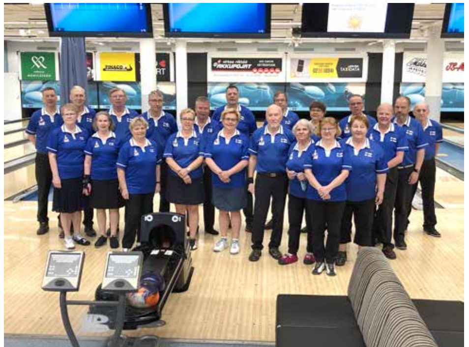
Tämmöisillä porukoilla pelataan ja matkataan. Kupittaalla pelatun 1. mestaruuskisälähdön ryhmis.

Toimintakausi on päässyt alkuun lokakuun lopussa pidetyn vuosikokouksen jälkeen.