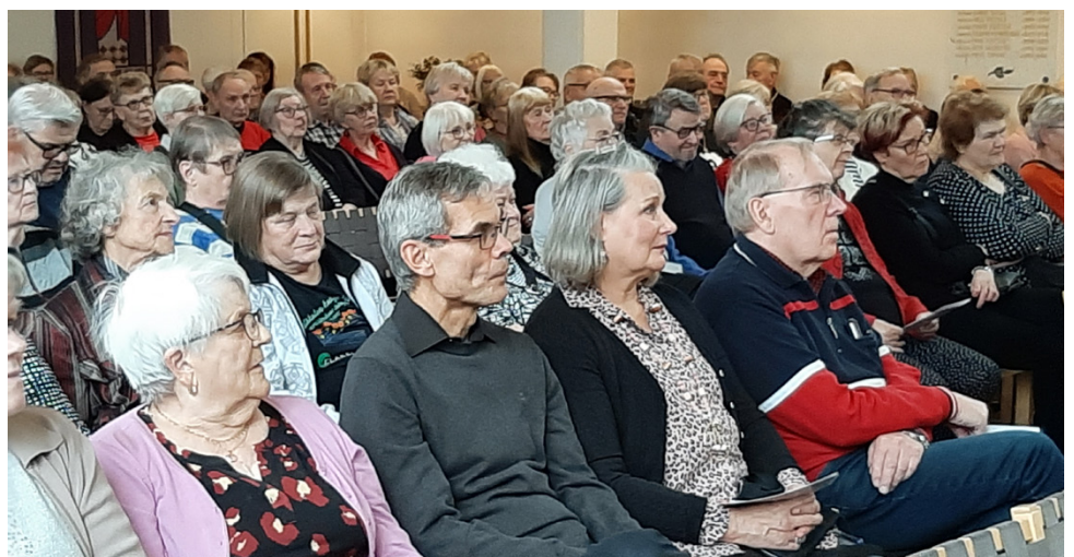
Alajärven seurakuntatalo täyttyi ääriään myöten Eläkeliiton kuukausitapaamiseen.