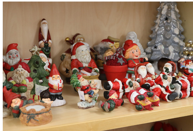
Myös uudistuneen kirppiksen hyllyiltä löytää monenlaista kivaa jouluun.

Tuttuun tapaan toiminta- keskuk- sen väki on valmistellut jouluja jo pitkään. Omina tuot- teina asiakkaille onkin tarjolla