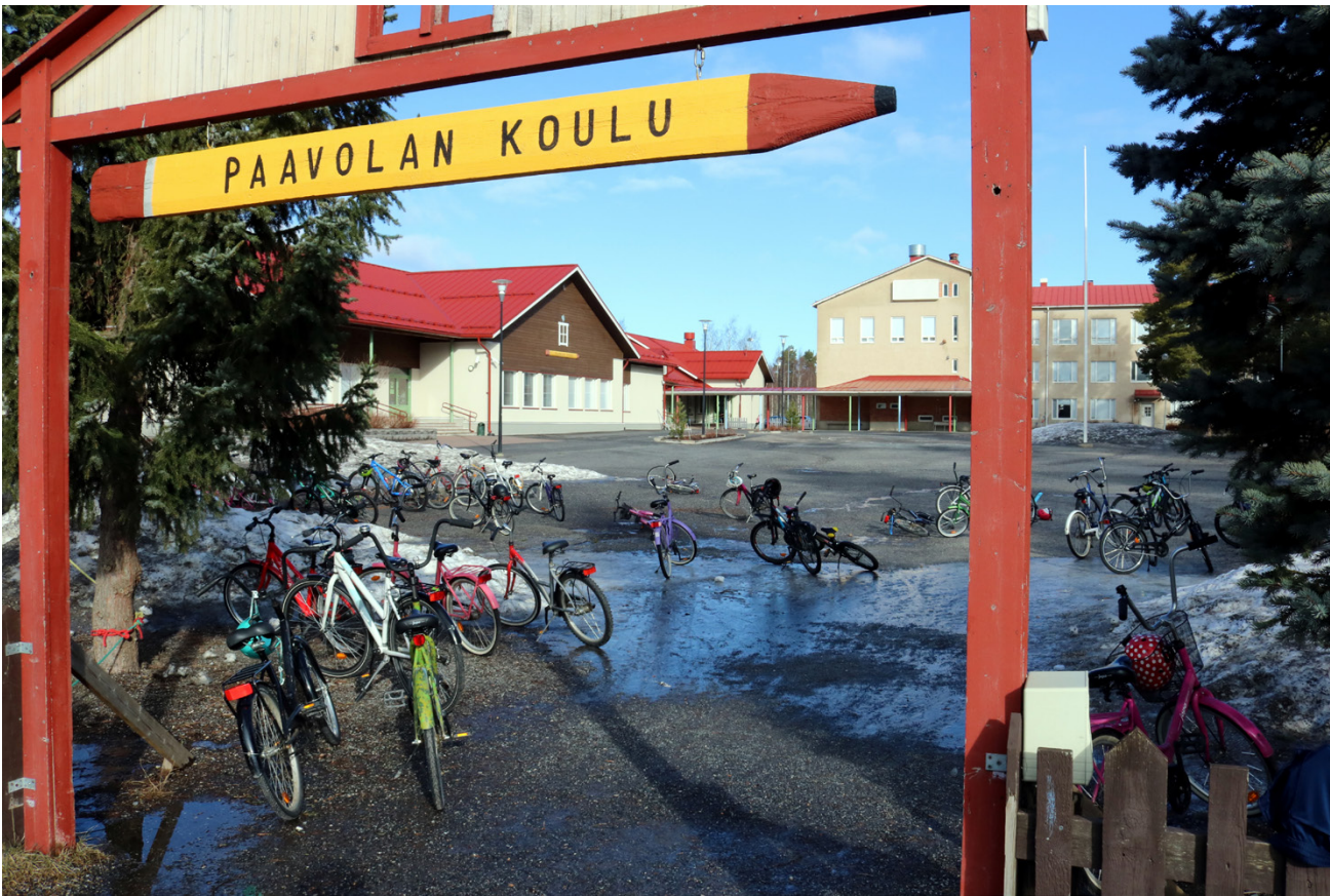
Paavolan uuden koulun rakentamiseen on varattu vuoden 2026 talousarviossa seitsemän miljoonaa euroa. Arkistokuva.

Teknisten palveluiden nettoinvestoinnit ovat 13,4 miljoonaa ja vesihuoltopalveluiden 250 000 euroa. Suurimpia investointihankkeita ovat Paavolan koulun rakentaminen seitsemällä miljoonalla, Mäntymäen päiväkodin laajennus miljoonalla eurolla ja v-