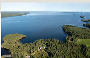
Neulaniementie 51 Alajärvi Okt | 4mh + oh + k + kh + s + aula + parvi

Myydään tilava ja paljon remontoitu koti Lappajärvellä! Noin 250 m 2 yhdessä tasossa, lisäksi parvi ja kellaritilat. Rauhallinen sijainti ja kaunis järvimaisema. Uusittu mm. katto, ulkoverhoitus, märkätilat, keittiö ja aurinkovoimala. Tähän mahtuu isompikin perhe! Etuovi.com 20538489 Hp. 115 000 €