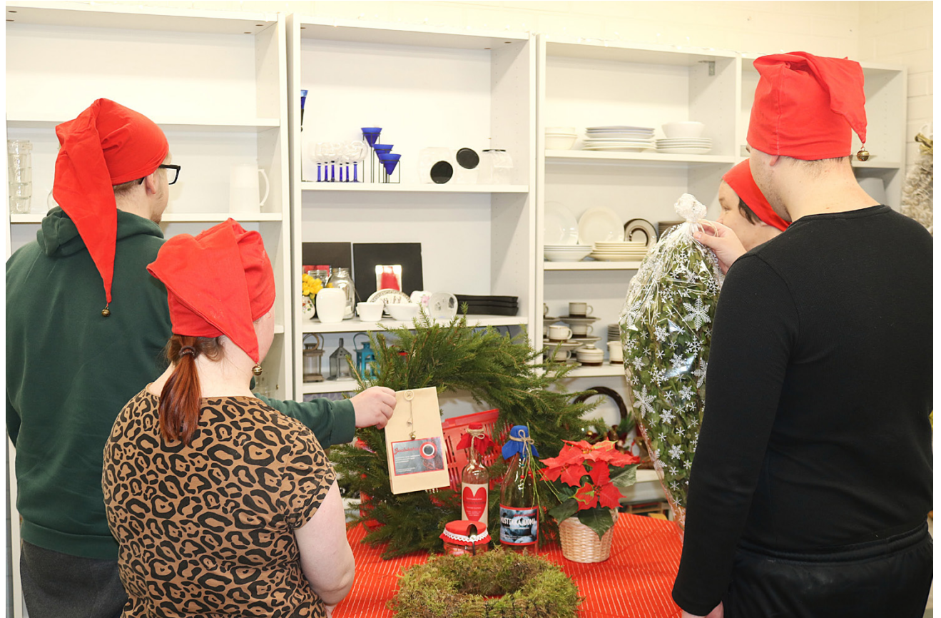
Alajärven toimintakeskuksen väki asetteli joulutuotteita esille jo viime viikolla ja myymälä avautuu jouluun tänään keskiviikkona.