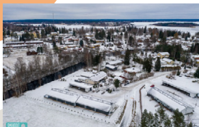
Särkipadontie 11 as 4 Alajärvi Rivitalo | 3h + k + ph 67 m 2

Alajärven keskustassa Välikadulla myynnissä ylimmän kerroksen valoisa saunallinen kaksio. Asunnossa on yksi makuuhuone, olohuone, avokeittiö sekä kylpyhuone ja oma sauna. Koko asunnon levyinen parveke etelän puolella. Erinomainen sijoituskohde! Etuovi.com 21572632 Vh. 49 500 €