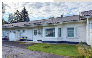
Leppäkuja 1 Alajärvi Rivitalo | 3h + k + ph + s 71 m 2

Toukolan asuinalueella, aivan palveluiden läheisyydessä, sijaitsee tämä kattaaltaan remontoitu omakotitalo. Talo tarjoaa erinomaiset puitteet viihtyisään perhe-asumiseen - muuttovalmis koti, johon voi asettaa taloksi samantien. Etuovi.com 20053082 Hp. 119 000 €