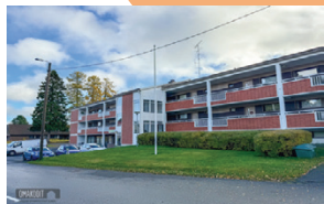
Välikatu 5 B 9 Alajärvi Rivitalo | 2h + k + ph + s 57 m 2

Alajärven keskustassa Välikadulla myynnissä ylimmän kerroksen valoisa saunallinen kaksio. Asunnossa on yksi makuuhuone, olohuone, avokeittiö sekä kylpyhuone ja oma sauna. Koko asunnon levyinen parveke etelän puolella. Erinomainen sijoituskohde! Etuovi.com 21572632 Vh. 49 500 €