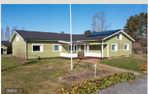
Kevarantie 3 Lappajärvi Okt | 7mh + tupak + khh + kh + s + työh + var.

Myydään saunallinen kolmio loistopaikalla Alajärven keskustan tuntumassa! Tilava ja siistikuntoinen heti vapaa asunto, 2 mh, rempattu keittiö. Sijainti erinomainen: koulu, kaupat, uimahalli ja jäähalli melkein vieressä. Lisäksi autokatospaikka ja iso ulkovarasto. Etuovi.com 20909004 Vh. 69 500 €