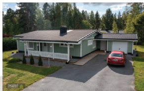
Simeonintie 19, Alajärvi Omakotitalo | 4h + k + khh + kh + s 112,9 m 2

Uudehko rivitalokolmio hyvällä paikalla. Asunnossa on kaksi makuuhuonetta, väljä tupakeittiö sekä kodinhoitotila/kylpyhuone ja oma sauna. Laadukkaat materiaalit ja hyvä työnjälki tekevät asunnosta viihtyisän kodin. Myydään valmiiksi vuokrattuna 6/2026 asti. Etuovi.com 21735643 Vh. 159 900 €