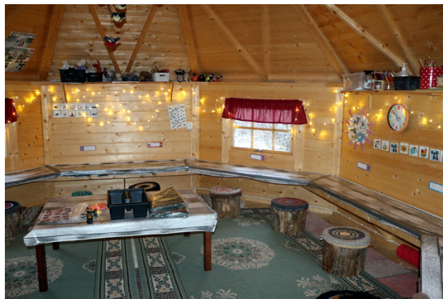
Kodassa on lapsille oma rauhallinen tila, jossa luonnonläheinen sisustus ja tunnelmavalistus kutsuvat viihtymään.

Sadekelit ovat lasten mielestä ihan parhaita, siksi ryh-