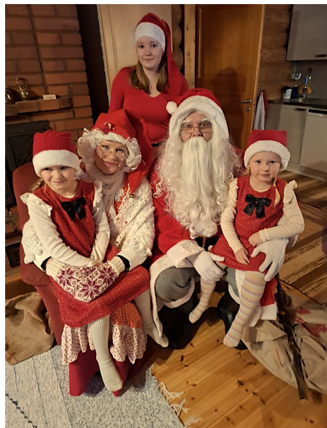
Joulupukki muoreineen on tulossa Lehtimäen joulunavaukseen perjantaina! Tämä kuva on otettu heidän jouluaaton kierrokseltaan viime vuonna Lehtimäellä.

Kahviossa myydään jouluisia leivonnaisia ja juomia, ja lisäksi järjestetään arpajaiset. Suomen Punainen Risti