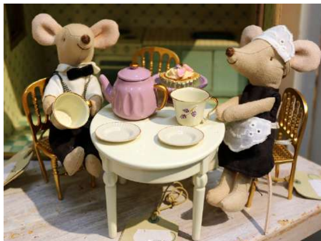
Tanskalaiset Maileg nukkekodin tuotteet sopivat niin leikkiin kuin keräilyesineiksi.