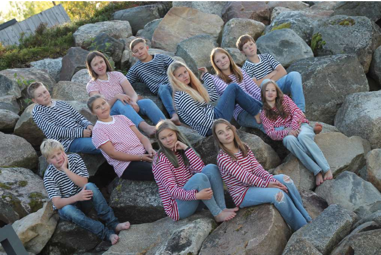
Taimelan koulun tämänvuotiset luokkakuvat eivät ole perinteisiä. Oppilaat ovat saaneet pohtia, missä tulevat kuvatuksi. Luokkakuva raitapaidoissa ja paljain varpain herättää takuuvarmasti muistoja vielä vuosienkin päästä.