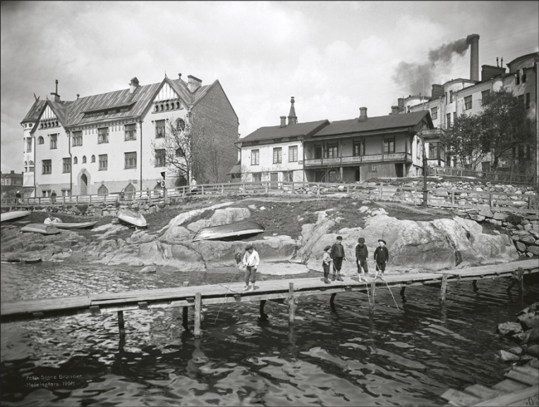
Gustaf Estlanderin ensimmäisen kerrostalon, Berggrundin (1903) ympäristö Eläintarhanlahden pohjoisrannalla oli 1900-luvun alussa rauhallinen, vaikka Hakaniemeen korttelin toiselle puolelle rakennettiin suuria asuin- ja liiketaloja. Kuvan oikeassa laidassa puun takana näkyy myös Estlanderin Säästöpankinranta 4 (1907), joka on vielä olemassa.

”Estlander oli Helsingin kaupunkikuvan kannalta yksi ehdottomasti merkittävimmistä jugendarkkitehdeistä, joka toi jugendin ihanteita ja innovaatioita laajemman kansanryhmän saavutettavaksi. Hänen suunnittelemissaan taloissa on kautta historian asunut todennäköisesti kymmeniä tuhansia ihmisiä.”