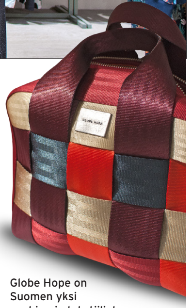
Globe Hope on Suomen yksi vanhimpia tekstiilialan yrityksiä, joka tuottaa laukkuja ja asusteita kierrätys- sekä ylijäämämateriaaleista. Kuvan laukku on valmistettu värjäytyistä turvaväristä.

”Luonnonmateriaalit, kekseli- äät leikkaukset ja persoonalliset, tyylikkää printit ja kuosit kiin- nostavat. Toinen hittituoteemme on laadukkaat housut. Lähes kaikille sovittaneille housut ovat lähteneet mukaan. Ja nuoret ovat