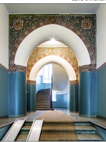
Laivasillankatu 10:n Tehtaankadun puoleinen pääporras on Gustaf Estlanderin uljaimpia.

” OMASSA tutkimuksessani tein sen havainnon, että jugend ei välttämättä tarkoittanut suuria neliömääriä. Monissa Estlanderin suunnittelemissa taloissa oli jopa 1-3 huoneen laadukkaita asuntoja. Oli toki myös usean sadan neliön asuntoja, mutta eniten kaksioita tai kolmioita, jotka hän piirsi vapaan pohjasuunnittelun periaatteiden mukaisesti.”