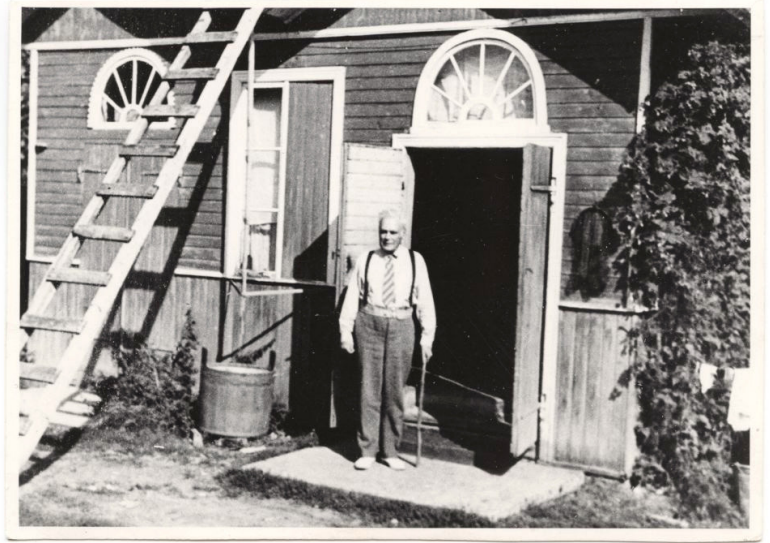
Volter Kilpi Alastalon ovella.

selle keskittymiskykyä ja kärsivällisyyttä vaativa Kilven teksti ja kieli on myös mitä oivallisinta itsekasvatusta. Kilpikin totesi kirjan ilmestymisen jälkeen, että hän kirjoittaa tulevaisuuden lukijoille, ja kyse on eepoksesta, ei niinkään perinteisestä romaanista.