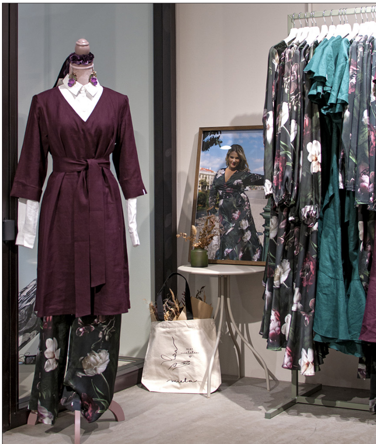
Ovensuussa on esillä Nakoa-merkin tuotteita. Nakoa valmistaa luonnonmateriaaleista vaatteita juhlaan ja arkeen.