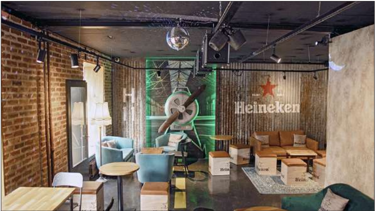
Sisutuksessa on yhdistetty erilaisia materiaaleja, kuten tiiltä, betonia, puuta ja nahkaa.