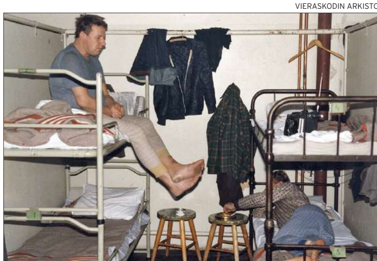
1990-luvun alussa alkanut yleismaallinen talouslama ja siitä johtunut työttömyys synnyttivät Helsingin Vieraskodille lisää asukkaita. Tällöin myös asukkaiden keski-ikä alkoi laskea. Kuvassa miesten makuusali 1980-luvulla Pursimiehenkadulla.