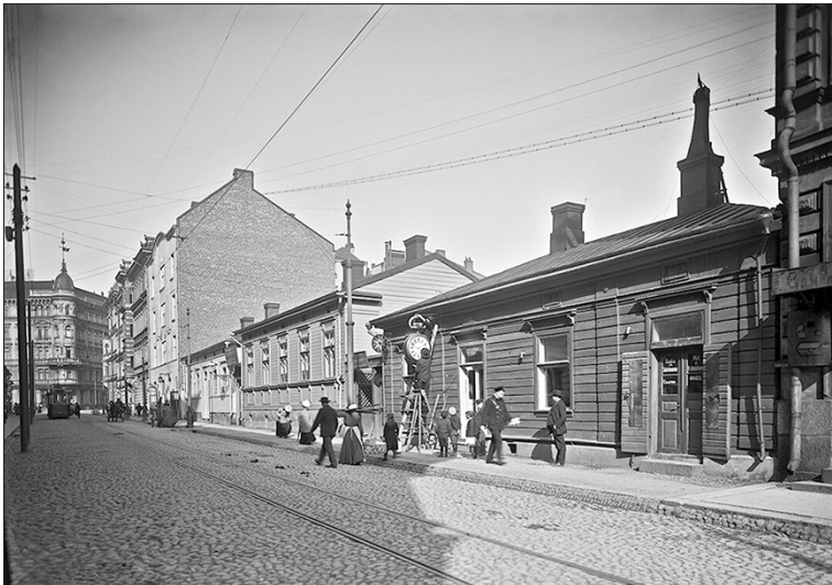
Vuonna 1883 osoitteesta Roobertinkatu 6 vuokrattiin tilat, joita kutsuttiin Ensimmäiseksi kodiksi. Tilat koostuivat viidestä huoneesta, joista kolmessa oli sänkypaikkoja 22 henkilölle. Lisäksi tiloissa oli ruokasali, työhuone sekä pieni kirjasto.