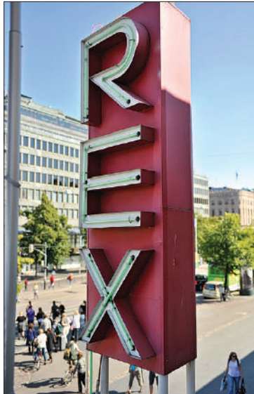
Bio Rexissä aloittaa myös elokuvien ystävät yhteen kokoava Pieni elokuvakerho.