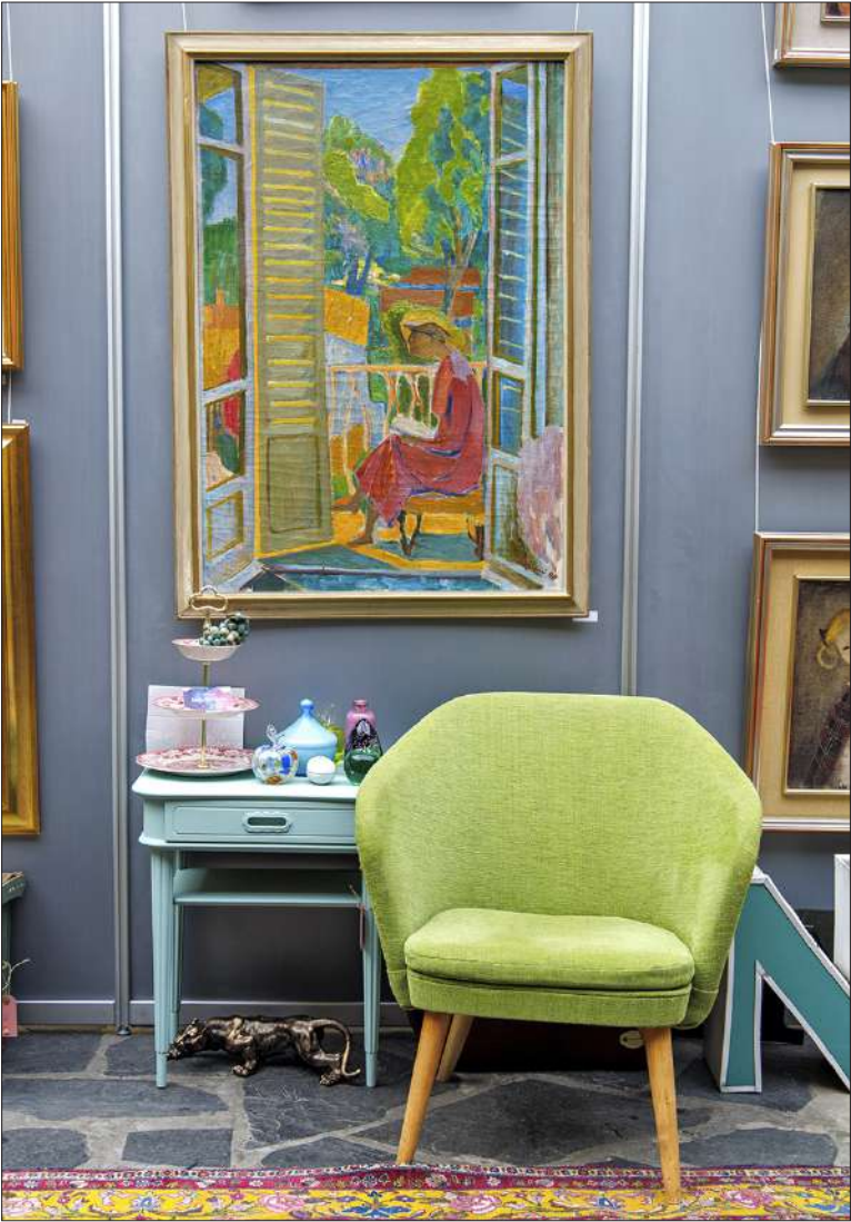
Sisustajat ja antiikin ystävät voivat tehdä messuilta löytöjä.