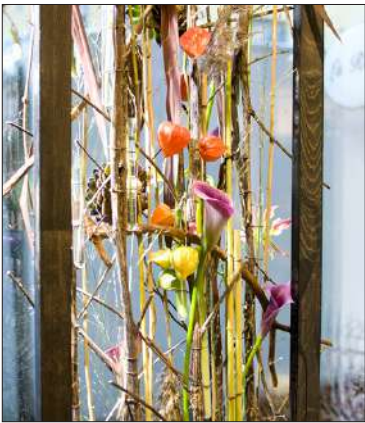
Ikkunassa oleva paralleelinen, eli yhdensuuntainen työ siirtyy jatkossa liikehuoneiston tuulikaappiin. Koetyössä on lähisävyharmoniaa, mutta myös vastavärejä.