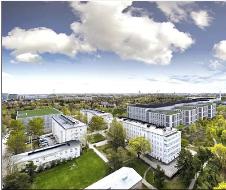
Havainnekuvassa Laakson sairaala-alue rakentamisen valmistumisen jälkeen vuonna 2030.

Sairaala-alueella on tehty valmistelevia töitä vuodesta 2022. Maanalaisten tilojen ja päärakennuksen maanrakennustyöt aloitettiin viime keväänä. Päärakennuksen rungon teko alkaa suunnitelman mukaan vuoden 2024 alussa. Kokonaisuus