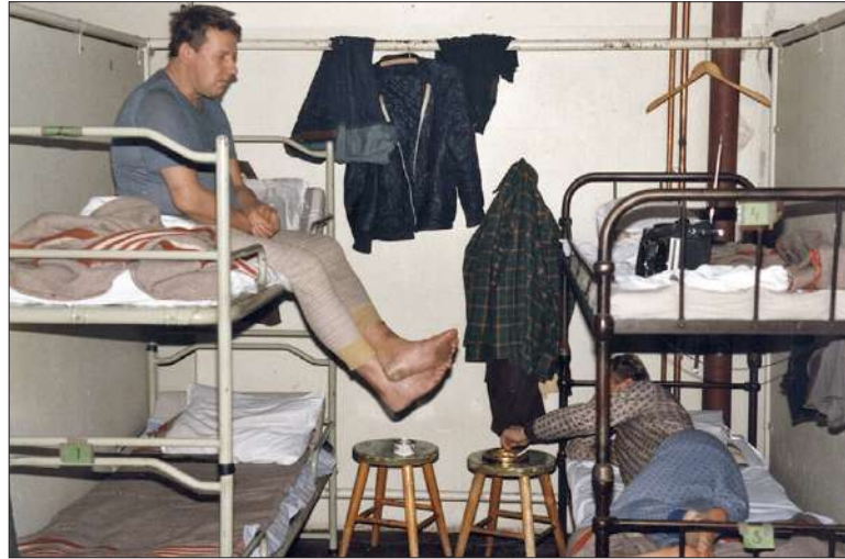
1990-luvun alussa alkanut yleismaallinen talouslama ja siitä johtunut työttömyys synnyttivät Helsingin Vieraskodille lisää asukkaita. Tällöin myös asukkaiden keski-ikä alkoi laskea. Kuvassa miesten makuusali 1980-luvulla Pursimiehenkadulla.