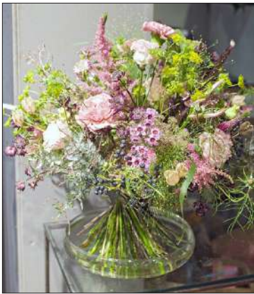
Puutarhamainen kimppu syntyi spiraalitekniikalla. Mäkelä kertoo sen olleen vaikeasti toteutettava, kimppuhan ei tarvitse maljaa laisinkaan tuekseen. Kimppu on kaupassa myytävänä.