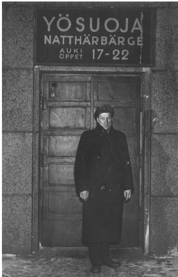
Yövalvoja Yrjönkadulla 1980-luvulla.

Asumisen ohella tulivat tärkeiksi monet yhteisölliset toiminnot, kuten huoltohenkilöstön avustaminen erilaisissa käytännön toiminnoissa. Päihteiden käyttöä ei enää ole kielletty, mutta häiriökäyttäytyminen talon tiloissa on kielletty. Yhtenä tavoitteena onkin asukkaiden päihteiden käytön hallintaan ottaminen.