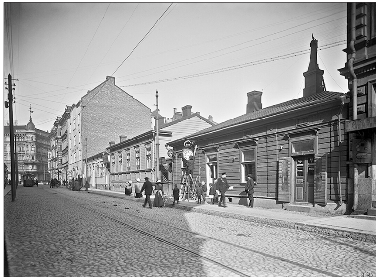
Vuonna 1883 osoitteesta Roobertinkatu 6 vuokrattiin tilat, joita kutsuttiin Ensimmäiseksi kodiksi. Tilat koostuivat viidestä huoneesta, joista kolmessa oli sänkypaikkoja 22 henkilölle. Lisäksi tiloissa oli ruokasali, työhuone sekä pieni kirjasto.