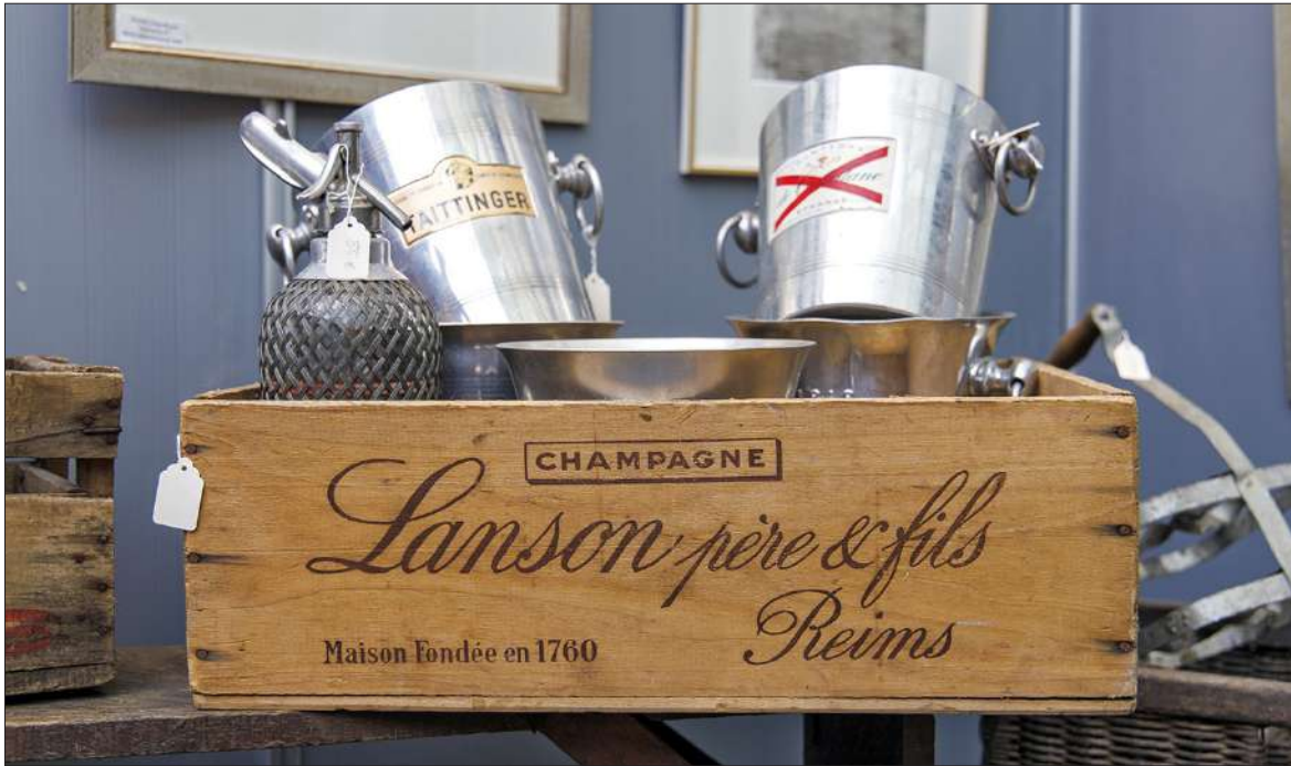
Vanha puulaatikko on monin tavoin upeampi, kuin kaupasta vastaava uutena ostettuna.