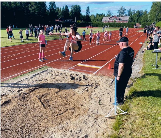
Ensimmäisissä Ränkikisoissa viime kesänä kirjattiin huikeat 140 urheilusuoritusta noin 60 kilpailijan voimin. Tunnelma oli korkealla ja kyltien välisestä paremmuudesta kisattiin puolitosissaan.

pahtumana löytyi yhtä paljon aikuisia osallistujia, kuin lapsiakin!