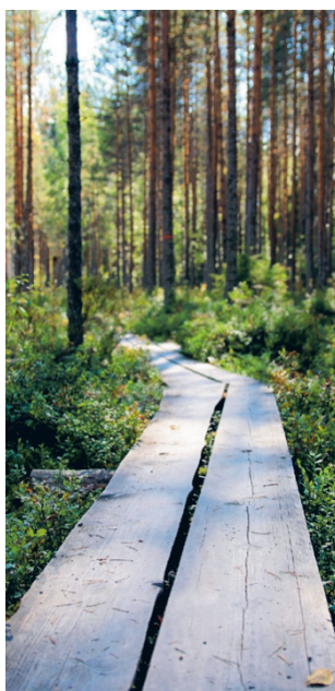
Soinissa patikoidaan kesän aikana Kuninkaanpuistossa ja Arpaisilla. Arpaisten patikallaan juhluvuosi.

Soinin kunta, Kuusiolinna Terveys Oy sekä paikalliset yhdistykset ja yritykset järjestävät yhteistyössä eläköityneille soinilaisille hyvinvointiaihaiset messut. Messut järjestetään tiistaina 7.5. kello 11–14 Soinin