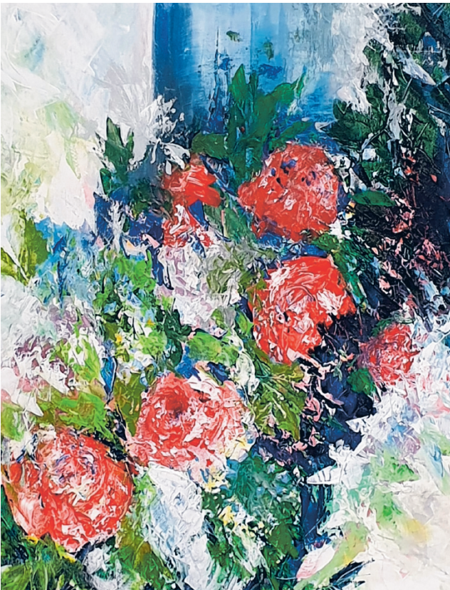
Villa Väinölän näyttelyssä Iloa, valoa, varjoja nähdään Järvi-Pohjanmaan kansalaisopiston kuvataide- ja posliininmaalausryhmien tuotoksia.

lyijykynätöitä ja posliininmaalauksia. Tuunailtiin myös vanhoja maljakoita uusiokäyttöön ja joulukuksi maalattiin värikkäitä pulloja jouluaiheisilla kuvilla jouluvaloja varten.