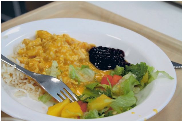
Lappajärvi on maamme kärkeä koululounaan laadun ja maistuvuuden perusteella. Kouluterveyskyselyn tulosten perusteella yhteiskouluun haettiin ja saatiin Kouluruokadiplomi.

Lappajärven hyvinvointivaliokunta linjasi jo vuoden 2021 Kouluterveyskyselyn tulosten perusteella, että Kouluruokadiplomia haetaan. Diplomin hakemista varten perustettiin