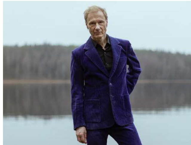
Ismo Alankon Yksin-kiertue saapuu kesällä Lappajärvelle.

Ainutlaatuisen uran tehnyt Ismo Alanko on jättänyt lähte-