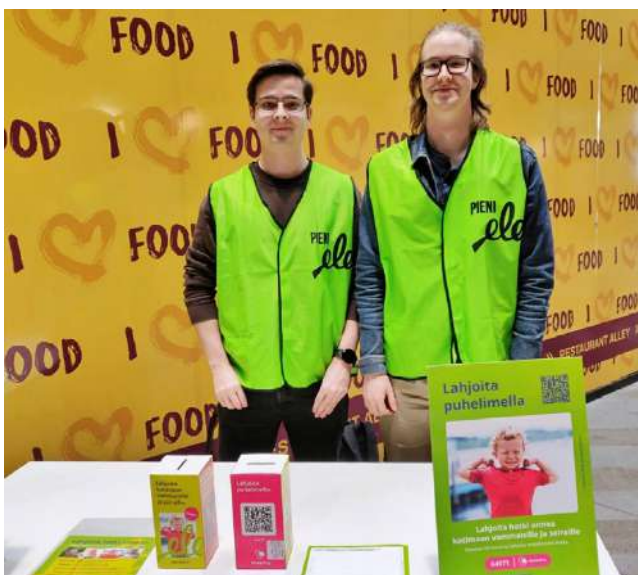
Tuhannet vapaaehtoiset keräävät lahjoituksia vammaisille ja pitkäaikaissairaille presidentinvaalien äänestyspaikoilla.

Käytännön tasolla pitkäaikaissairaiden ja vammaisten tulot voivat olla erittäin pienet ja lisäkuluja tulee lääkkeistä ja muista erityistarpeista. Myös pitkään sairastaminen ja ehkä jopa elämän pituiset kivut sekä hankaludet voivat aiheuttaa masennusta ja ahdistusta. Tällöin