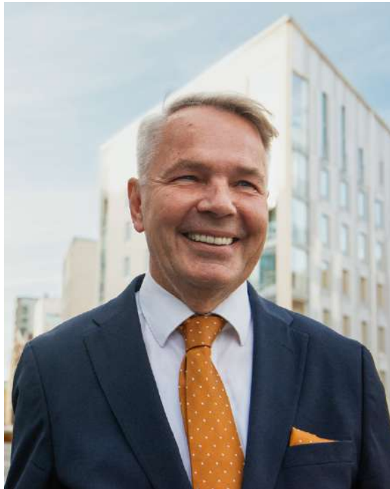
Pekka Haavisto.