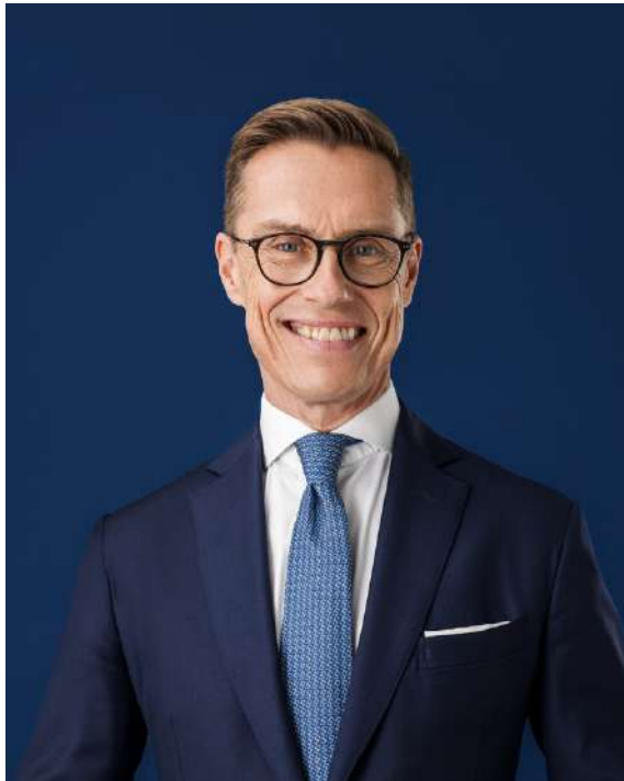
Alexander Stubb.