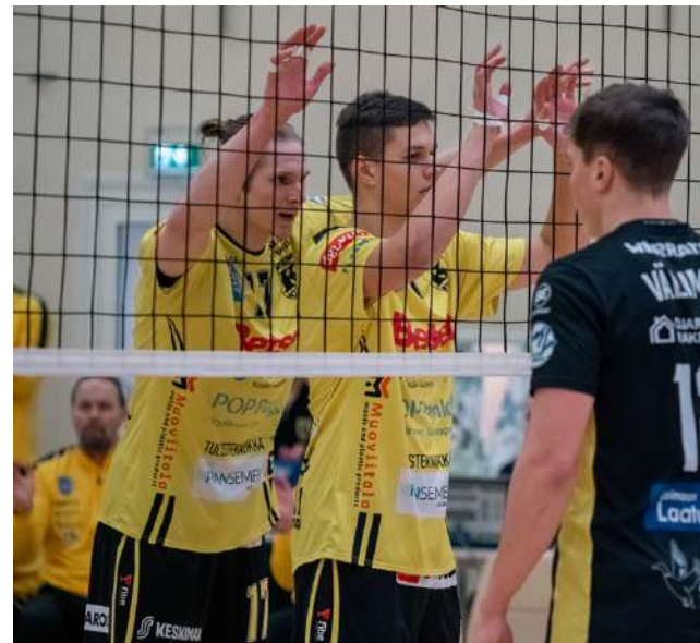
Pelit jatkuvat Kyy York Areenalla tulevana viikonloppuna.