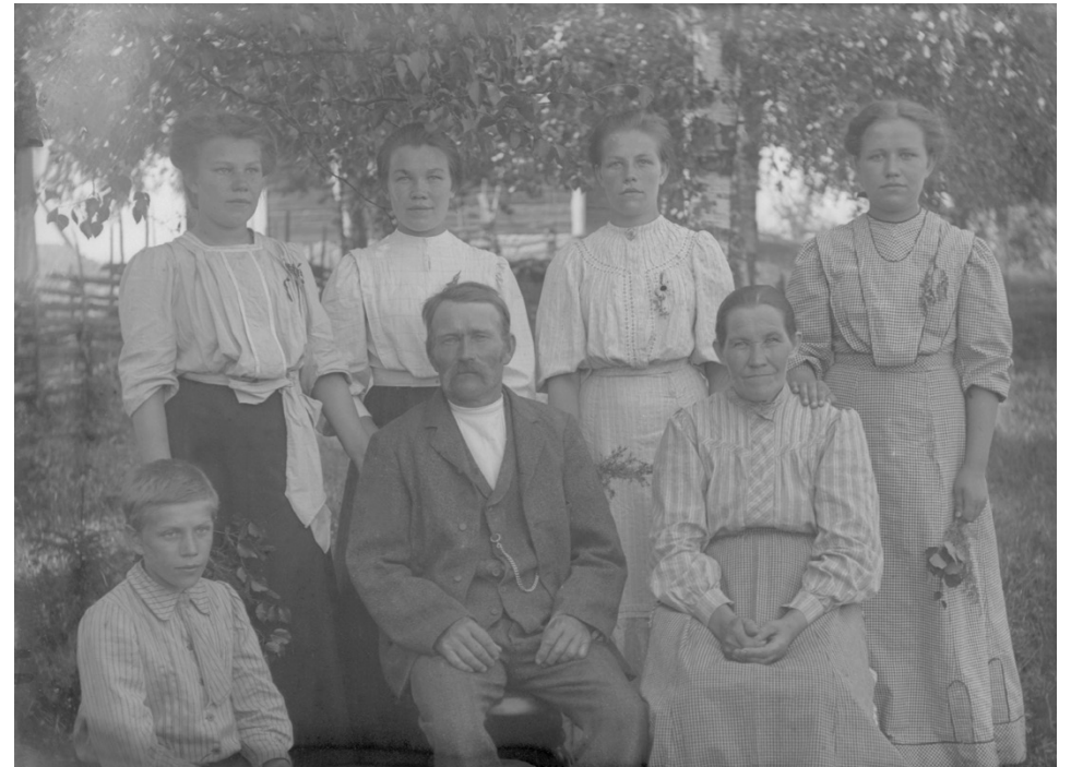
Alajärven luennolla käydään läpi Y-DNA-tutkimuksen perusteita sekä sen hyödyntämistä suku- ja asutushistorian tutkimuksessa. Esimerkit on valittu Järviseudun suvuista.

– Y-DNA kertoo miehen suoran isälinjan vaiheet ihmiskunnan alusta lähtien parhaimmillaan viimeisiin vuosisatoihin asti, Linna ja Kolehmainen kertovat.