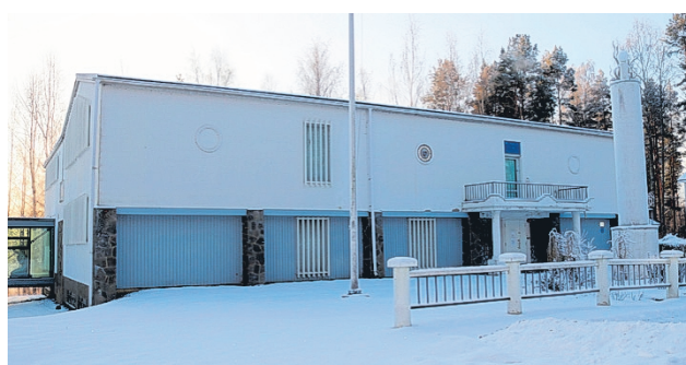
Alajärven kaupunki selvittää kuntalaisten mielipiteitä Nelimarkka-museon toiminnasta ja tulevaisuuden tilaratkaisuista.

Museo järjestää vaihtuvia näyttelyitä, tapahtumia ja työpajoja useissa eri tiloissa. Varsinaisen museorakennuksen lisäksi toimintaa järjestetään esimerkiksi Väinölässä sekä