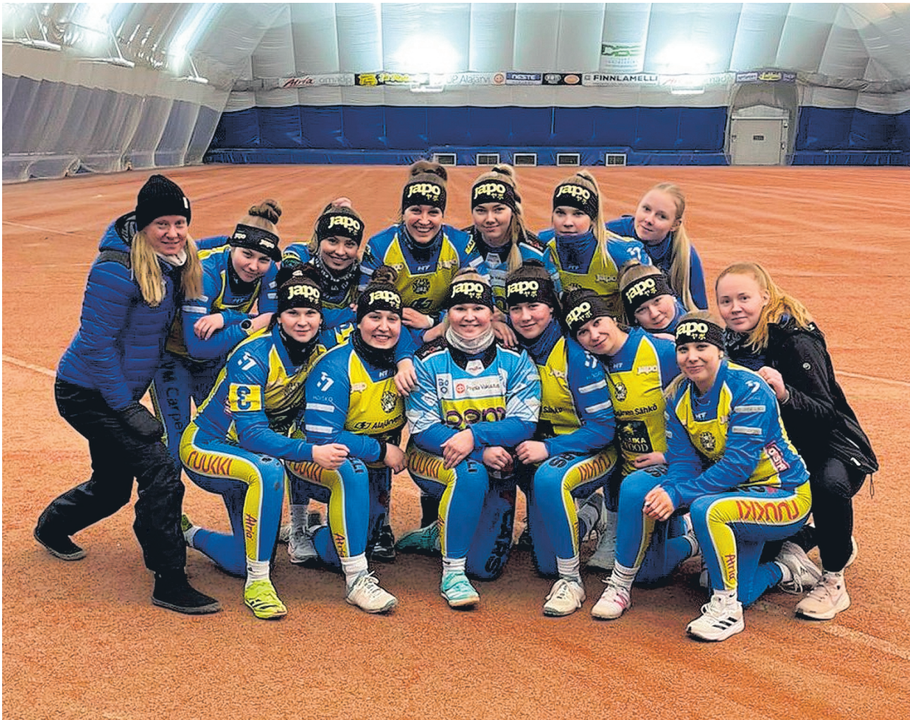
Alajärven Ankkureiden naisten ykköspesiksen joukkueelta on lupa odottaa hyviä ja tapahtumarikkaita otteluita läpi kesän.

Kuluvalla hallikaudella Ankkureiden naiset pelaavat yhteensä viisi harjoitusottelua. Vastustajat ovat tällä kertaa valikoituneet kesän pohjoislohkon joukkueista. Loppupalven peleissä kohdataan vielä Jokilaak-