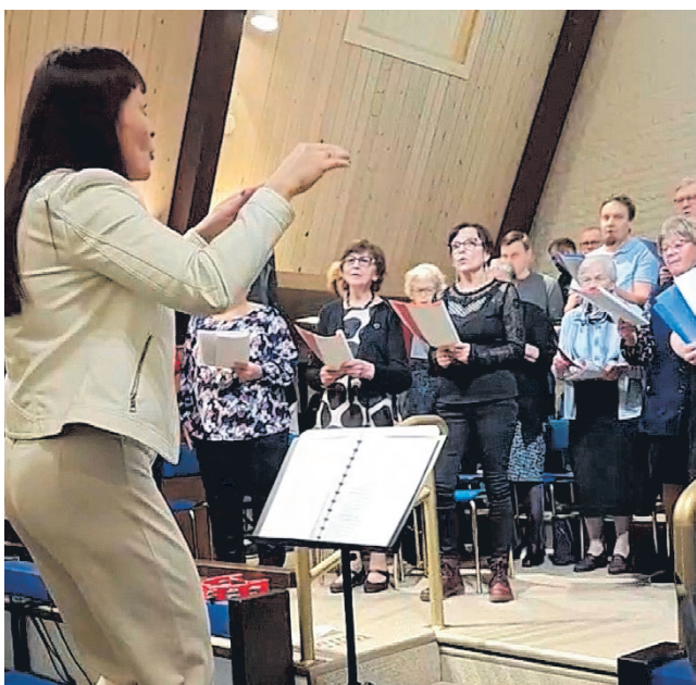
Näky-suorukoro esiintyi lokakuussa täydelle salille. Huhtikuun esiintymistä varten alkavat harjoitukset maaliskuun viimeisenä sunnuntaina, johon ovat myös uudet laulajat tervetulleita.

Nyt on mahdollisuus tulla suurukoroilemaan ja kokea laulamisen riemua lavan täydeltä! Tarkemmat harjoitusajat ja esiintymisaika löytyy Alajärven helluntaiseurakunnan tiedotuskanavilta.