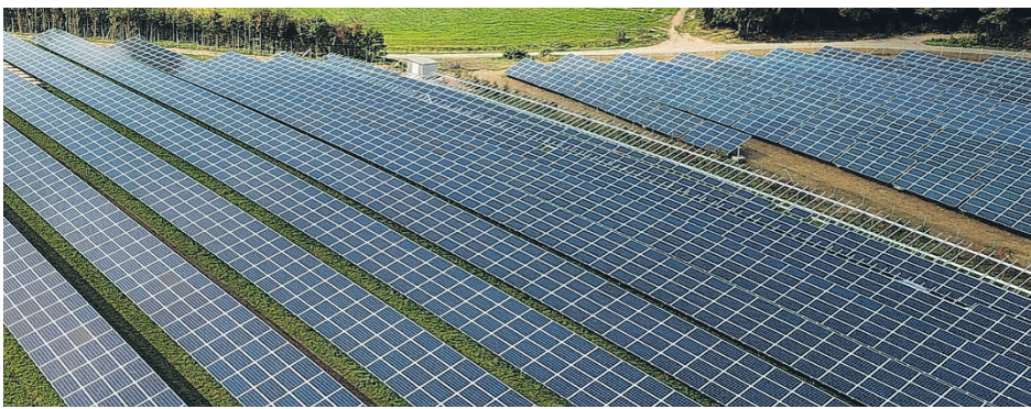
Korpisalonnevalle suunnitellun aurinkovoimalan hankealueen laajuus on noin 505 hehtaaria, ja hankealueen maanomistus koostuu Vapo Terran sekä yksityisten maanomistajien kiinteistöistä. Viitekuva.

aluerajaus, aurinkovoima-alueiden, sekä energiavaraston sijoittelu kaava-alueen sisällä, ja sähköverkkoon liittämiseen tarvittava voimajohtoreitti tarkentuvat kaavaprosessin aikana. Verkko-liityntä on tarkoitus toteuttaa Fingridin Alajärven sähköasemalle.