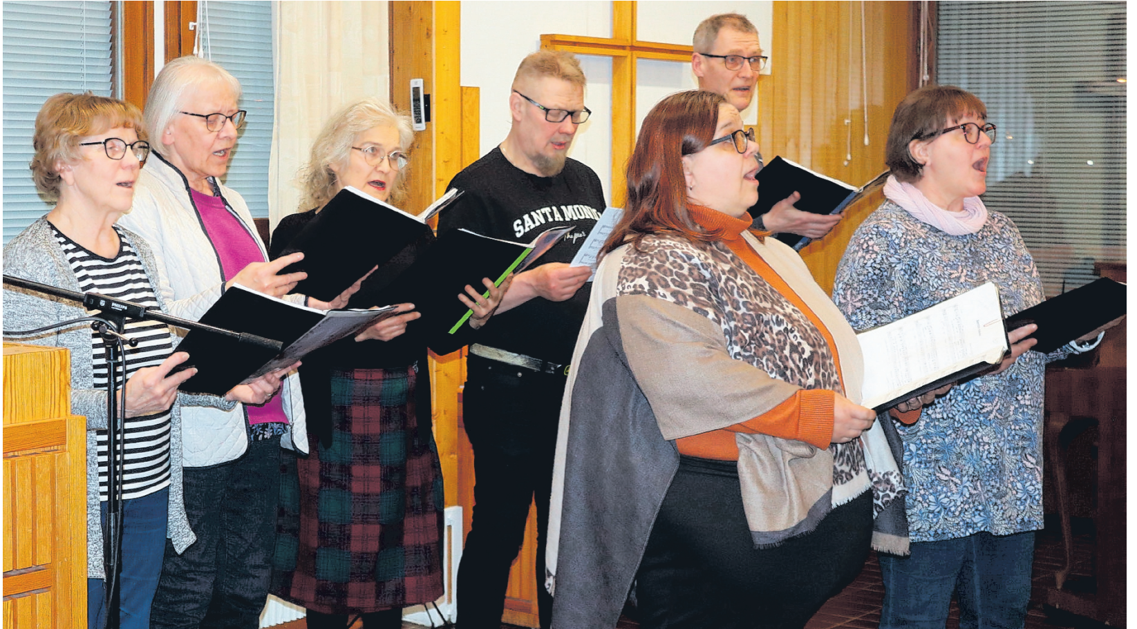
Soinin kirkkokuorossa lauletaan jo sadan vuoden perinteellä. Kuoro esiintyy vuosittain useissa jumalanpalveluksissa ja juhlii juhluvuottaan lokakuussa.

Harjoituksia pidettiin esimerkiksi Anttilassa 24 laulajan voimin tai keskellä talvea kylmässä pappilan tuvassa. Kuorolaiset saattoivat matkustaa harjoituksiin naapurikyliin