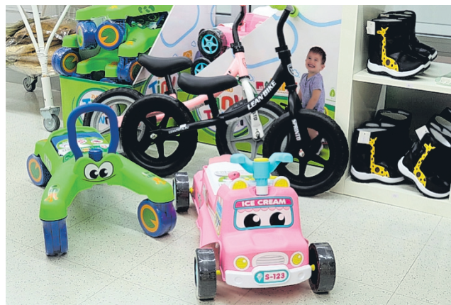
Leluvalikoimasta löytyy vauhdikkaita suosikkeja, kuten potkuautoja ja muita liikkumiseen innostavia leluja, jotka kehittävät lapsen motorisia taitoja leikin lomassa.

motorisia taitoja tukevia leluja sekä aistileluja niin pie-