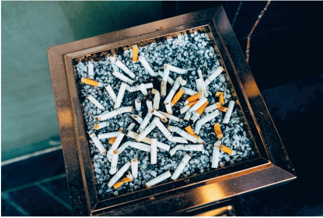
Kouluterveyskyselyn mukaan 8. ja 9. luokan oppilaista tupakoi päivittäin seitsemän prosenttia, ammatillisen oppilaitoksen 1. ja 2. vuoden opiskelijoista 21,6 ja lukion 1. ja 2. vuoden opiskelijoista 3,1 prosenttia.

Alkuvuodesta pidettiin ensimmäinen maakunnallinen verkkovanhempainilta Etelä-Pohjanmaalla. Tuolloin kokoonnuttiin someasioiden ja älylaitteiden äärelle noin 350 vanhemman voimin kuulemaan median