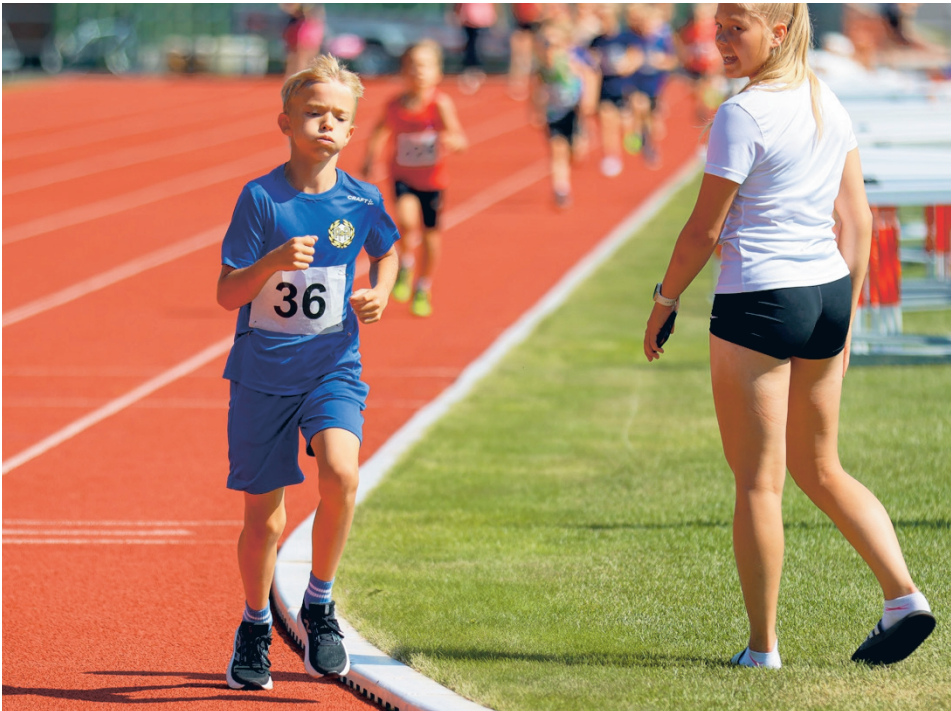
Eniten seuraennätyksiä (8 kpl) tehtiin mainion kesän urheilutopias Keltikangas, joka pisti 9-vuotiaiden poikien tilastojen kärjen uusiksi usealla juoksumatkalla, otteluissa ja korkeudessa.

Valtakunnallisen Tulevat Tähdet -monipuolisuuskilpailu kilpailu kannustaa kilpaurheilusta kiinnostuneita lapsia (13v saakka) kilpailemaan mahdollisimman monessa eri yleisurheilulajissa. Pisteitä saa myös tuloksesta. Eniten pisteitä keräsi tänä vuonna Jalo Kantonen,