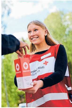
Nälkpäiväkeräys alkaa huomenna torstaina.

Katastrofirahastoon tehtyjen lahjoitusten turvin on autettu myös maakuntamme alueella