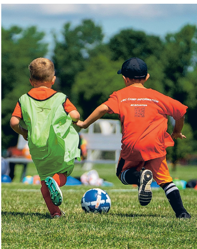
Harrastamisen hinta ja sen nousupaineet ovat nyt yhä useamman suomalaisen perheen haasteena. Kuvituskuva

Vuonna 2023 tehdyssä kyselyssä kävi myös ilmi, että enemmän kuin joka neljäs lapsi tai nuori Etelä-Pohjan-