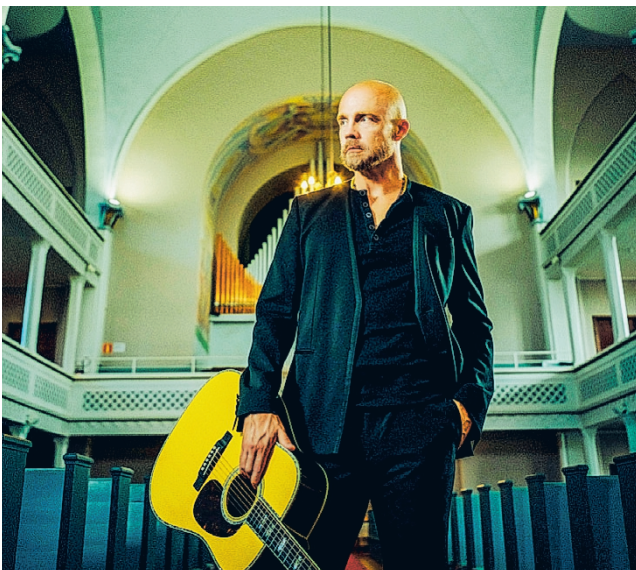
Juha Tapion konserteissa kuullaan niin joulun klassikoita kuin artistin omia rakastettuja kappaleita hänen yhtyeensä sielukkaina soituksina.

– Viime vuoden joulukiertueesta jäi valtavan hyvä mieli, ja sen perusteella päätimme toteuttaa tänäkin vuonna muuttaman konsertin. On hienoa