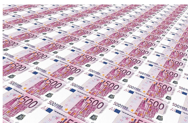
Rahat eivät riitä. Hyvinvointialueen aikaisempien vuosien alijäämän kattaminen laissa vaaditussa ajassa, eli vuoden 2026 loppuun mennessä, vaarantaisi lakisääteisten ja perusoikeuksien mukaisten palvelujen järjestämisen sekä väestön terveyden edistämisen.

Kuusiolinna Terveyden toimintojen siirtyminen hyvinvointialueen omaksi toiminnaksi vaikuttaa talousarvion toteutumiseen: henkilöstöku-