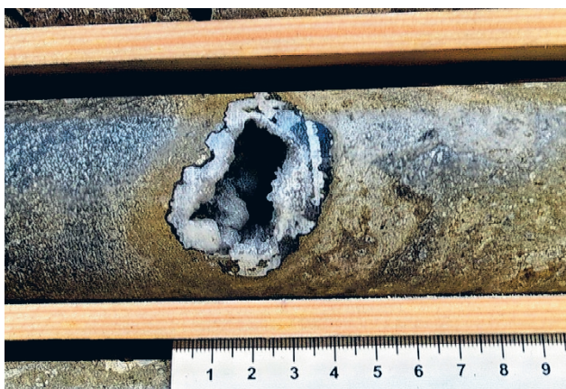
Lappajärven törmäysulapitoinen breksia, jossa on mineraaleilla täyttyneitä onkaloita. Tämä kairasydännäyte oli mukana tutkimuksessa.

Nämä elämän merkit syntyivät noin 47 asteen lämpötilassa, joka on ihanteellinen mikrobiekosysteemeille. Näytteinä hyödynnettiin GTK:n geologisen näytearkiston kairasydämiä, joista löytyi mineraaleilla täyttyneitä onkaloita. Elämän merkkien näkemisen lisäksi tutkijaryhmä pystyi määrittämään tarkasti, milloin se tapahtui. Tämä antoi aikaja-