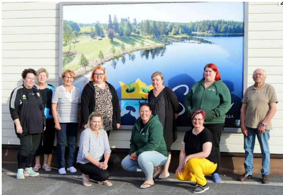
Arpaisten patikkaa puuhataan jälleen kokeneen ja osaavan järjestelyporukan toimesta! Syksyn paras luontoretki siis odottaa vain osallistujiaan!

Osallistumismaksuun sisältyy bussikuljetus lähtöpaikoille, mehut patikan varrella viidestä mehupisteestä, maastoruokailu, jossa tarjolla on hernekeittoa ja banaania, sauna ja uinti Soinin kuntotiloissa, kunniakirja sekä osal-