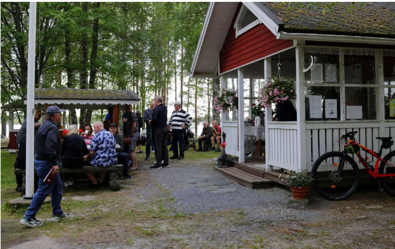
Noin 30 Hankajärven rannanomistajaa saapui kuulemaan vesiensuojeluyhdistyksen kunnostushankkeesta. Kaikkiaan rantakiinteistöillä on noin 50 eri omistajaa.

Suunnitellulla veden korkeuden turvaamisella parannetaan kalojen elinolosuhteita. Ilmaston lämpeneminen nostaa myös veden lämpötilaa