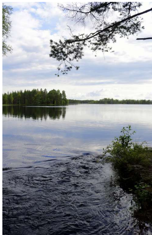
Vesi virtaa nyt vuolaana Hankajosken myöten, sillä järven pinta on poikkeuksellisen korkealla. Yleensä tähän aikaan kesästä tilanne ei ole tämä.

pohjapato, joka nostaisi järven alinta vedenkorkeutta 25-30 senttiä. Suunnittelijoille lähtee asiasta tarjouspyynnöt pikapuoliin ja tässä yhteydessä tullaan pohtimana myös sitä,