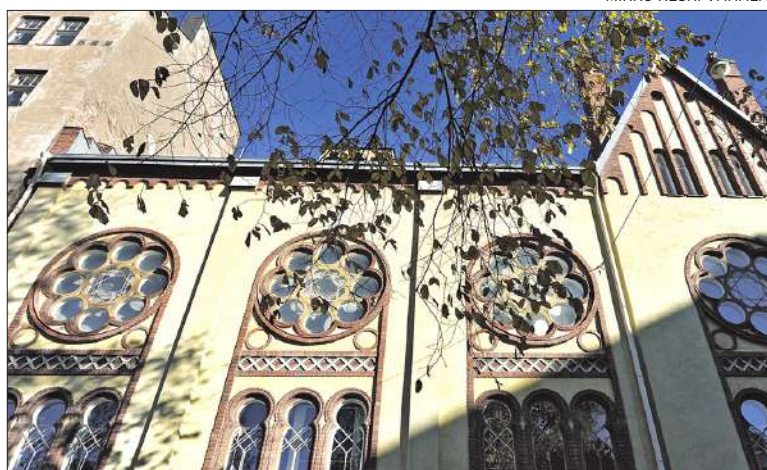
Punavuoren asukastalo Betanian käyttötarkoitus muuttuu.

ASUKKAANA olen ilahtunut, että toiminta Betaniassa säilyy. Toivoin kuitenkin, että jatkosuunnittelua tehtäessä huomioitaisiin myös asukastalon tarpeet. Käytännössä Betanian toiminta on ollut pitkään hiljaisena. Nyt asukastalolle on luvattu jatkoa remontin alkuun asti eli kesään 2024 asti. On