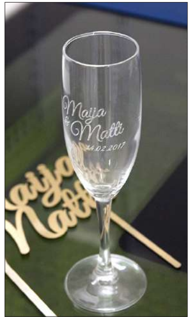
Kuitulaserkaiverruskoneella voi kaivertaa pikkutarkasti monimutkaisiakin kuvioita erilaisille materiaaleille kuten puulle, lasille, metallille ja kivelle. Koneella voi myös leikata pehmeitä materiaaleja kuten muovia haluttuihin muotoihin.

puksuttaa ja suoltaa laadukkaita tulosteita eri kokoisina erilaisille materiaaleille painettuna. Eikä ihan oikea tulostettu valokuva- kaan ole mihinkään kadonnut. Esimerkiksi läheiset tai muut merkitykselliset asiat esittäytyvät yhä valokuvissa, jotka kauniisti kehystettyinä tuovat iloa koti- in. Valokuvan voi tulostaa myös puuvillakanvaasille seinätauluk- si, ja matkalle hamuava ihminen tarvitsee edelleen passiinsa passi- kuvan. MEB tulostaa kaikenlaisia dokumenteja lentolipuista koulu- tusmateriaaleihin.