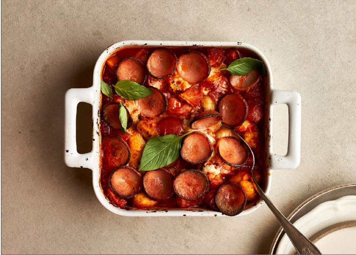
Sinnen Lenkki taipuu mainiosti myös gnocchi-vuokasi.