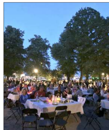
Liisanpuistikko on tapahtuman pääpaikka.

Kunniaa sille, joka kotikulmiaan rakastaa