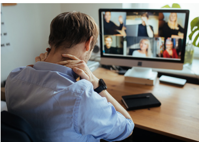
Jatkuvan tavoitettavuuden koki omalla työpaikallaan kuormittavan jatkuvasti 21 prosenttia ja jossain määrin 51 prosenttia.

Yksi keino on olennaistaa työtä, mikä tarkoittaa työn ytimen kirkastamista, olennaisimpien tehtävien tunnistamista ja työn rajaamista tämän pohjalta niin, että työmäärä on kohtuullinen. Työn määrästä, työtehtävistä ja työnjaosta kannattaa keskustella yhdessä, jotta voidaan luoda yhteinen