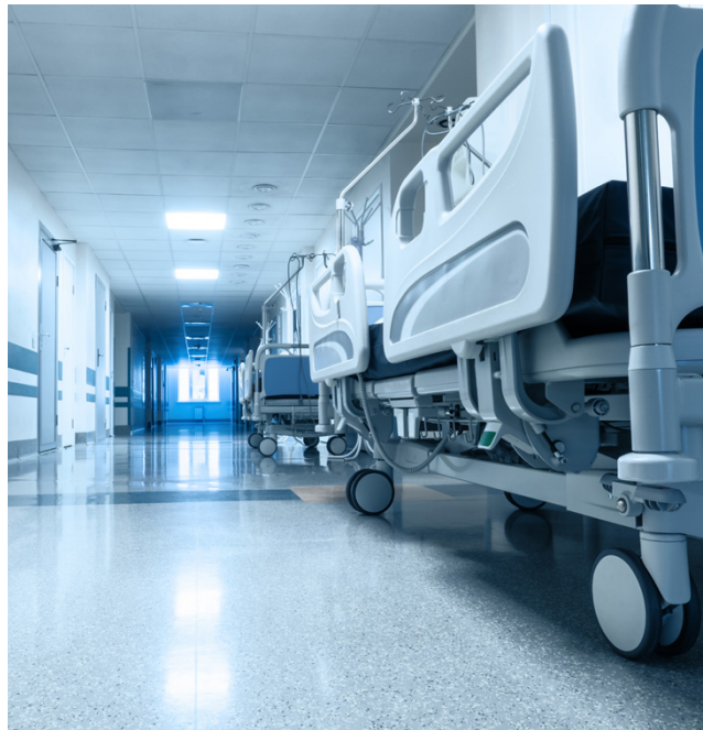
Heinäkuun alussa hyvinvointialueelle siirtyvä erikoissairaanhoidon - esimerkiksi lonkkaleikkaukset - jota on tuotettu Pihlajalinnalla-konsernin muissa toimipisteissä. Kuvituskuva

Muut asiat -pykälässä keskusteltiin Kraatterijärvi Geoparkista. Kunnan kanta liittymiseen on edelleen negatiivinen. Kunnanhallitukselle myös kerrottiin kunnan harjoittelijoista, sekä tulevista kesätyöntekijöistä. Nuorille osoitetut kesätyöpaikat ovat olleet haettavina. Päätökset tehdään lähiaikoina. Yrityksille ja yhdistyksille avataan mahdollisuus hakea kesätyöpaikkaa nuorten työllistämiseen. Hakuaikaa on 19.4. saakka.