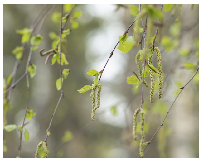
Koivu on Suomessa tavallisin siitepölyallergian aiheuttaja. Koivuallergisista 80 - 90 % saa oireita myös lepän ja pähkinäpensasien siitepölyistä.

Suositus on, että alle kou- luikäisen allergialääkityksestä päättää lääkäri. Sitä vanhem- mat lapset ovat yleensä itse- lääkityksen varassa. Haas- teena on, että vanhemmat ei-