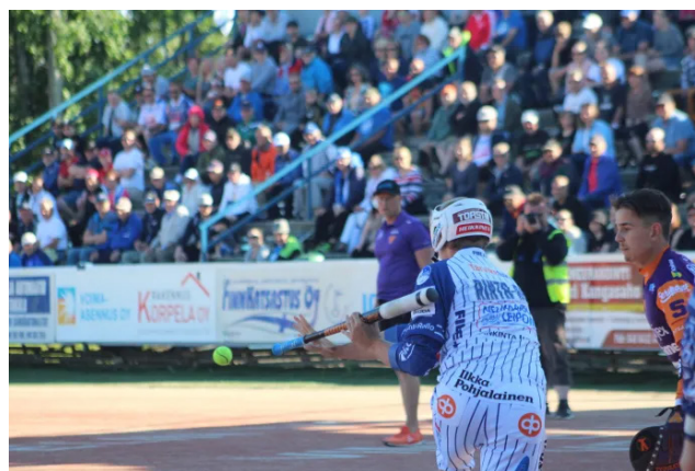
Esimerkiksi Vimpelissä ja Alajärvellä pelattavat miesten Superpesis-ottelut ovat yleisötilaisuuksia. Superpesis-otteluita varten tehdään myös esimerkiksi pelastussuunnitelma. Arkistokuva.

Ainakin seuraavanlaisista tilaisuuksista on syytä tehdä ilmoitus: suuret tapahtumat (useita satoja osallistujia), yleisten paikkojen ulkotapahtumat – varsinkin jos tapahtuma järjestetään liikenneväylällä ja erityisryhmille suunnatut tilaisuudet. Jos tapahtuma kestää myöhäisiltaan tai yöhön, tekee järjestäjä ilmoituksen poliisille. Ilmoitus tehdään myös, jos tapahtumassa tarvitaan järjestyksenvalvontaa tai