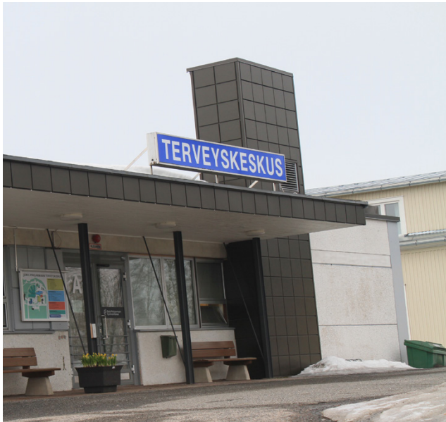
Alajärven kaupunginvaltuusto on myöntänyt 15 000 euron lisämäärärahan Järvi-Pohjanmaan sote-keskuksen happihuoneen rakentamista varten.

Valtuusto myönsi 18 000 euron suuruisen lisämäärära-