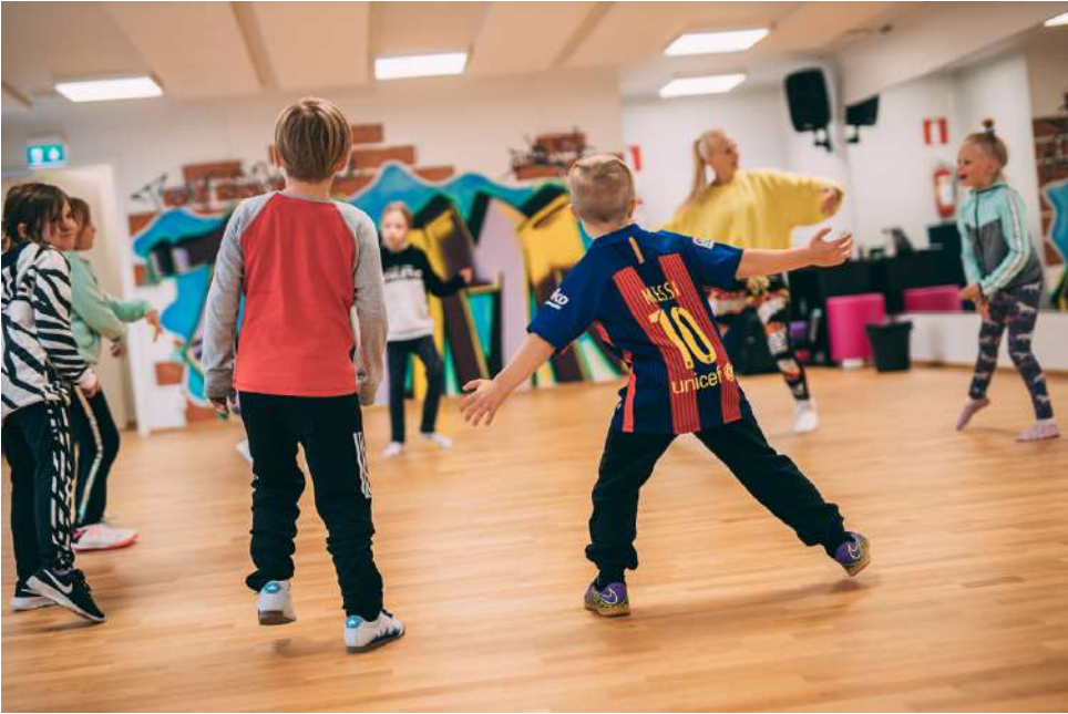
Tanssi on matalan kynnyksen harrastustoimintaa, jossa yhdistyvät tanssi, musiikki ja yhteisöllisyys.

Viime lukukaudella Wim- man tanssitunneilla Alajär- vellä kävi viikoittain noin 80 tanssikärpäsen pureman saa- nutta eri-ikäistä harrastajaa.