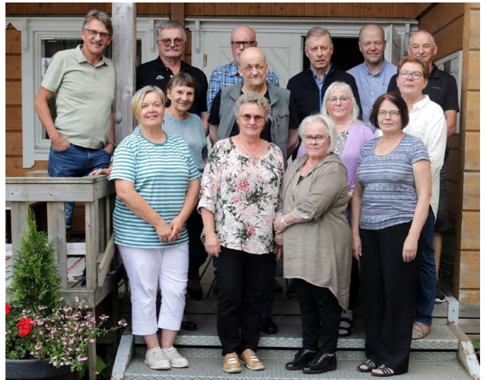
50 vuotta keskikoulun päättymisestä, eikä kukaan ole vanhentunut päivääkään! Tälle ainakin tuntui tämän iloisen ryhmän kokoontumisessa, jossa juttu luisti ja vanha yhteys oli tallella!