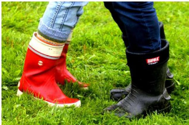
Suninsalmi Soin yleisöllä oli asenne kohdallaan! Tanssikin sujui jo alkuillasta vaikka sitten kumpparit jalassa!