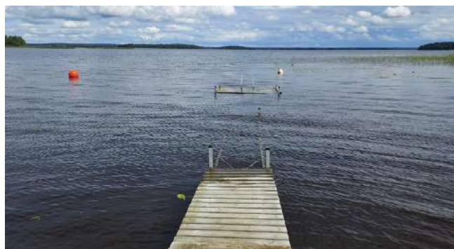
Laituri veden alla Lappajärvellä.

Ähtävänjoen vesistöalueella Alajärveen laskevan Kuninkaanjoen pinta nousi heinäkuun lopulla kevättulva-