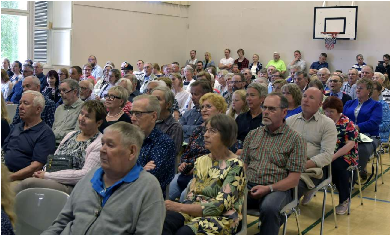
Patanan kylää ja kylän asukkaita tultiin juhlimaan läheltä ja kaukaa, aina Tukholmasta saakka.