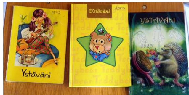
Ystäväni -kirjat vuodelta 1972, 2003 ja nyt uusin tässä tapaamisessa täytetty kertovat omaa, mielenkiintoista historiaansa.

oppilasta, joista viisi on nyt edesmenneitä. Jokaiseen luokkakaveriin saatiin edelleenkin yhteys, mutta osa asuu kovin kaukana ja osalla oli muita esteitä, mutta tapaamiseen saatiin kuitenkin edelleen näin hyvä joukko osallistujia!