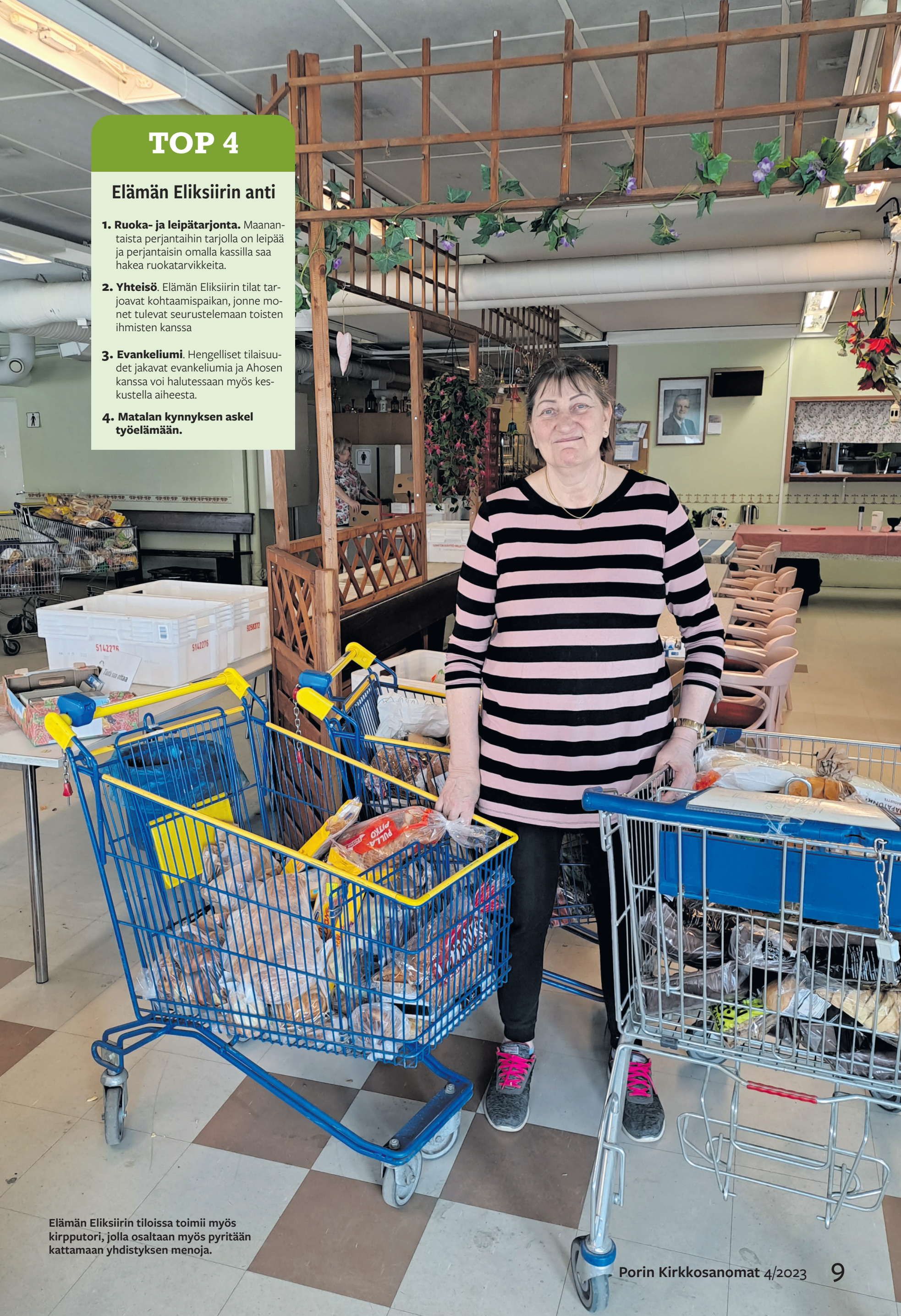
Elämän Eliksiirin tiloissa toimii myös kirpputori, jolla osaltaan myös pyritään kattamaan yhdistyksen menoja.