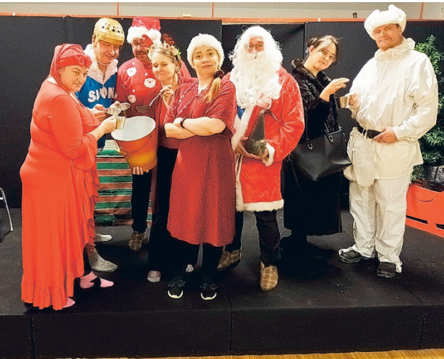
20-vuotias Kätkänjoen näytelmäryhmä yllättää juhlavuotenaan pikkujoulujouluajan vauhdikkaalla komediolla.

Tässä joulutarinassa työntekijöitä palkitaan nyttikestein järjestettävillä pikkujouluilla johon pikkupomon mielestä miesstrippari olisi hyvä ohjelmanumero. Jouluherkkuja on makkarasta punaisella lapulla varustettuun einemaksalaa-tikkoon. No mutta kyllä yri-