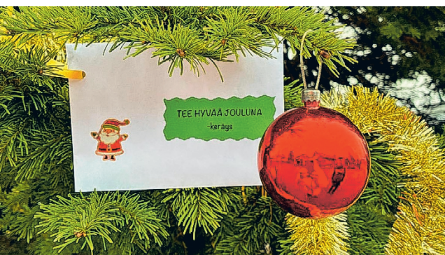
Soinissa kerätään hyvää jouluksi.

Kertynyt tuotto annetaan hyvinvointialueen sosiaali-toimelle, joka tekee päätökset