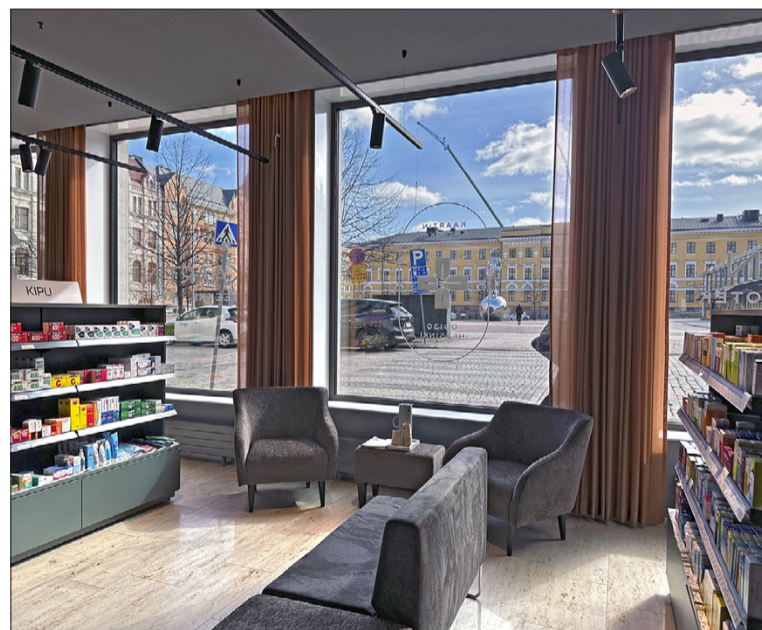
Kaartin apteekin mukavassa nojatuolissa levähtää maisemista nauttien.

Iloisen ja puheliaan apteekkarin juuret ovat Etelä-Karjalassa. Hän tosin patinoitui helsinkiläiseksi jo lapsena ja kävi koulut läheisessä Norssissa. Nykyään hänen kotinsa on punavuorelaisessa jugendtalossa, josta hänen lyhyt työmatkansa taittuu kävellen. Vuonna 1996 proviisoriksi valmistunut apteekkari työskenteli aikaisem-