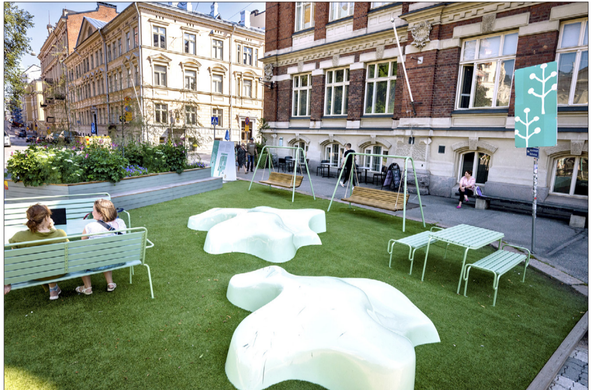
Designmuseon aukion kesäkatu vuonna 2023.

KASARMIKADUN kesäkatuosuutta ei toteuteta enää kesällä 2024. Kasarmikatu oli kesäkatuna ensimmäistä kertaa vuonna 2021