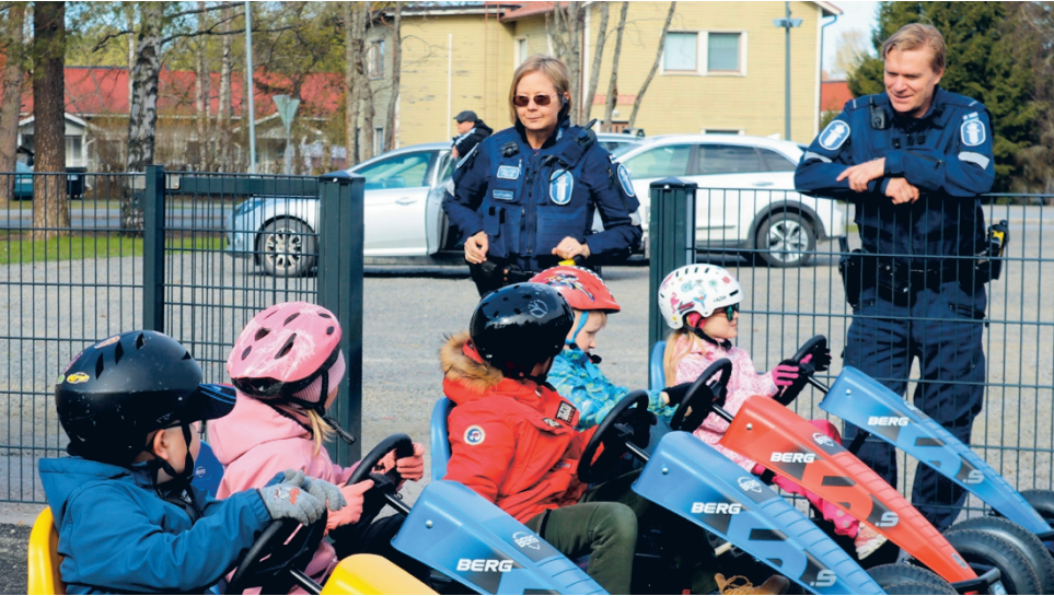
Liikenneradalle starttaamassa olleiden lasten äänet vähenivät hetkeksi kunniotuksesta, kun paikalle tapahtumaa valvomaan saapui oikeita poliiseja!