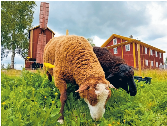
Väinöntalo – Järviseudun museo esittelee järwiseutulaisten talonpojan elämää, sen arkea ja juhlaa, entisajan kädentaitoja, uskomuksia sekä pyynti- ja tapakulttuuria.

Lisäksi kesään mahtuu myös muita yleisötapahtumia kuten perinnelauluilta 26.6., Runon ja musiikin iltapäivä Eino Leinon päivänä, johon runonlausujat ja laulajat ovat tervetulleita, 27.7. pidetään kesäseurat toivevirsi-