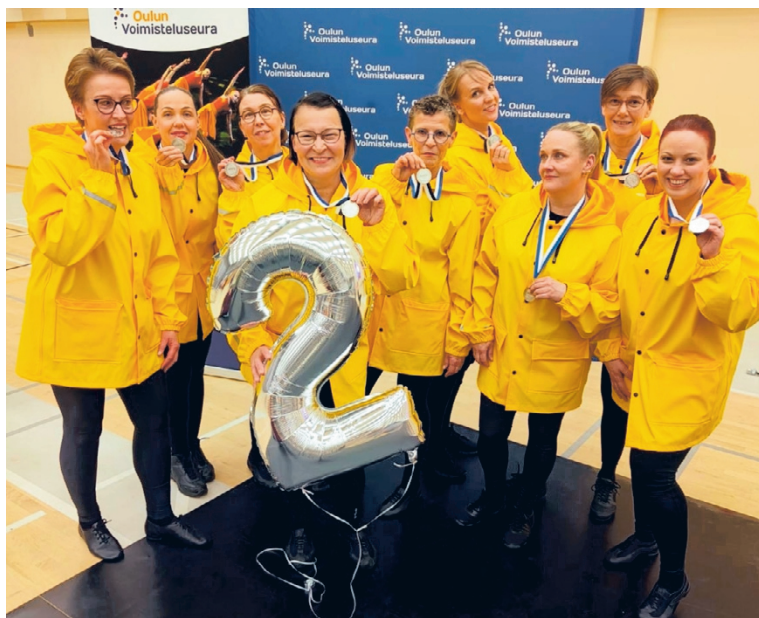
Alavolin naisten esiintyvä tanssiryhmä Aallot menestyi Voimisteluliiton Tanssi Cupin neljännessä osakilpailussa.

Seuraavan kerran Alavolin ryhmät esiintyvät Aaltojen kaupunki -tapahtumassa elokuun lopussa.