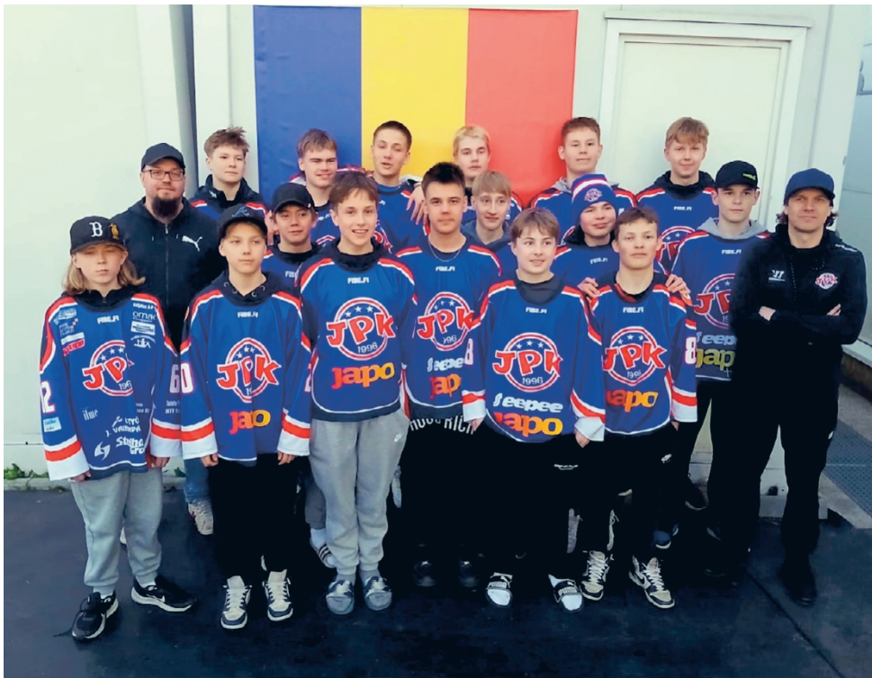
JPK:n U15 -jääkiekkojoukkue teki pelimatkan Romanian Bukarestiin huhtikuun lopulla!

toimitus@torstai-lehti.fi · 040 736 7873