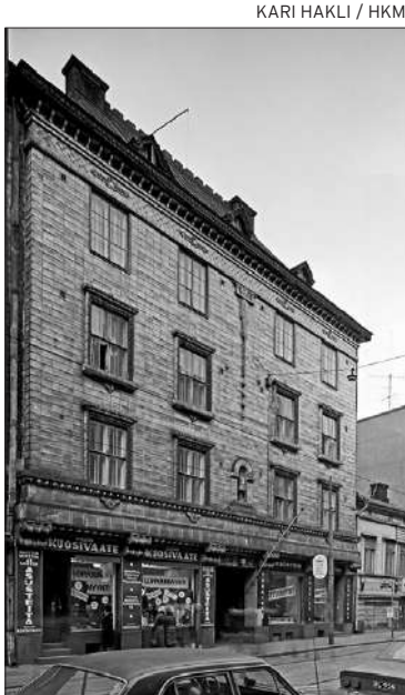
Iso Roobertinkatu 25:ssä sijainnut rakennus purettiin vasta vuonna 1972. Tontti palveli hetken parkkipaikkana, kunnes paikalle rakennettiin toimistorakennus 1980-luvun alussa.