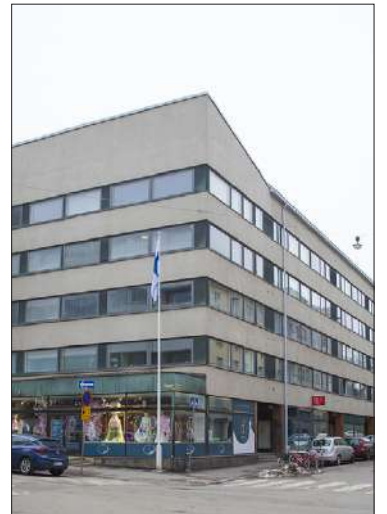
Ison Roobertinkadun loppupäässä sijaitsevan Trapin korttelin puutalot purettiin 1960-luvulla ja paikalle kohosi asuintaloja.