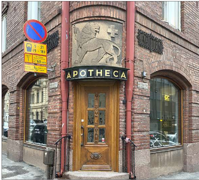
Korkeavuorenkadun ja Pienen Roobertinkadun kulmatalo muistetaan Leijona-apteekista. Apteekin vanhassa tilassa Pieni Roobertinkatu 10:ssä sijaitsee nyt Galleria G & Grafoteekki. Monen liiketilan alkuperäinen käyttötarkoitus on vuosien saatossa muuttunut. Muun muassa pankkikonttorit ovat kaikonneet. Esimerkiksi Ison Roobertinkadun SYP:n tilassa toimii nyt second hand myymälä ja kahvila. Työväen Säästöpankin konttorilla myydään puolestaan designhuonekaluja.