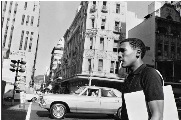
Etelä-Afrikka, Kapkaupunki 1968.