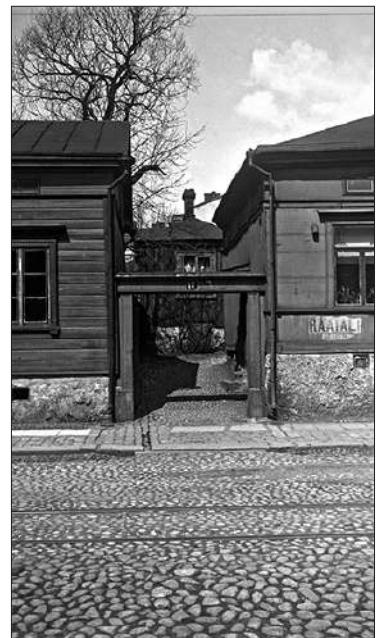
J.L. Runeberg asui Iso Roobertinkatu 17:n piharakennuksessa vuosina 1828-1829.