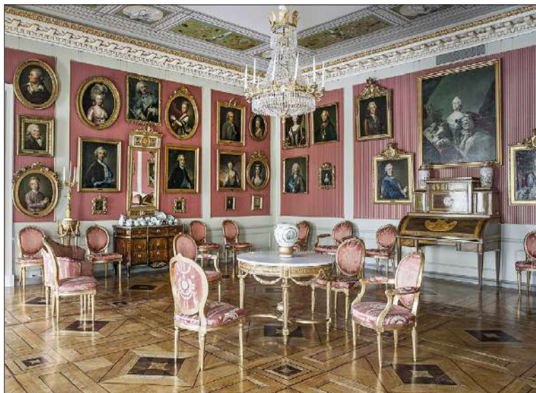
Sinebrychoffin taidemuseon kustavilainen sali.