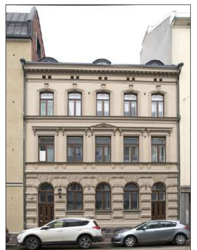
Iso Roobertinkatu 39:ssä sijaitseva uusrenessanssitalo vuodelta 1885 asettuu jugendin ja pelkistetyn klassismin syleilyyn.