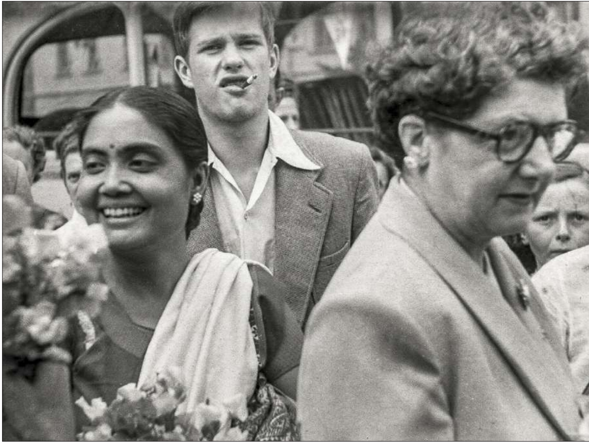
Jörn Donner nuorten rauhankonferenssissa Sri Lankan Colombossa vuonna 1957.