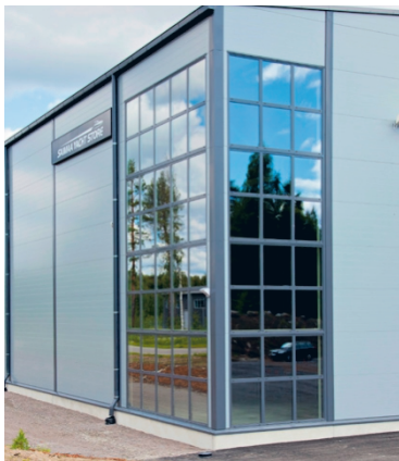
Vimpelin Yhdytiellä aloitettiin Tikli-kattoturvatuotteiden teollinen

Tikli Groupin juuret juontavat 60-luvun alkuun. Nykymuotoisen Tiklin tarina sai alkunsa vuonna 1988, kun