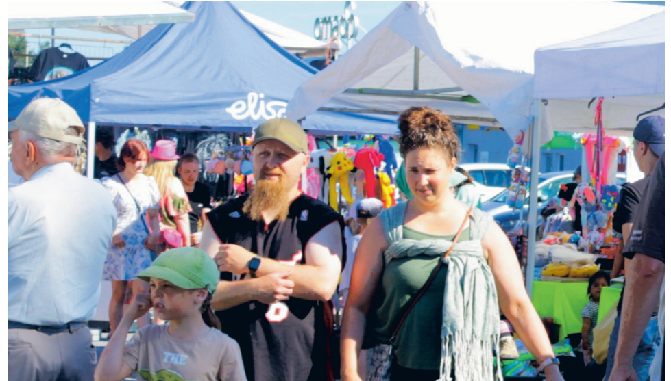
Rokulipäivillä riittää niin markkinamyymälöitä kuin ostavaa yleisöäkin. Samaan aikaan Palotorin lavalla kansaa viihdyttävät lukuisat paikalliset esiintyjät.

Kello 19 vuorossa on Toni Taipale & Boronium -kon-