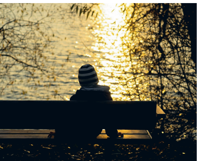
Joka kuudennesta 13-15-vuotiaasta tehtiin lastensuojeluilmoitus vuonna 2023, selviää THL:n tuoreista tilastoista.

Lastensuojeluilmoitusten määrä kasvoi vuonna 2023 jo-