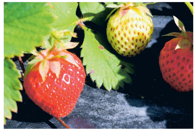
Kesän mansikkasato on juuri nyt kypsymässä parhaimmilleen! Jos helteet palaavat, satokaudesta voi tulla lyhyt.

tynyt aina hyvin, suuri kiitos siitä kuuluu Jamin ulkomaisille opiskelijoille. Heitä on ollut hyvin tarjolla työhön tilalle kevään istutuksista alkaen, samoin kesällä mansikanpoimintaan. Tänä kesänä pari kosvolaista sairaanhoi-