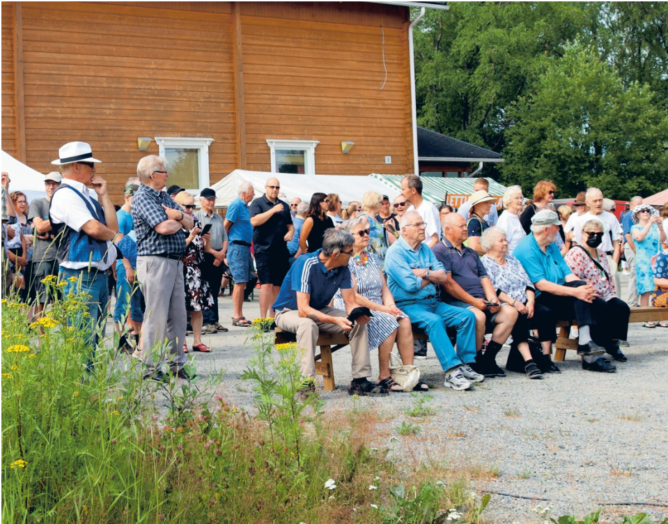
Räinkiviikon yksi osa ovat Ränkimarkkinat, joilla ohjelmaa seurattiin tähän malliin vuonna 2019. Arkistokuva.

Keskiviikkona 10.7. kello 11-16 on Ränkibingo srk-kodilla Ikioman järjestämänä. Jalkapallokentällä käydään kepparikit jalkapallokentällä. Illalla on vuorossa 10.7. Fagerkulla-festit