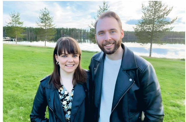
Eve ja Ossi laulavat ja laulattavat Lauttosen lauluilla.

tutuja kesäisiä lauluja ja ehkä laulu. Pääosin laulamme yhdessä tapahtumaa varten la-