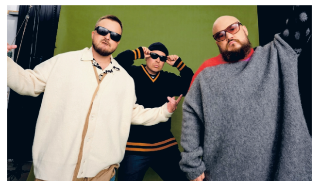
Teflon Brothers vastaa Saarikenttä Festivaalin viimeisestä keikasta, joka alkaa viisi minuuttia yli puolen yön sunnuntaina 7. heinäkuuta.