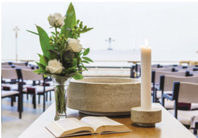
Kastepöydän kuva: Ajaton

Kastetilaisuudessa tulee olla pöytä, valkoinen liina, valkoinen kynttilä, Raamattu, kastemalja ja pään kuivaamiseen tarkoitettu liina. Pöydässä voi olla myös kukkia. Seurakuntatoimistosta voi lainata kotikasteeseen maksutta kastemaljan ja liinan. Lapsen ylle puetaan valkoinen kastepuku, jonka voi tarvittaessa lainata seurakuntatoimistosta.