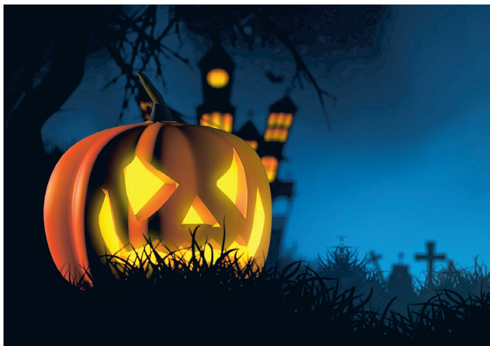
Jamin Alajärven toimipisteessä, Hoiskontie 25:ssä, järjestetään pitkistä aikaa kaikille avoin, koko perheen Halloween-tapahtuma.

Jamissa ollaan viime vuosina panostettu yhä enemmän tekemällä ja käytännön kautta opiskeluun. Joskus vastaavanlaista tapahtumaa on järjestetty pienimuotoisempina Kurejoen toimipisteessä. Tällä kertaa ta-