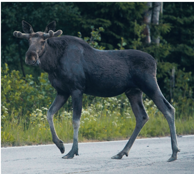
Ajonopeuden hidastaminen hirvivaara-alueella on paras tapa välttää hirvikolari.

Hirvieläinonnettomuuksista lähes kaksi kolmasosaa ajetaan hämärässä tai pimeässä. Kaukovalojen tehokas käyttö parantaa hirvien havaitsemista, ja niiden käyttö on suositel-