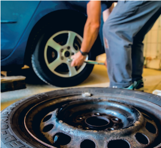
Talvirenkaat kannattaa laittaa alle mieluummin reilusti etuajassa kuin päivä liian myöhään.

Lain mukaan talvirenkaita on pakko käyttää marraskuun alusta maaliskuun loppuun, jos keli sitä edellyttää. Autoliiton barometrin mukaan noin puolet autoilijoista vaihtoi viime vuonna renkaansa lokakuun loppuun mennessä. Ou-