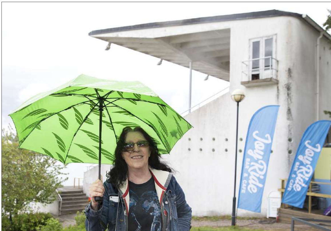
Iki-ihana Muska valloittaa Soutustadionin juhannusaattona.

Juhannusaattona Soutustadionin lavalle nousee iki-ihana Muska Babitzin , joka on ilahduttanut ihmisiä musiikillaan vuodesta 1969 lähtien. Varmaa on, että juhannusaattona yksi Suomen ikonisimmista naisrocklaulajista pistää jälleen sukat jaloissamme pyörimään. Suomen ensimmäiseltä todelliselta naispuoliselta rocklaulajalta voi odottaa juhannusaattona täyden kattauksen legendaarisia biisejä. Muskan jäljittelemätön ääni on persoonallinen. Tuttavani tituleerasi häntä osuvasti Suomen Janis Jopliniksi. Vaik-