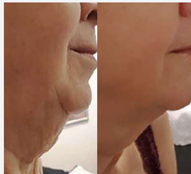
Ennen ja jälkeen yhden hoitokokonaisuuden jälkeen