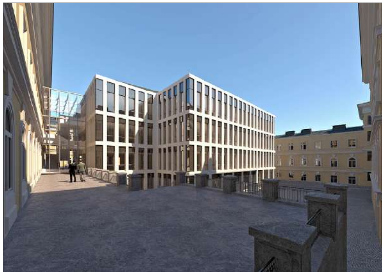
ARKKITEHTITOIMISTO SARC OY

”Tässä ikään kuin uhataan paikalla olevan rakennuksen toiminnan loppuvan valtion keskushallinnon puolesta, ellei uudisrakennusta saada aikaiseksi. Tuntuu oudolta, että Senaatti-kiinteistöt-liikelaitos saa sanella muille toimijoille ehdot arvokkaan kokonaisuuden peruskorjauksesta – samalla turmellen kort-