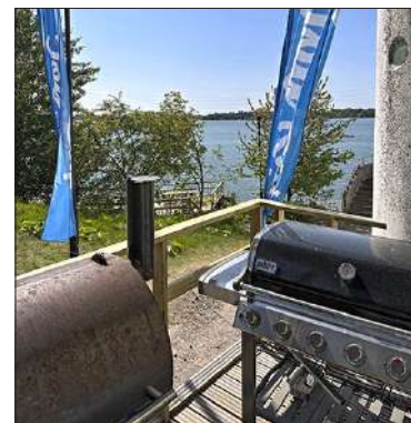
Auvoisen kesäpäivän kruunaa hiiligrilli, suomalaiskansallisen kesänvieton keskeinen elementti.