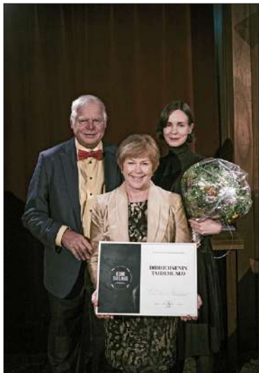
Didrichsenille myönnettiin viime vuonna Helsinki Travel Award -palkinto matkailun ansiokkaasta edistämisestä.