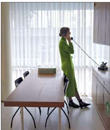
ELINA BROTHERUS, 2022

Vierailija-näyttelyn valokuviissa pääsee kurkistamaan myös yleisöltä suljettuihin tiloihin, joissa fiktiivinen hahmo elää normaalia arkea.