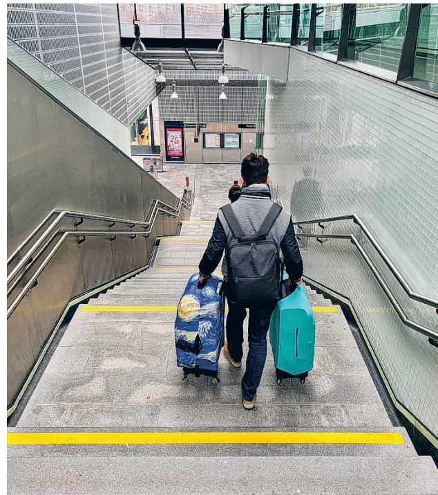
Suurimmat ulkomaan kansalaisten ryhmittymät Etelä-Pohjanmaalla olivat ukrainalaiset 28,3 prosenttia, virolaiset 9,2 prosenttia, venäläiset 8,6 prosenttia, unkarilaiset 3,9 prosenttia ja thaimaalaiset 3,7 prosenttia. Kuvituskuva.

Viime vuosina muuttovirtomäärät ovatkin kasvaneet merkittävästi aikaisempiin vuosiin verrattuna. Nettomaahanmuuton kasvun taustalla on ollut ukrainalaisten kotikuntavalinnat sekä työ- ja koulutusperäisen maahanmuuton lisääntyminen.