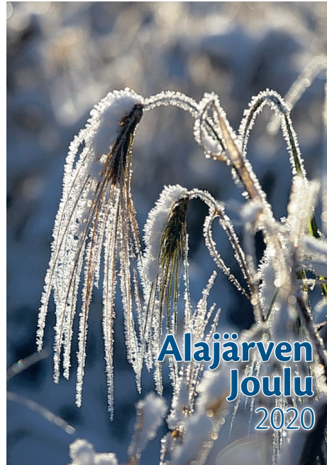
Viimeksi Alajärven Joulu -lehti tehtiin vuonna 2020.

Tämä Alajärven Joulu -lehti on ollut mahtava projekti, sillä olen itsekin vahvasti