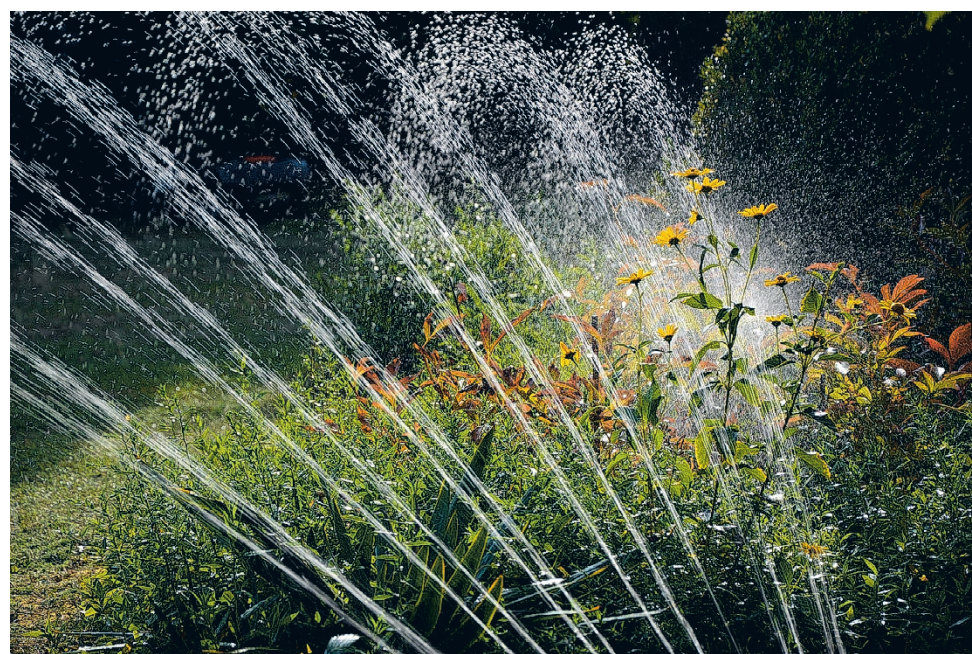
Kuivuus- ja hellejaksojen aikana vedenkäyttö lisääntyy, mikä osaltaan voi aiheuttaa ongelmia veden riittävyydelle.

Lisäksi kuivuusaikana kasteluveden tarve kasvaa esimerkiksi maataloudessa ja golfkentillä. Toisaalta rankkasateet taas lisäävät hulevesiä viemäreissä, mikä voi johtaa ylivuotoihin ja puhdistamattoman