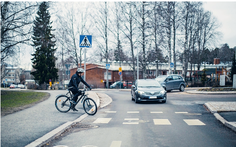
Liikenneympyrästä poistuvien ajoneuvojen on väistettävä tietä ylittävää jalankulkijaa, polkupyöräilijää ja mopoilijaa.

Pihasta poistuvan autoilijan väistämisevelvollisuus