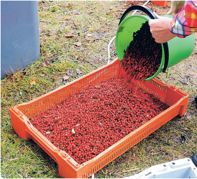
Laatikot täyttyivät puolukoista marja-aseman viimeisenä ostopäivänä.

– Viimeisenä päivänä ostohinta oli 2,50 euroa kilolta. Omaan aikaan ei ole koskaan ollut näin korkeaa hintaa. Hinnan määrää ostaja, Polproduct, ja meille ilmoitetaan a-