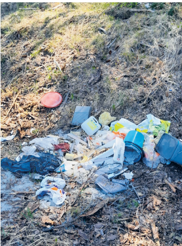
Roskaa tienvarressa keväällä 2024 Alajärvellä.

Ilkivalta ja roskaaminen vai- keuttavat ELY-keskuksen työtä