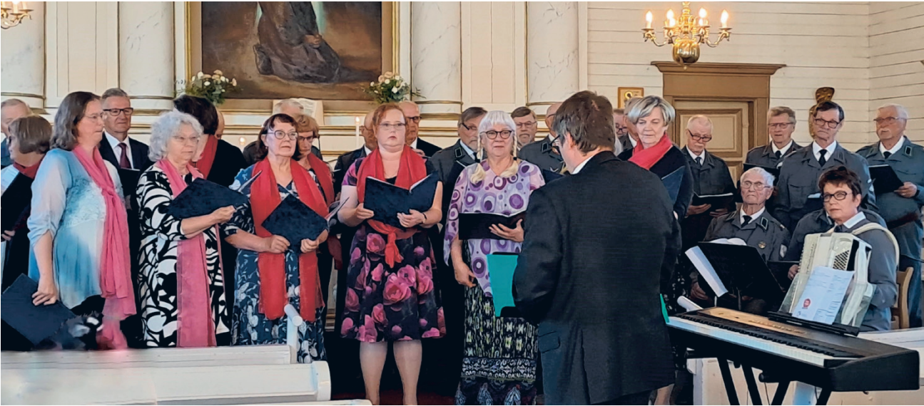
Parisataa kuulijaa nautti kauniina kesäiltana Alajärven kirkossa Korsukuoron ja Kirkkokuoron yhteiskonsertissa.

Hiippakunnan toimintamenoista suurin osa kuluu palkkoihin ja palveluiden ostoihin.