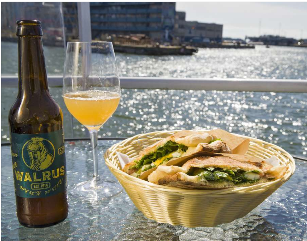
Aurinkokannella saa pieneen nälkään suurta ja maukasta helposti. Walrusin sardinialainen versio klassisesta muna-anjovisleivästä oli verraton.

Ympäristö kuten itse aluskin on rouhea. Telakkarannalla jökötää uutta arkkitehtuuria sulassa sovussa vanhan miljöön kanssa. Helsingin telakalta on seilannut monen sortin laivoja, joita on rakennettu Hernesaaressa vuodesta 1865 lähtien.