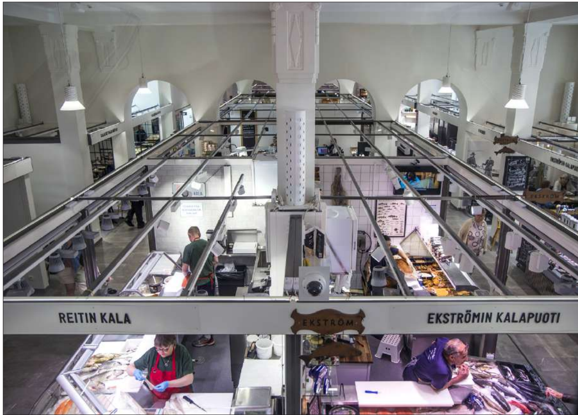
Hakaniemen kauppahallin uusi ilme on valoisa ja korostaa myös rakennuksen arkkitehtuuria.

Punaisen Langan kolme pääar- tikkelia ovat napit, nauhat ja ve- toketjut, joiden vuoksi kauppaan tullaan kauempaakin, samoin neppareiden. Nappeja on tarjol- la kymmenisen tuhatta erilaista