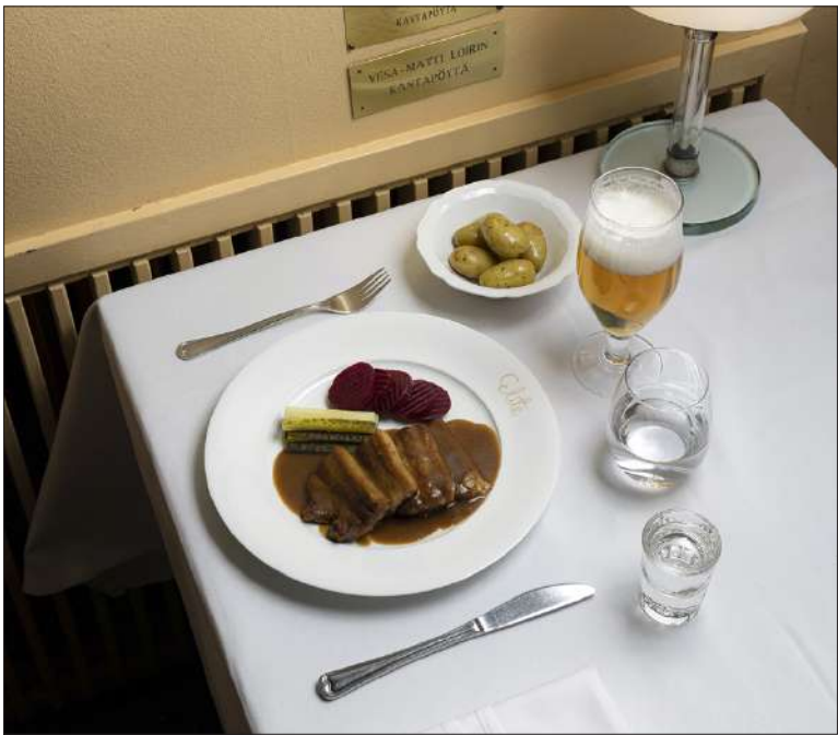
Ravintola Eliten kanta-asiakkaisiin kuulunut taiteilija Vesa-Matti Loiri sai ravintolan legendaarisen taiteilijapöytään muistolaatan ja ruokalistalle nimikkoannoksena perinteisen läskisoosin.

”Taide ja kulttuuri ovat aina olleet Elitessä läsnä niin henkisesti kuin fyysisestikin, eikä vähiten sen vuoksi, että viereisestä Lallukan taiteilijakodista oli aikoinaankin helppo siirtyä Eliten hohtavien pöytäliinojen äärelle maailmaa luomaan ja parantamaan. Ra-vintola-asiakkaana Vesku ei poi-kennut muista vieraistamme, sil-lä kulttuuriväki ja korttelinaapurit ovat meillä aina sulassa sovussa. Periaattemme onkin tarjota viih-