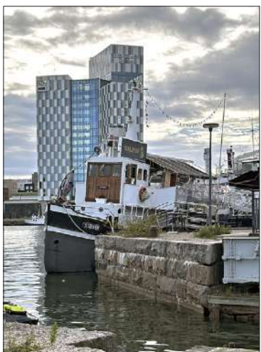
Vuonna 1914 valmistunut satamahinaaja Steffen palvelee nyt Walrus-ravintolalaivana Hietalahdessa.

vuosikymmenet kodikas alus on viettänyt leppoisia eläkepäiviä ravintolalaivana. Huvittavaa on myös laivan lokoisa pistäytymisen aivan umpisisämaassa Forsassa, Kaukjärven rannalla.