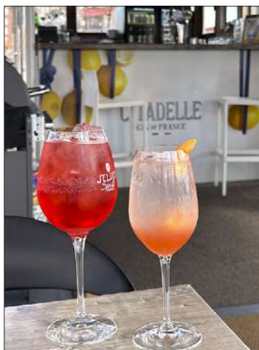
Kesäisten juomasekoitusten lähtökohtana ovat itse valmistetut siirapit ja pyreet sekä laadukkaat alkoholit. Baari sijaitsee laivan komentosillalla.

MERISÄÄ kohottaa ruokahalua. Alakannella, missä sijaitsee myös 24-paikkainen viihtyisä salonki, sardinialainen kokki Francesco paistaa pizzoja ja vaalii hartaudella pizzataikinan tekeytymistä. Taikinaprosessi kestää kahdesta kolmeen päivään. Täydellinen lopputulos on monen tekijän summa. Lämpötila, ilmanpaine ja kosteus ovat muuttujia, joiden pitää olla balanssissa. Siksi lepäävästä taikinasta pitää huolehtia koko ajan.