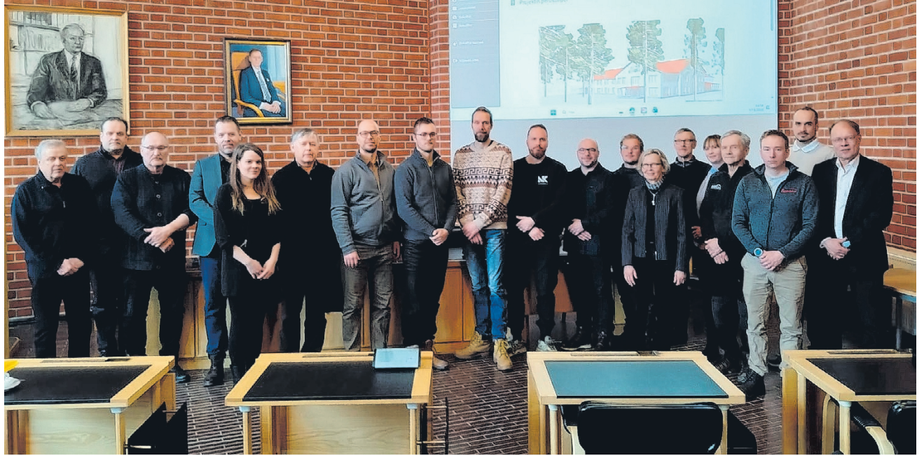
Kaupungin edustajat, suunnittelija ja urakoitsijat Paavolan kouluhankkeen aloitustilaisuudessa.

Kysely on avoinna 17.4. saakka. Kyselyyn vastataan anonyymisti ja kyselyn tuloksia hyödynnetään vain strategian päivitystyössä. Paperisia kyselylomakkeita on saatavilla kunnantalolla ja kirjastossa.