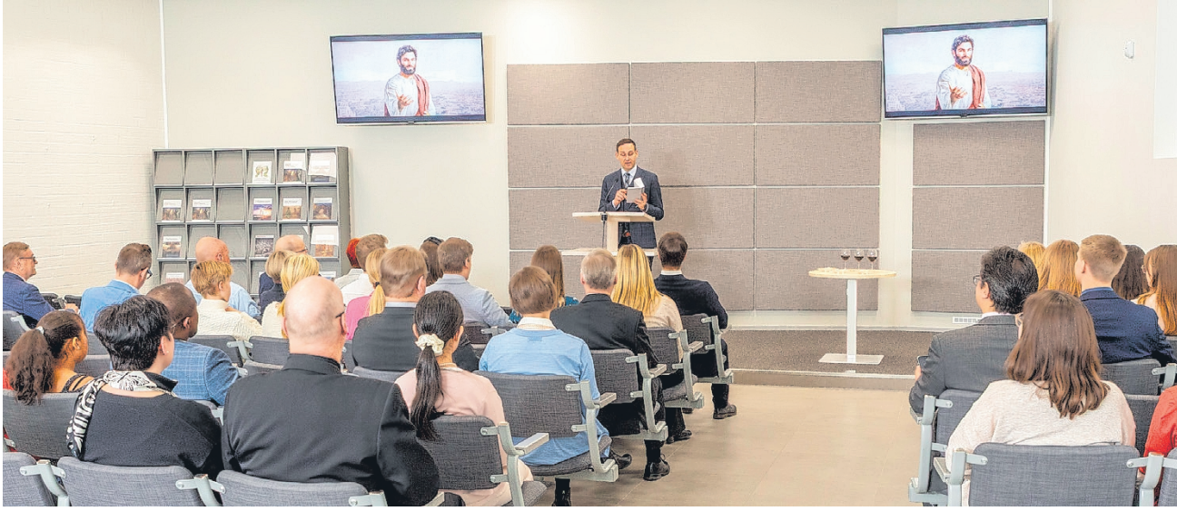
Vimpelin seurakunta järjestää noin tunnin mittaisen tilaisuuden torstaina 2. huhtikuuta valtakunnansalilla kello 20.