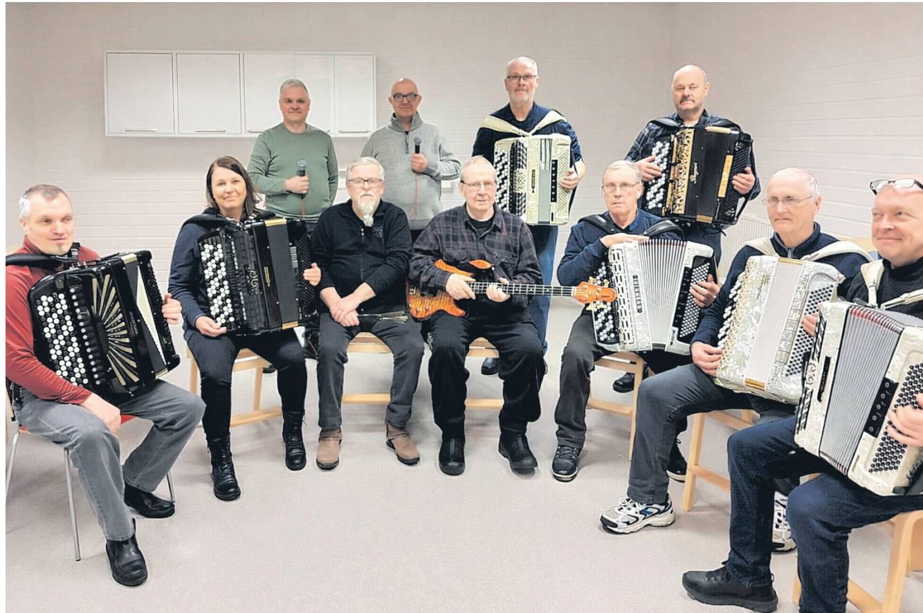
Myrskyn jälkeä -konsertissa kuullaan Järvi-Pohjanmaan kansalaisopiston harmonikkapiirin ja rytmiryhmän esittämää tuttuja iskelmiä vuosikymmenten varrelta.