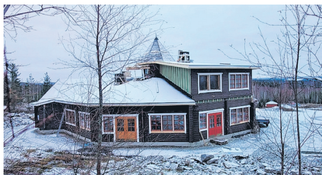
Vimpelin Lakaniemi-Pokela-Pyhälahti-Viitaniemi -alueen kyläyhdistys on ollut jo vuosien ajan rohkea ja innokas hanketoteuttaja. Suurin yksittäinen projekti on ollut kylätalon toteuttaminen vuosina 2019-2020. Arkistokuva.

Kilpailun tarkoituksena on nostaa esiin kyliä, joissa teh-