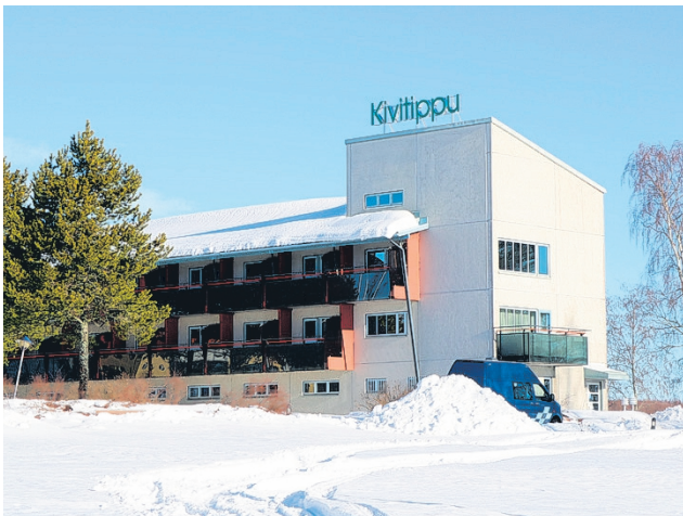
Lappajärven sosiaali- ja terveysaseman palvelut muuttavat maaliskuuhuhtikuun vaihteessa uusiin tiloihin Kivitipun hoitolasiipeen.

Muutos ei vaikuta palveluiden yhteydenottoihin – asiakkaat voivat jatkossakin ottaa yhteyttä tuttujen numeroiden