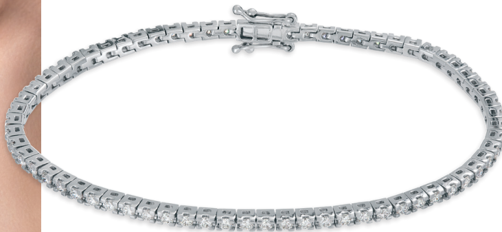
MARSEILLE 16 timanttia yht. 0,64 ct 20155736/20155731