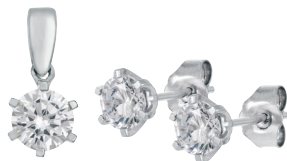
3. PARIS briljanttihiottu W/SI timantti Riipus 0,10-1,00 ct 20123067 Korvakorut yht. 0,10-2,00 ct 20122978