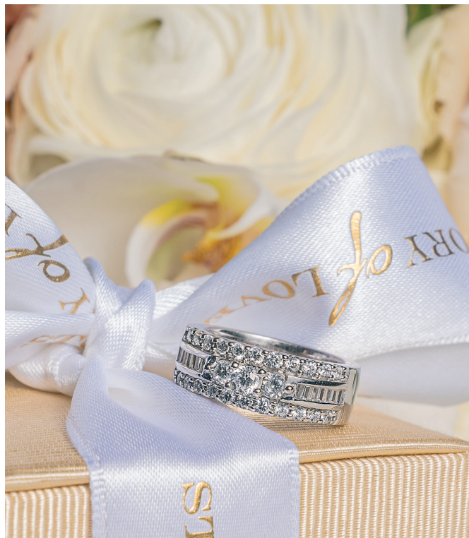
2. LAS VEGAS 37 timanttia yht. 1,03 ct 40936/40835