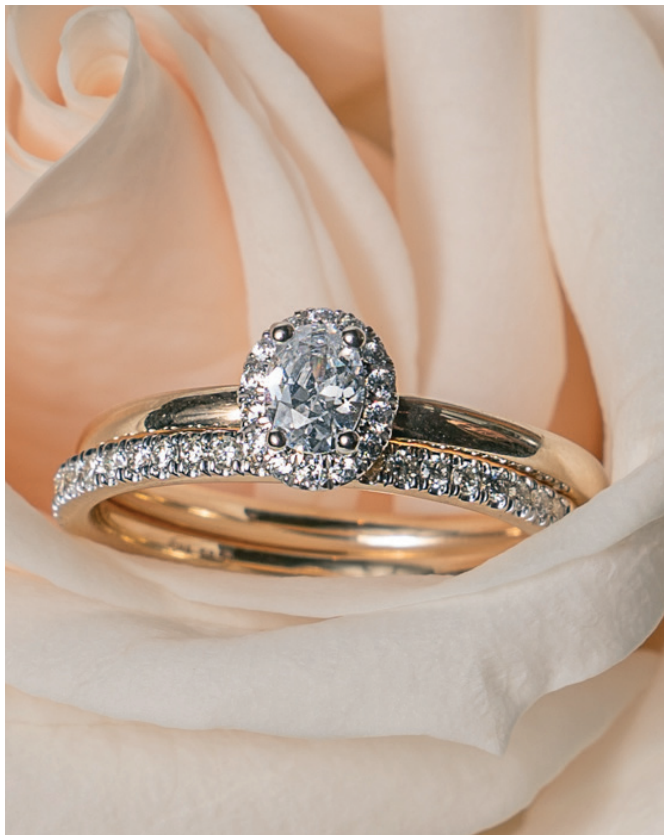
LJUBLIANA 15 timanttia yht. 0,38 ct 18K 20152650