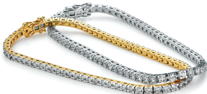
RIMINI rannekoru 67 timanttia yht. 2,00 ct 20124639