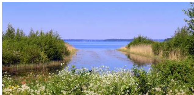
Etelä-Pohjanmaan vetovoimatekijöinä korostuvat luonto, kustannustaso, turvallisuus ja arjen soljuminen.

Etelä-Pohjanmaan vetovoimatekijöinä korostuvat luonto,