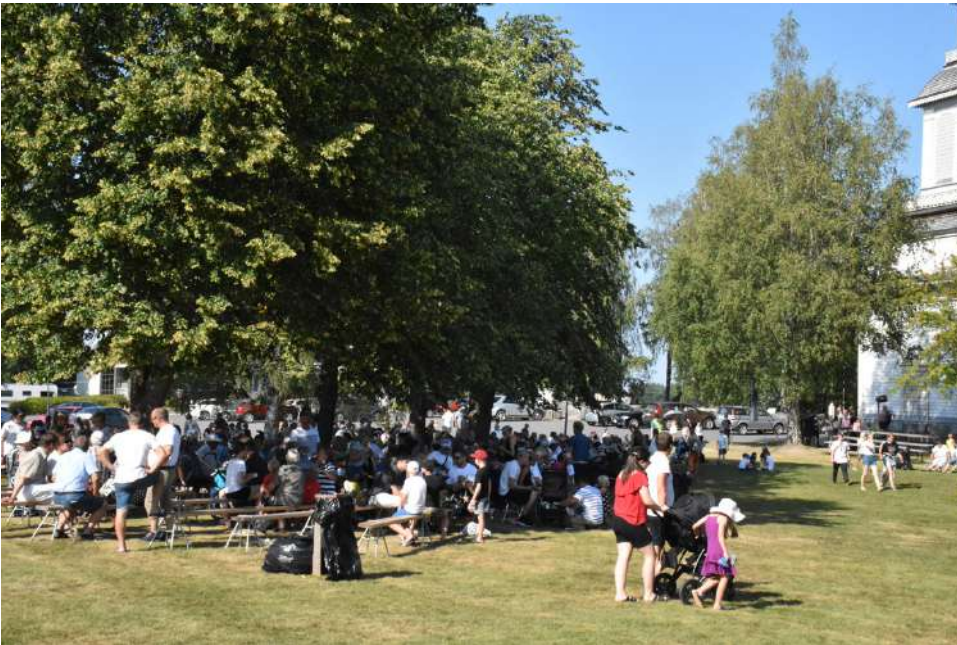
Alajärven Rauhanyhdistyksen Kesäseurat ovat koonneet väkeä yhteen ja sanan äärelle lähes sata kertaa. Vuosikymmenten varrella Kesäseurojen tapahtuma-aika on vakiintunut heinäkuun loppuun. Kuva vuodelta 2020.

lä pidettävien maakunnallisten seurojen ajankohta on vakiintunut heinäkuun loppuun. Alun perin seurat järjestettiin helluntaina.