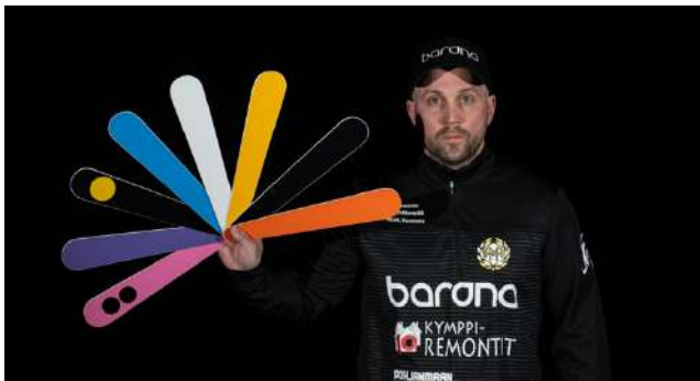
Ankkurit kohtaa Talvisuperissa ensi sunnuntaina Vimpelin vedon!

Päätoimittaja: Tuula Jokiahon toimitus@torstai-lehti.fi • 040 736 7873