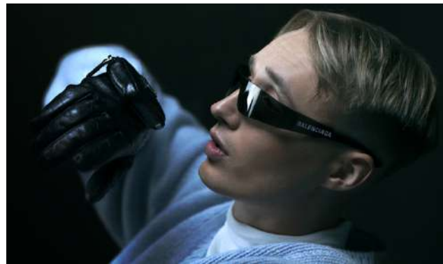
Saarikenttä Festivaaleilla ensi kesänä tunnelmaa nostattaa muun muassa Isac Elliot!

set liikkumaan hyvin pesäpallokansaa unohtamatta, kertoo