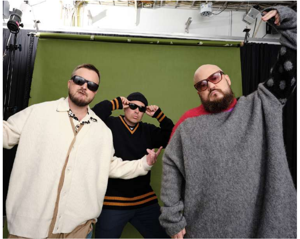
Teflon Brothers on yksi Saarikenttä Festivaalien heinäkuuisista esiintyjistä.

On hienoa, että saamme näin upean kattauksen kovia kotimaisia artisteja esiintymään tapahtumaamme. Uskomme että saamme Järvisen asukkaat ja kesälomalai-