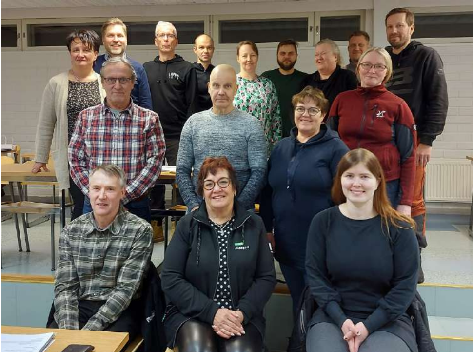
Aisaparin hallituksen jäsenet ja varajäsenet ovat oman alueemme EU-päättäjiä. Kuvassa järjestäytymiskokouksessa paikalla olleet jäsenet ja varajäsenet.

Osa hakemuksista on vielä valmistelussa, mutta Aisaparin hallitus on puoltanut rahoituksen myöntämistä