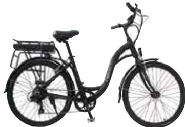
Emotorad CITY 999€