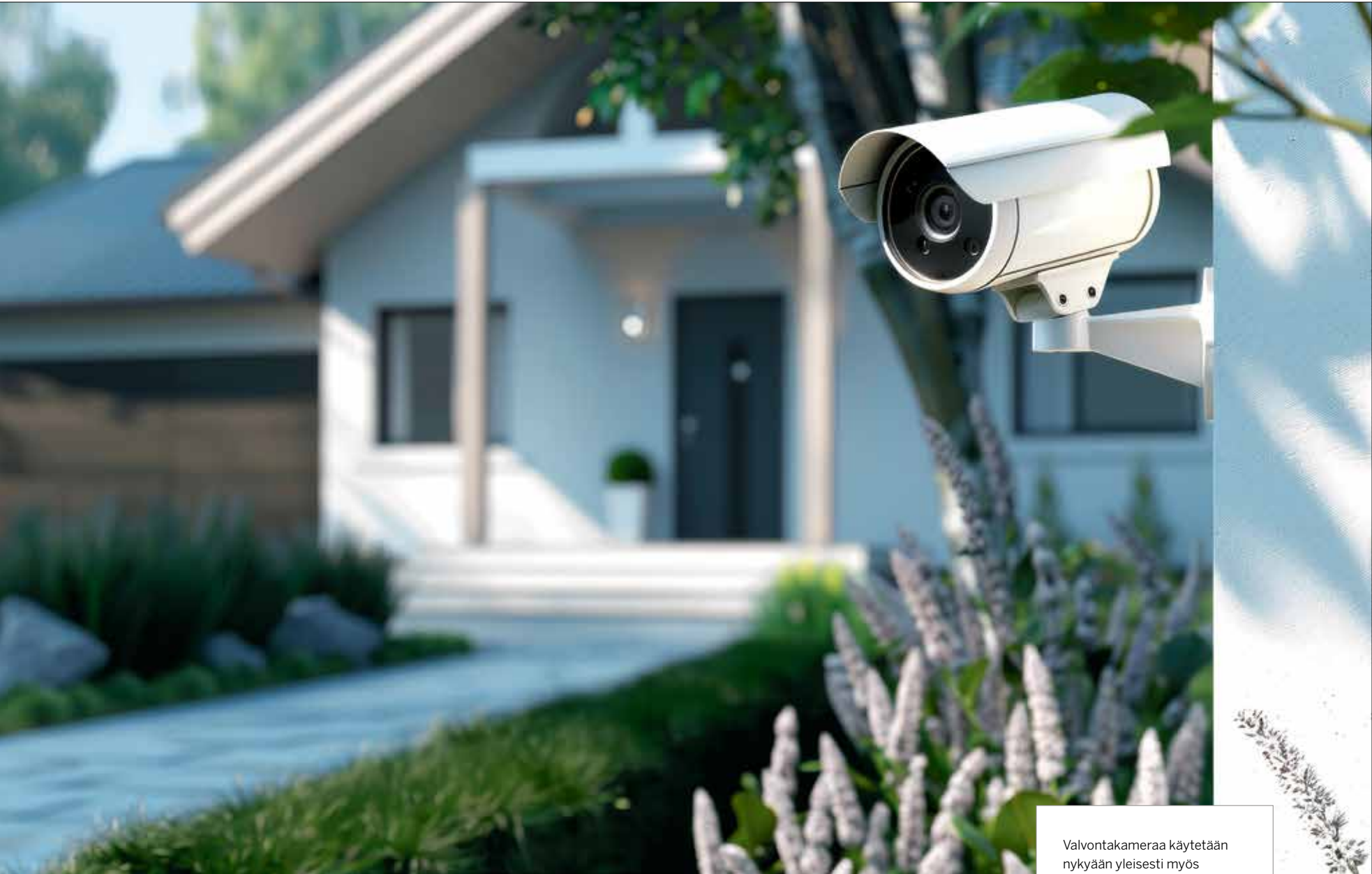
Valvontakameraa käytetään nykyään yleisesti myös yksityiskodeissa.