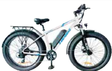
Emotorad Fat 1530€

Tule tutustumaan Ypäjälle, kysy lisätietoa puhelimitse tai katso lisätietoa soitteesta Antinvalinta.fi