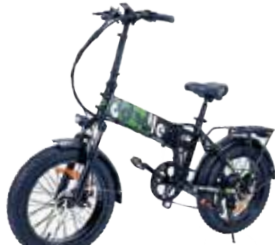
Emotorad Doodle 990€