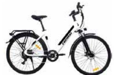
Emotorad EVA 1050€