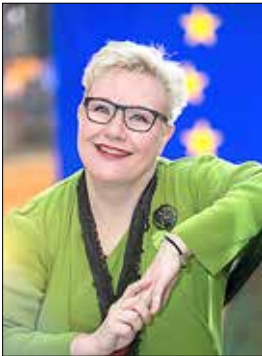
Sirpa Pietikäinen Kirjoittaja oli Euroopan parlamentin jäsen vuosina 2008–2024 ja nousee mahdollisesti varasijalta parlamenttiin 10. vaalikaudelle.

Omakotitalo on omavaraisuuden kannalta kannattavaa, sillä omakotitaloasuja pystyy helpommin vaikuttamaan omaan kulutukseensa. Omakotitaloasuja pystyy helpommin siirtymään edes osittain omavaraiseen energiantuotantoon ja lämmitykseen muun muassa aurinkopaneeleja ja ilmanlämpöpumppuja asentamalla tai takkaa lämmittämällä. Uusiutuvaan energiaan siirtyminen vakauttaa energian hintaa, sillä uusiutuvat energianmuodot eivät ole alttiita maailmanmarkkinoiden heilahduksille. Parhaimmillaan omakotitaloista saadaan energiaremonteilla kehitettyä passiivitaloja, jotka eivät tarvitse kiinteistön ulkopuolelta ostettua energiaa.